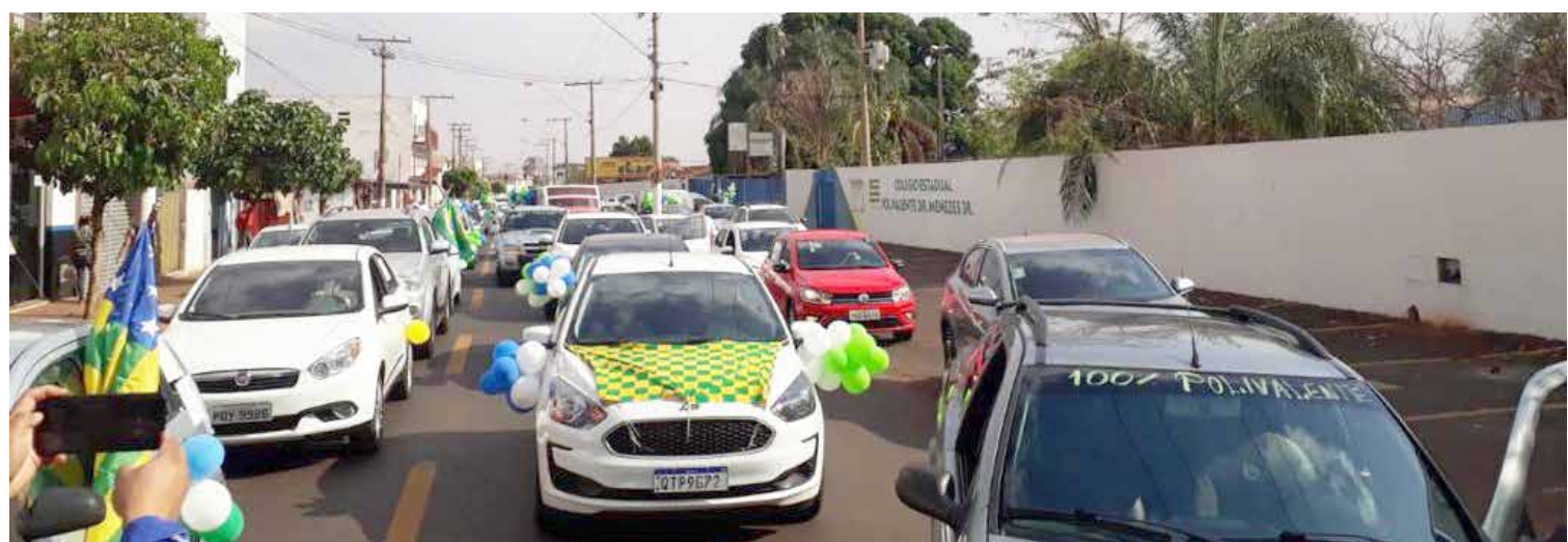
Carreta percorreu as unidades escolares da rede estadual em Itumbiara