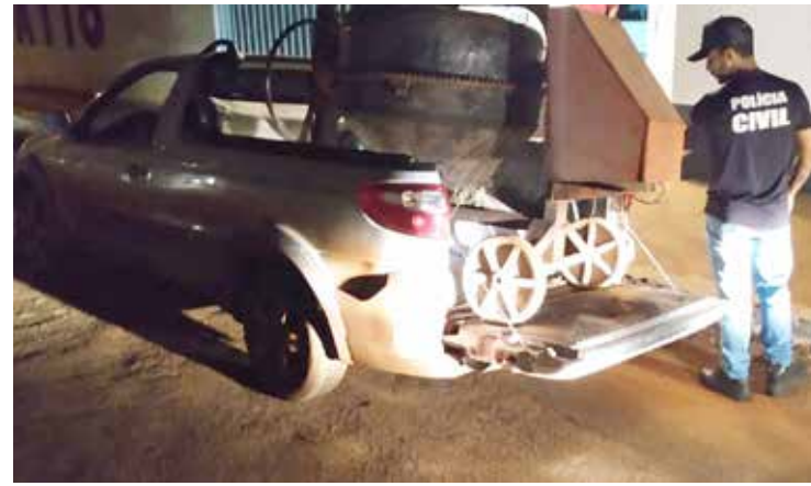
Betoneira foi encontrada pela Polícia Civil e receptor foi preso em flagrante

Os policiais civis acionaram a vítima do furto para reconhecimento do bem onde constatou-se que seria de sua propriedade. Foi dada voz de prisão ao autor pela prática do crime de receptação previsto no artigo 180 do código penal brasileiro em seguida conduzido para o hospital local para confecção de relatório médico e posteriormente para delegacia para lavratura do Auto de Prisão em Flagrante Delito. Onde o autor ficará à disposição do Poder Judiciário.