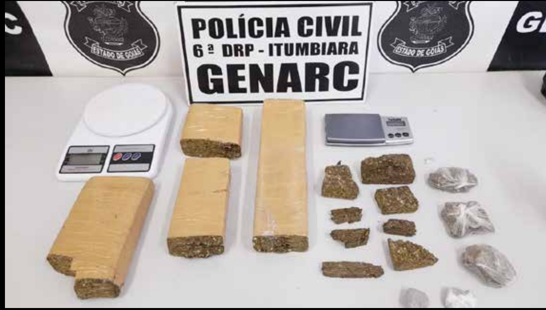
Drogas apreendidas na suspeita de tráfico pela Polícia Civil

A mulher vinha sendo investigada pela Polícia Civil, eis que estava traficando drogas no