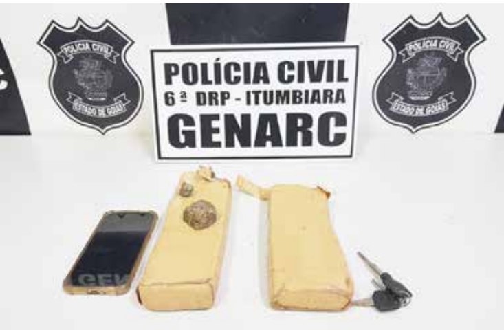
Maconha apreendida na BR-452, em Itumbiara

O traficante foi socorrido ao Hospital Municipal, atendido e liberado, sendo que em seguida, foi conduzido a sede da Polícia Civil e autuado em flagrante delito pelos crimes de tráfico de drogas e resistência. O detido, que já tem passagem por tráfico de drogas em Goiatuba, foi recolhido posteriormente na unidade prisional de Sarandi, em Itumbiara, ficando à disposição do Judiciário.