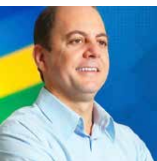
Gugu Nader (PSL) 26,9%

A pesquisa foi realizada pela Fortiori Pesquisa, Diagnóstico & Marketing/EIRELI CNPJ 05.850.850/0001-00 e contratada pela WM GRAFICA E EDITORA EIRELI / JORNAL HORA EXTRA CNPJ 05.104.651/0001-45, sendo realizada entre os dias 01 a 03 de setembro de 2020. Foram entrevistados 402 eleitores em Itumbiara. Margem de erro de 4,9 pontos percentuais e intervalo de confiança de 95%. Registro número GO-03440/2020.