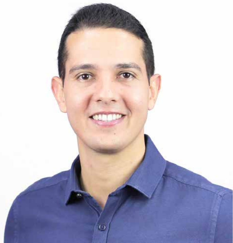
Prefeito Zé Antônio (Republicanos) terá o maior time de candidatos a vereador, com cerca de 150 nomes na disputa

Embora ainda não tenha atingido dois dígitos nas pesquisas divulgadas até agora, o prefeito Zé Antônio (Republicanos) conta com um trunfo para as eleições de novembro: ele terá um “exército” de quase 150 candidatos a vereador nos partidos de sua base eleitoral para pedir votos a partir do dia 27 de setembro. A coligação majoritária de Zé Antônio (lembrando que as proporcionais estão vedadas) contará com Republicanos, Solidariedade, PSD, PROS, PT, PCdoB e provavelmente Avante e Patriota. Se todos lançarem chapa completa, com 18 nomes cada legenda, serão 144 candidatos a vereador. Esse quantitativo de candidatos, distribuídos em todos os bairros da cidade, pode ser um diferencial na campanha de Zé Antônio, que vai buscar a reeleição no dia 15 de novembro. Nas últimas semanas o prefeito intensificou os contatos políticos, buscando ampliar o apoio de partidos e lideranças para formar um time forte e competitivo para as eleições que se avizinham.