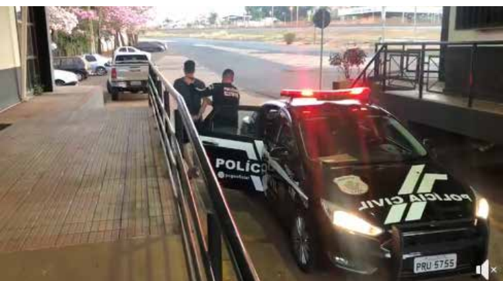
Prisão do suspeito na sede da 2ª DDP