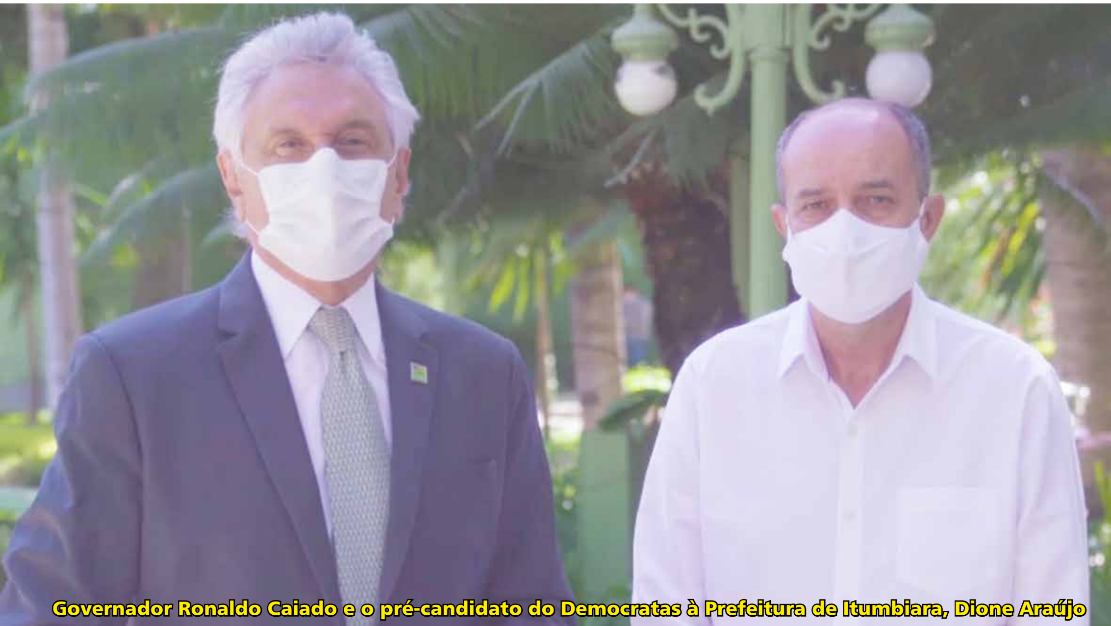
Governador Ronaldo Caiado e o pré-candidato do Democratas à Prefeitura de Itumbiara, Dione Araújo