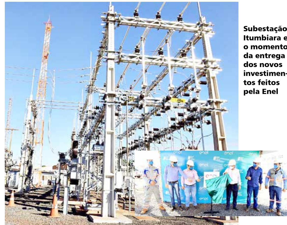
Subestação Itumbiara e o momento da entrega dos novos investimentos feitos pela Enel

A Enel Distribuição Goiás entregou, nesta segunda-feira, 31/08, a ampliação e modernização da Subestação Itumbiara Nova, no município de Itumbiara. Segundo informa a assessoria da companhia, foram investidos mais de R$ 6,6 milhões em melhorias, com a modernização e substituição de equipamentos em final de vida útil, e ampliação da capacidade de oferta de energia. Todo esse investimento trará melhorias para o fornecimento de energia de mais de 20 mil clientes do município.