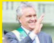
Ronaldo Caiado Governador de Goiás