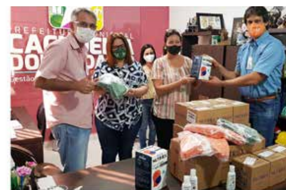
A SJC Bionergia fez doação de kits de teste rápido, máscaras hospitalares N95, máscaras de pano e frascos de álcool em gel para os municípios de Cachoeira Dourada e Inaciolândia