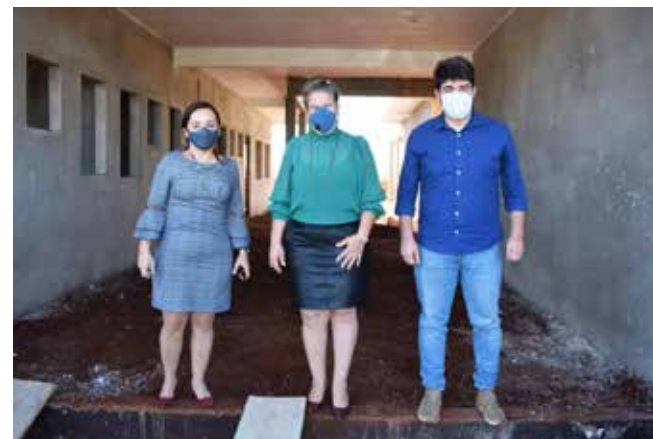
Secretária Cristiane (Educação e Cultura), prefeita Renata e deputado Zé Vitor

Deputado federal Zé Vitor (PL-MG) visitou Araporã na última terça-feira, dia 07, para um giro nas obras em andamento e outras já entregues na gestão da prefeita Renata Borges. O parlamentar ficou impressionado com a quantidade de obras e o salto no progresso e desenvolvimento de Araporã nestes últimos três anos e meio. "O segredo é ter gestão, compromisso com o povo e saber gerir a máquina pública. Agradecemos o deputado por sempre lembrar de Araporã em suas emendas", afirmou Renata.