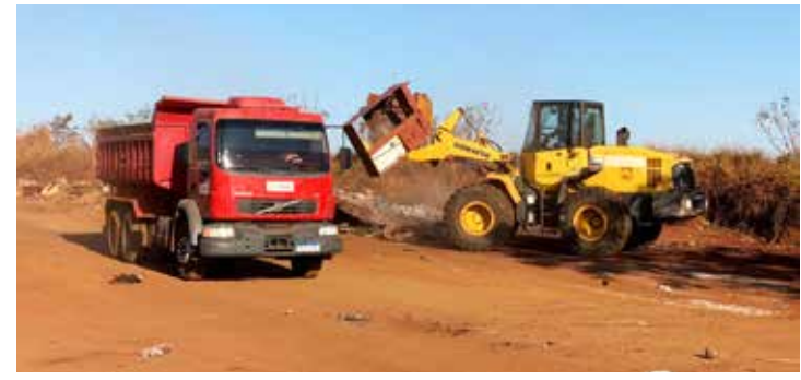
Limpeza na entrada da região da Prainha e na estrada velha de Cachoeira Dourada