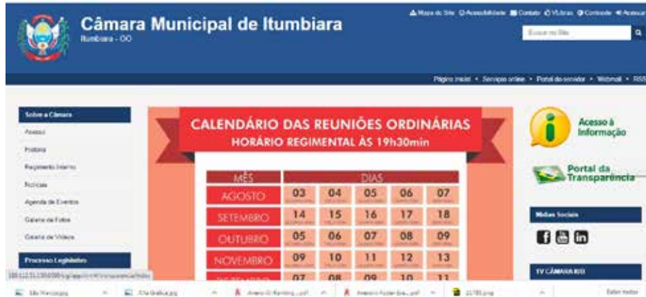
Site da Câmara: www.itumbiara.go.leg.br

RANKING DA TRANSPARÊNCIA DO TCM COLOCA SITE DA PREFEITURA NA 240ª POSIÇÃO ENTRE OS 246 MUNICÍPIOS GOIANOS; SITE DA CÂMARA OCUPA 198ª POSIÇÃO