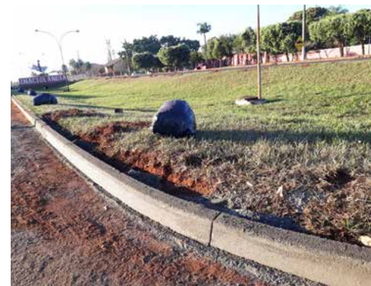
Construção de meio-fio em canteiros centrais