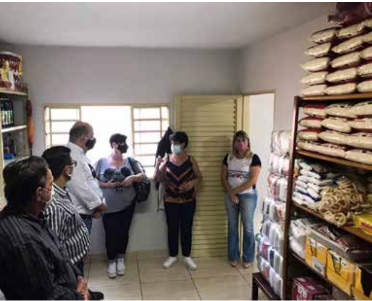
Equipe da Prefeitura na visita ao Solar dos Idosos Dona Maria de Lourdes

O Departamento de Assistência Social do Centro Espírita Jesus de Nazareno, foi constituído em 1971, sendo uma associação sem fins lucrativos que tem por