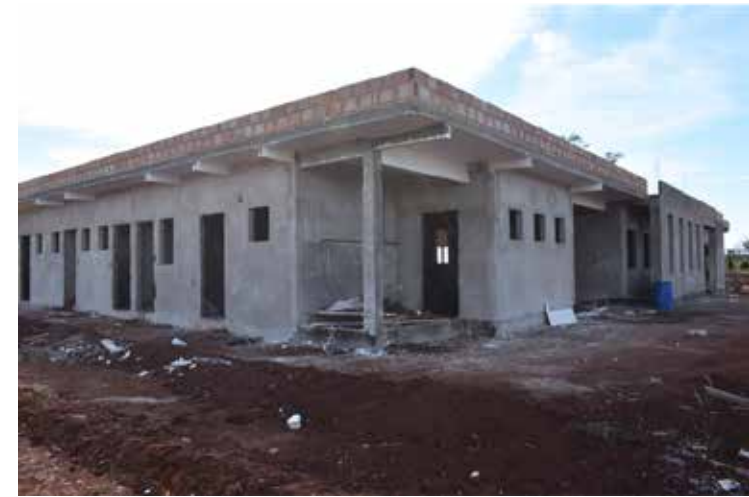
Obra entrou em fase acabamento e será entregue em breve pela Prefeitura de Araporã