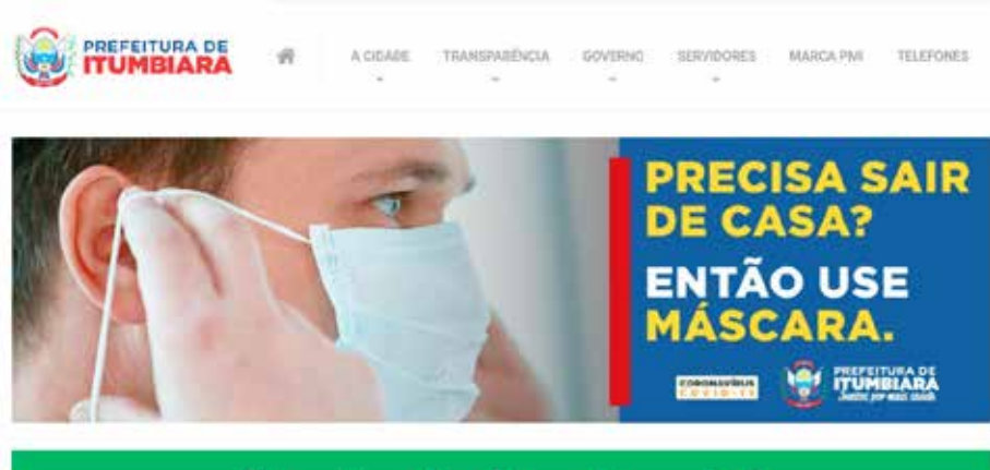
Site da Prefeitura: www.itumbiara.go.gov.br