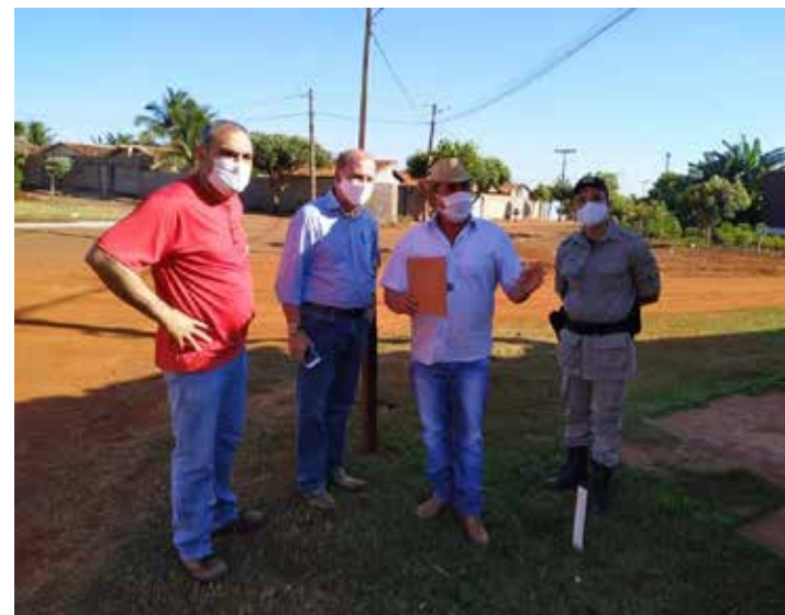
Chiquinho acompanha serviço de topografia

de embelezar a cidade, o meio-fio ajuda na conservação do asfalto e valoriza os imóveis. A Prefeitura teve que refazer o serviço em alguns locais, já que vândalos destruíram o meio-fio.