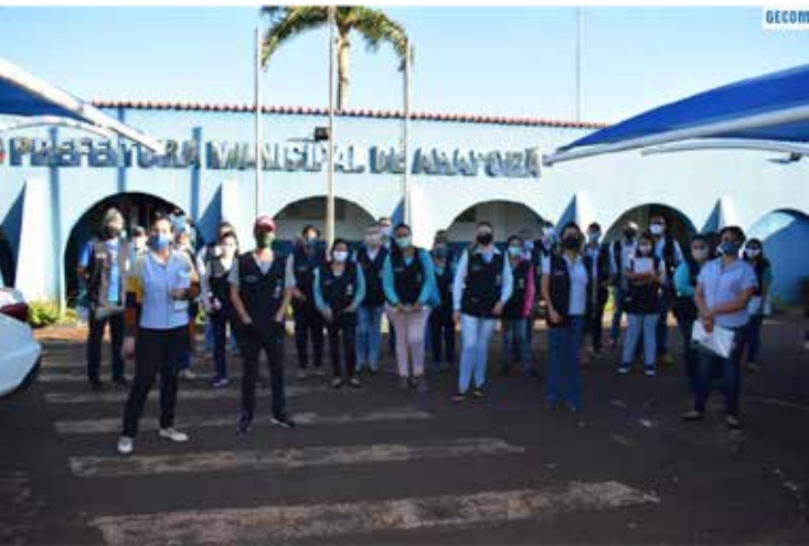
Equipe de fiscais da Prefeitura de Araporã

Essa é mais uma ação do poder público visando coibir a proliferação do vírus na cidade, além de orientar a população sobre as medidas de proteção e os riscos da doença. No último boletim epidemiológico, Araporã tinha 51 casos confirmados e duas mortes.