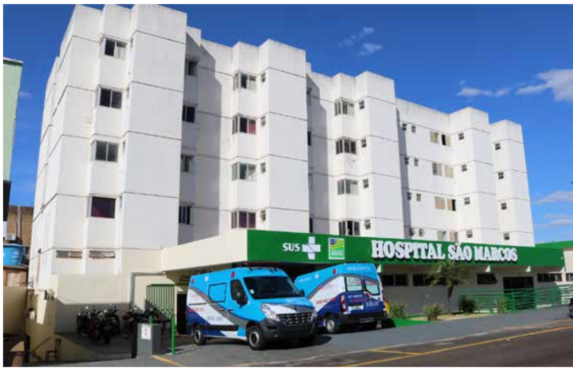
Hospital abre as portas com 20 leitos de UTI e 50 de enfermagem, além de duas UTI Móvel. Capacidade será ampliada para 200 leitos e 30 de UTI