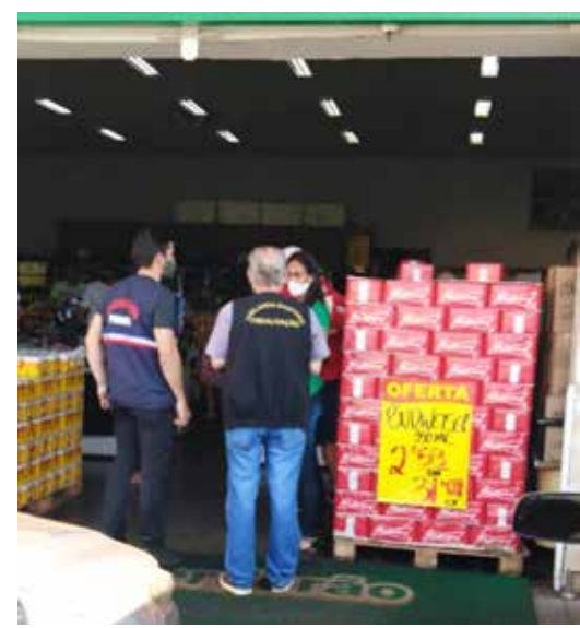
Fiscalização das equipes da Prefeitura no comércio de Itumbiara