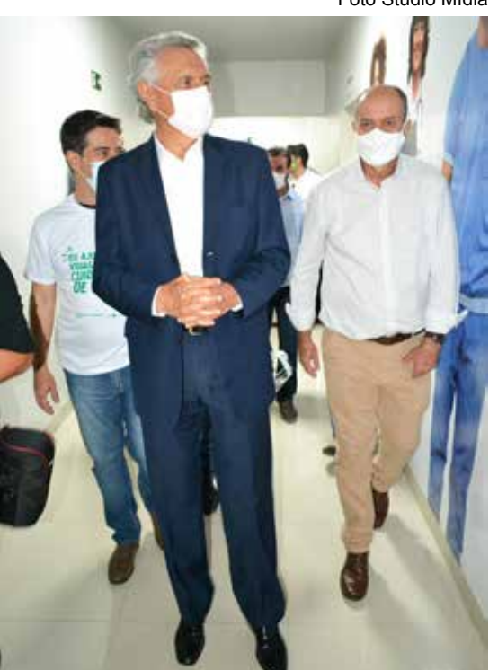
Caiado e Dione conhecendo as instalações do Hospital São Marcos

derá à população do Sul e Sudeste do Estado, é mais um passo na regionalização da saúde promovida na gestão Ronaldo Caiado. “Terminado o coronavírus, o São Marcos será um hospital regional do Estado de Goiás. Ele será referência da boa medicina e também da qualidade do ensino médico, já que temos um curso de medicina aqui no município”, ressaltou o governador, referindo-se ao polo da Universidade Estadual de Goiás (UEG) que oferece o curso na cidade.