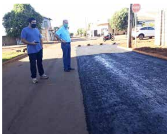
Chiquinho acompanha frente de recapeamento das ruas de Inaciolândia

Mesmo com o grande trabalho das equipes de saúde, Inaciolândia registrou cinco casos de Covid-19, felizmente sem óbitos. As equipes de saúde tem orientado a população, inclusive proprietários de ranchos e fiscalização tem atuado para garantir uso de máscara e disponibilização de álcool em gel e 70% no comércio. O município adotou o sistema intermitente 14X14.