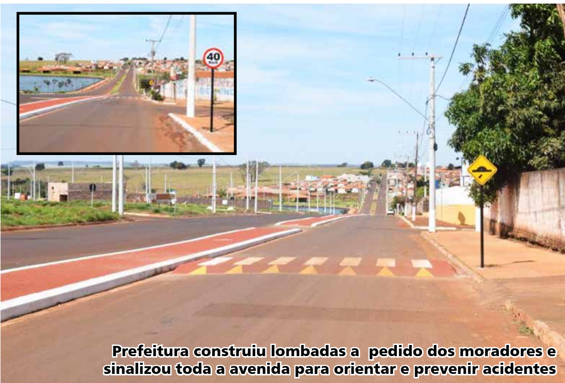
Prefeitura construiu lombadas a pedido dos moradores e sinalizou toda a avenida para orientar e prevenir acidentes