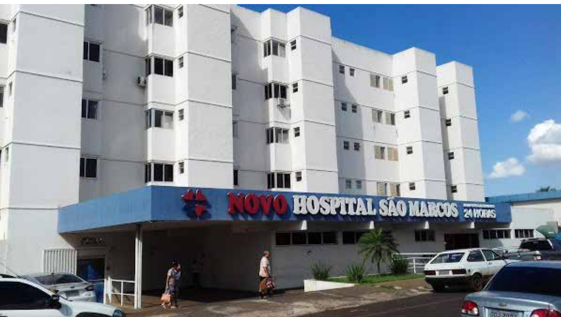
Hospital São Marcos tem custo de operação de R$ 8,5 milhões por mês, que é maior do que todo o orçamento da Secretaria Municipal de Saúde