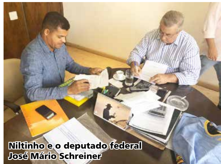
Niltinho e o deputado federal José Mário Schreiner

Câmara dos Deputados – Área 15 – Gabinete 507 República com as Estrelas Brasília DF – CEP: 70160-900 Fone: 61 3019 1967 http://www.camara.gov.br/legisla/041