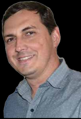
Zé Willian (PL) Prefeito de Panamá

“A arrecadação da Prefeitura caiu nestes três últimos meses e tínhamos que demitir funcionários ou diminuir os serviços públicos. Optamos pela redução nos salários dos agentes políticos neste período de pandemia”