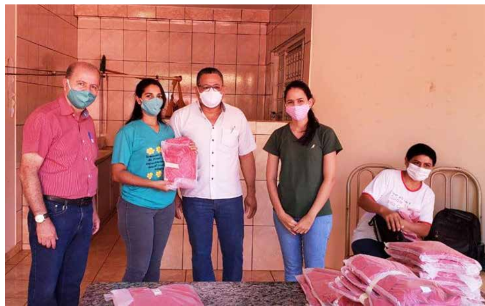
Prefeito Chiquinho na entrega dos novos uniformes aos profissionais de saúde de Inaciolândia