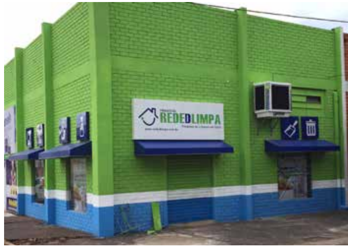
Franquia da REDE D LIMPA em Itumbiara está localizada na Rua Santo Amaro nº 35, Bairro Novo Horizonte, Telefone (64) 3432-1515

Abriu as portas no último sábado, dia 02 de fevereiro, a loja da REDE D LIMPA em Itumbiara. Localizada na Rua Santo Amaro, 35, Bairro Novo Horizonte, a loja vai atender toda a região com os melhores produtos de limpeza e utilidades, com alta qualidade e economia. Considerada a melhor rede de produtos de limpeza do Brasil, com dezenas de lojas, a REDE D LIMPA agora chega a Itumbiara e região.