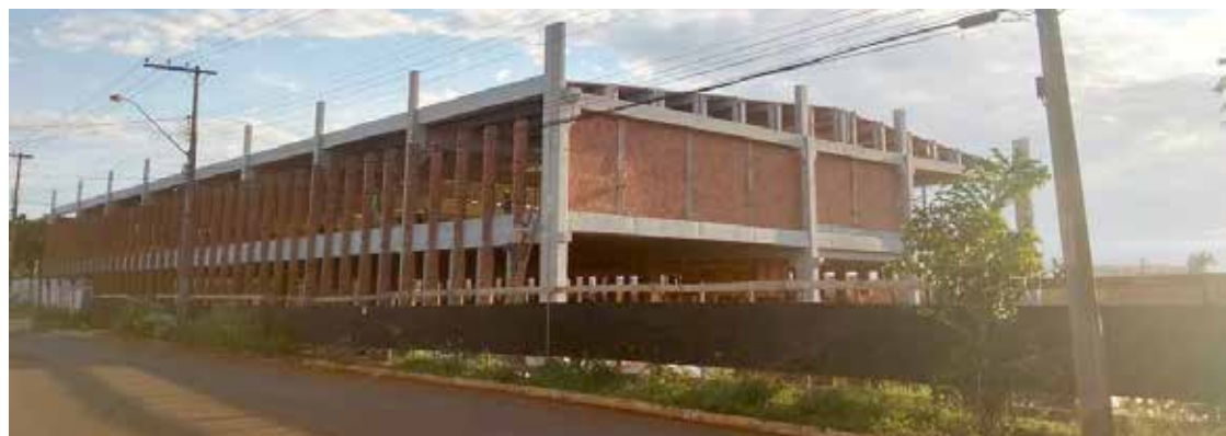
Obra do Campus da Faculdade Una em Itumbiara: inauguração da primeira etapa em breve

Além da graduação, serão oferecidos os seguintes cursos de pós-graduações: MBA em Gestão de Vendas e Relacionamento com o Cliente; MBA em Logística Supply Chain; Pós-Graduação em Engenharia de Materiais e Processos; Pós-Graduação em Direito do Trabalho e Processo do Trabalho; Pós-graduação Neurociências Aplicadas à Educação; MBA em