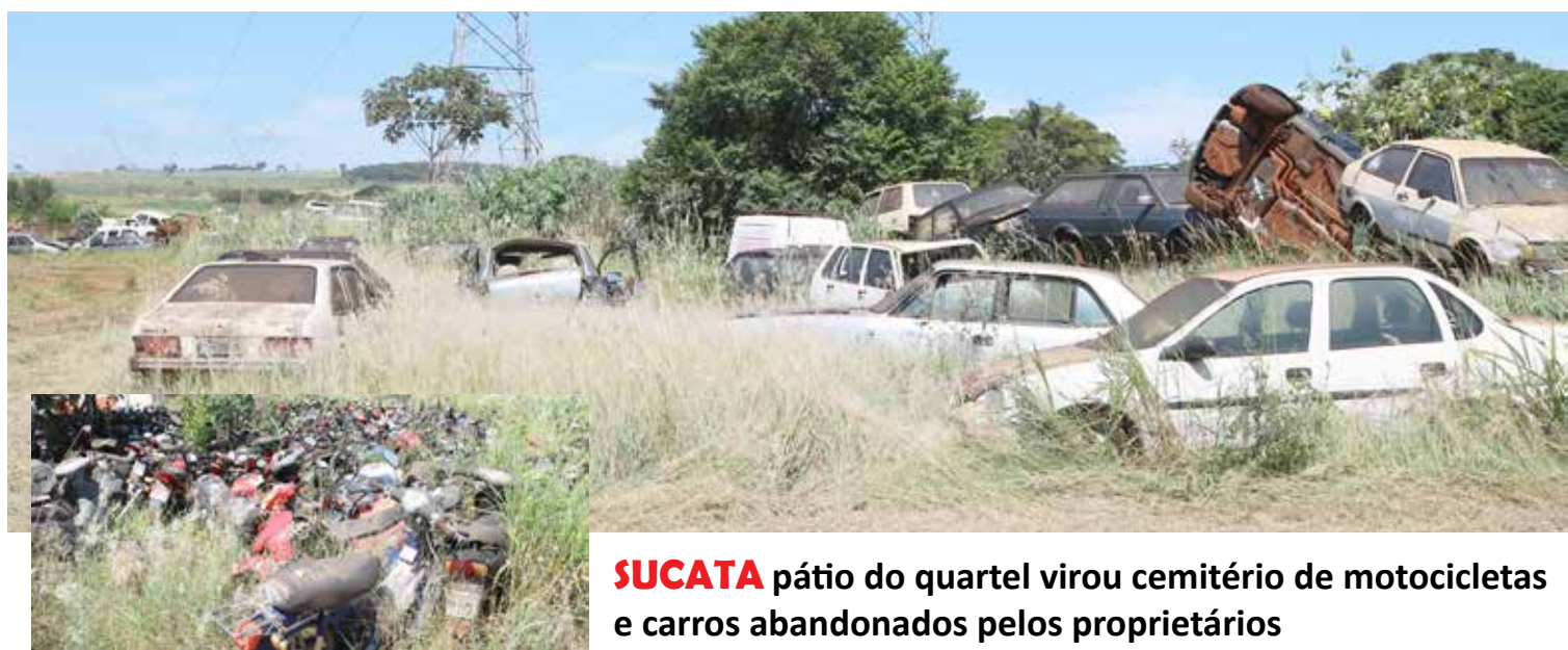
SUCATA pátio do quartel virou cemitério de motocicletas e carros abandonados pelos proprietários