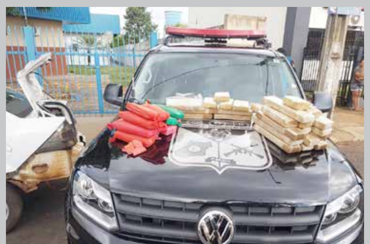
Droga estava escondida dentro do tanque e encostos dos bancos e seria comercializada em Bom Jesus

taram substâncias entorpecentes similares à maconha e envoltas por borracha dentro do tanque de combustível do veículo. Em contínua e minuciosa busca veicular foi encontrado mais tabletes de maconha dentro dos encostos dos bancos traseiros do veículo e ainda dentro da caixa de som automotivo, bem como nos para-choques. Ao final, foram apreendidos 37 tabletes de substância similar à maconha, resultando em 30 quilos 480 gramas de drogas. Na entrevista, o autor confessou que trouxe o entorpecente de Campo Grande/MS e o levaria para Bom Jesus/GO. Diante dos fatos foi dado voz