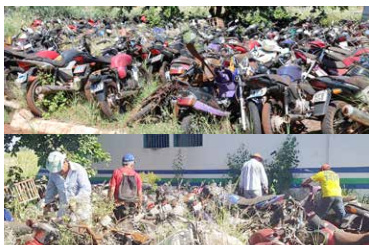
Agentes de endemias buscam eliminar focos de dengue, enquanto o comando tenta limpar o pátio do quartel