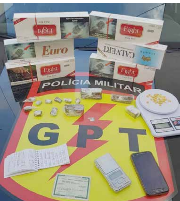
Material ilícito encontrado na Av. Porto Nacional pelo GPT

Foi dada voz de prisão aos cinco envolvidos, conduzidos até a UPA para realizarem exame de corpo de delito e posteriormente encaminhados até a delegacia de plantão ficando a disposição da autoridade policial. Os envolvidos irão responder por tráfico de drogas, associação criminosa e desacato.