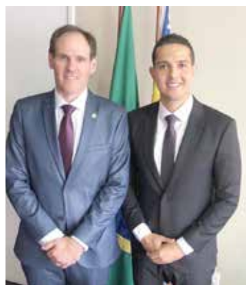
Zé Antônio com Lissauer Vieira, comemorando a vitória do rioverdense na disputa da Alego

Por seu turno, o prefeito Zé Antônio (PTB) foi à Goiânia no dia da eleição da Assembleia e tirou foto com o presidente da Casa, Lissauer Vieira (PSB), parabenizando-o pela vitória, que fortalece a cidade de Rio Verde, no Sudoeste. Nas redes sociais, o prefeito apareceu sorridente e destacou sua amizade com Lissauer.