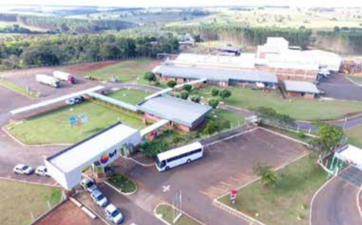
Unidade da BRF em Buriti Alegre foi ampliada para atender o mercado Halal

Além de Araporã, Buriti Alegre e Bom Jesus, também tiveram saldo positivo no CAGED Itumbiara, Cachoeira Dourada, Corumbaíba, Gouvelândia, Inaciolândia, Joviânia, Marzagão, Maurilândia e Panamá. Centralina e Goiatuba foram as únicas cidades da região onde houve fechamento de vagas de trabalho. A crise foi maior nas cidades turísticas, como Caldas Novas e Rio Quente, que demitiram cerca de 3 mil trabalhadores.