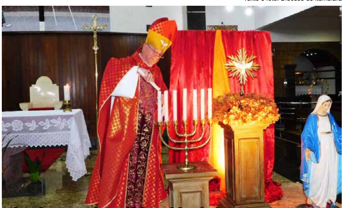
Bispo dom Fernando Brochini na celebração de Pentecostes