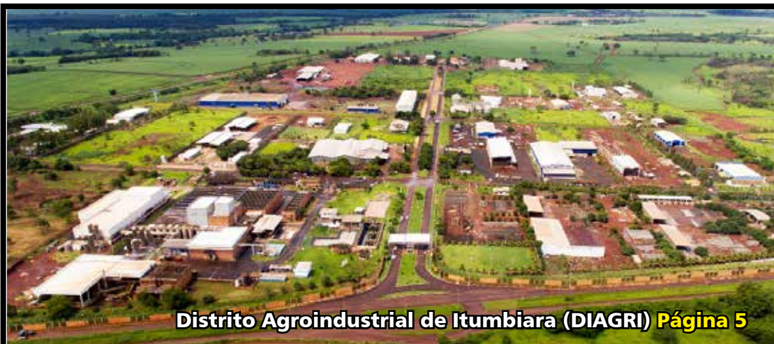
Distrito Agroindustrial de Itumbiara (DIAGRI) Página 5