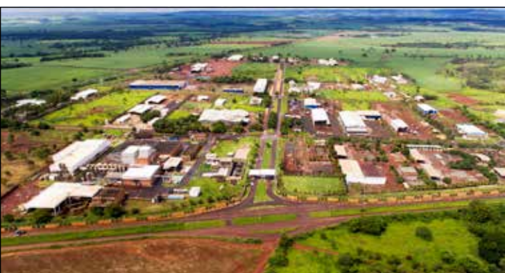
Distrito Agroindustrial de Itumbiara (DIAGRI)

FR Adubos e Fertilizantes Camargo Distribuidora de Produtos Químicos Cetric - Central de Tratamento de Resíduos Sólidos