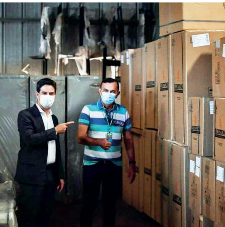
Secretário estadual de Saúde Ismael Alexandrino com equipamentos para UTI dos hospitais de Itumbiara e Porangatu

O processo de aquisição dos equipamentos para o Hospital São Marcos, de Itumbiara, está sendo acelerado pelo governo de Goiás. O secretário estadual de Saúde, Ismael Alexandrino, anunciou a compra dos equipamentos para as Unidades de Terapia Intensiva (UTI) dos hospitais de Itumbiara e Porangatu.