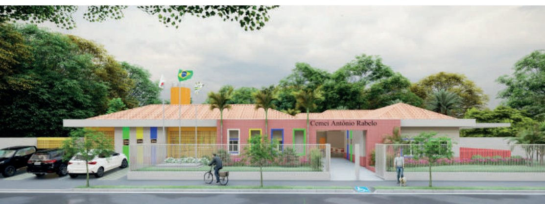
Projeção do CEMEI Antônio Rabelo: investimento superior a R$ 1 milhão

Mesmo diante da pandemia que paralisou a economia mundial e afetou investimentos do setor público em obras essenciais, o município de Araporã dá exemplo na gestão dos recursos públicos e na condução do enfrentamento à crise.