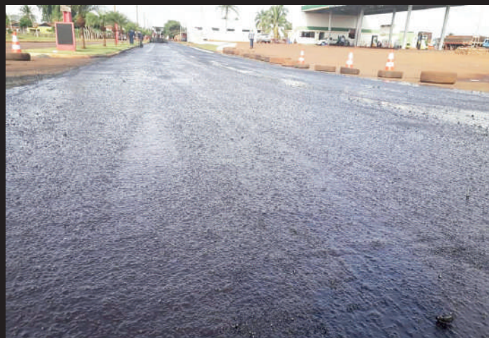
Asfalto da Avenida 13 foi refeito pela empresa

Após contar defeitos na revitalização do asfalto na Avenida 13, o prefeito Chiquinho notificou a empresa BGM Construções, que constatou o problema e realizou os reparos na via. O novo serviço não teve custo adicional para a Prefeitura. “Esse é o diferencial de nossa gestão que foca suas ações de forma responsável e transparente, trabalhando pela aplicação correta dos recursos”, declarou o prefeito Chiquinho.