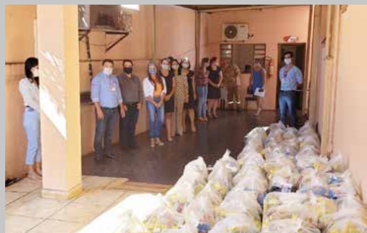
Entrega dos alimentos na FUNSOL