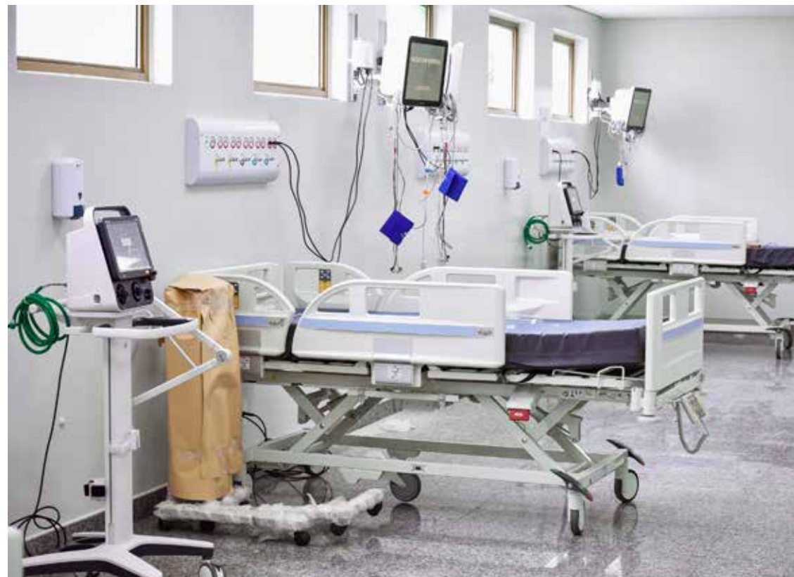
Hospital São Marcos de Itumbiara será aberto em maio, com gestão feita pelo INTS, que administra o Hospital de Urgências de Goiânia (HUGO)

Nesta primeira etapa serão disponibilizados 200 leitos, sendo 170 de enfermarias e 30 de Unidade de Terapia Intensiva (UTI), para os casos mais graves. Antes de iniciar as atividades, o que deve ocorrer dentro de duas a três semanas, será necessário uma pequena reforma, aparelhamento, formação da equipe, capacitação e treinamento.