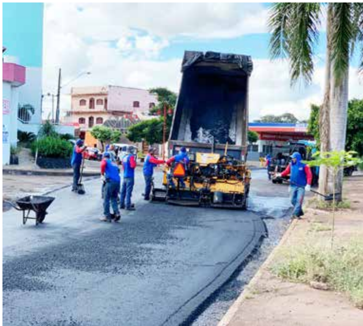
Recapeamento da Avenida Rogelina Maria

Prefeitura de Itumbiara está realizando o serviço de recapeamento da Avenida Rogelina Maria de Jesus, que margeia o Córrego Água Suja. No total, serão cerca de 13,5 mil metros quadrados de asfalto novo na avenida, que dá acesso a vários bairros da cidade. O asfalto novo vai trazer mais segurança aos pedestres e motoristas, facilitando o fluxo e tráfego de veículos no local. Mais um sonho da população realizado pela Prefeitura de Itumbiara, através da Secretaria de Obras.