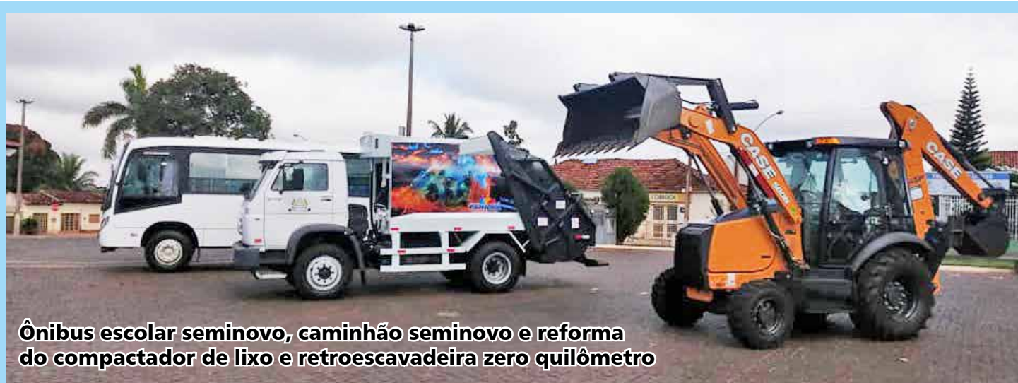
Ônibus escolar seminovo, caminhão seminovo e reforma do compactador de lixo e retroescavadeira zero quilômetro

O prefeito esclareceu ainda que os recursos do IPTU são importantes para a continuidade de obras importantes para a população, como investimentos em asfalto, construção de praça e manutenção dos serviços como saúde, educação e outros.