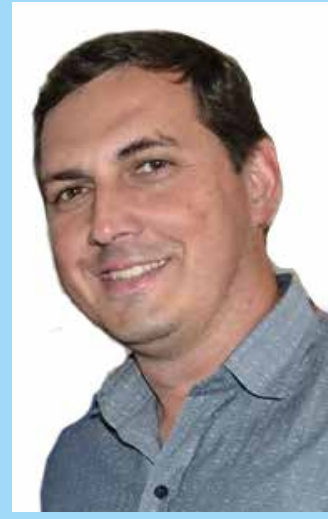
Prefeito Zé Willian e maquinário adquirido com recursos da Prefeitura e emenda parlamentar

permitir uma melhora significativa dos serviços, seja no transporte dos alunos, na coleta do lixo urbano e ainda na realização de obras e serviços na cidade.