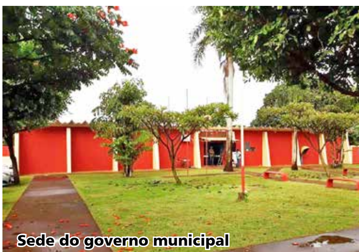
Sede do governo municipal