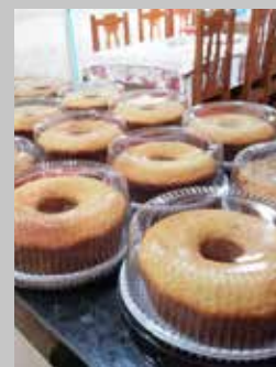
Cestas básicas distribuídas pela Prefeitura junto com bolos (ovos foram doados pela população de Buriti Alegre)