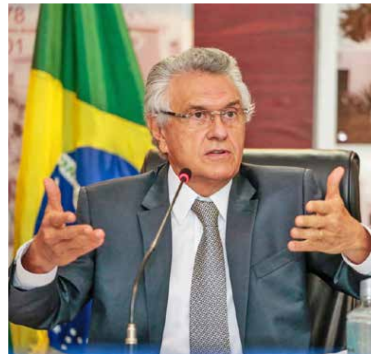
Governador Ronaldo Caiado fechou acordo com Legislativo, Judiciário, MP, TCE, TCM, Defensoria para cortar despesas e priorizar o funcionalismo

Outro argumento que o governador apresentou aos chefes dos demais Poderes e órgãos autônomos sobre a importância da redução de gastos diz respeito à saúde. Baseado na crescente demanda por atendimentos hospitalares