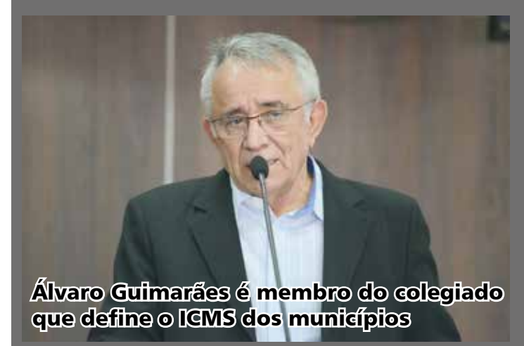
Álvaro Guimarães é membro do colegiado que define o ICMS dos municípios

O Conselho Deliberativo dos Índices de Participação dos Municípios COÍNDICE/ICMS divulgou no último dia 16, os novos membros para a composição do exercício do 2020. Pela Assembleia Legislativa, foram indicados os deputados Álvaro Guimarães (DEM), Antônio Gomide (PT) e Wilde Cambão (PSD). Em seu sétimo mandato na Assembléia, é a primeira vez que Álvaro conquista assento no colegiado do Coíndice, órgão responsável pela partilha do ICMS para os municípios goianos.