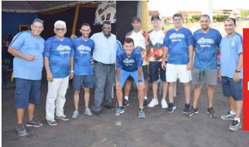
São os votos da Equipe do Departamento de Esportes de Araporã