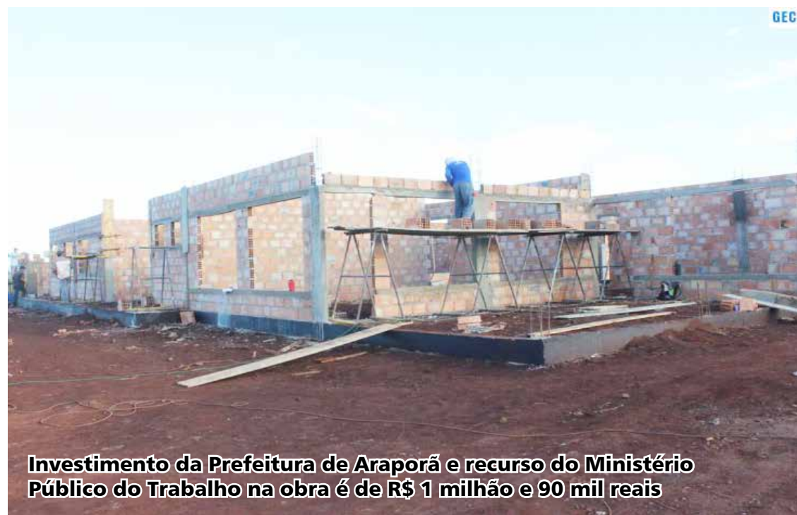
Investimento da Prefeitura de Araporã e recurso do Ministério Público do Trabalho na obra é de R$ 1 milhão e 90 mil reais

de mobilidade e acessibilidade. O CEMEI Antônio Rabelo atende alunos com idade de quatro meses a três anos e onze meses. Atualmente conta com mais de 150 alunos matriculados nos turnos matutino e vespertino e no período integral. A obra dará mais comodidade e conforto para os alunos e para os servidores.