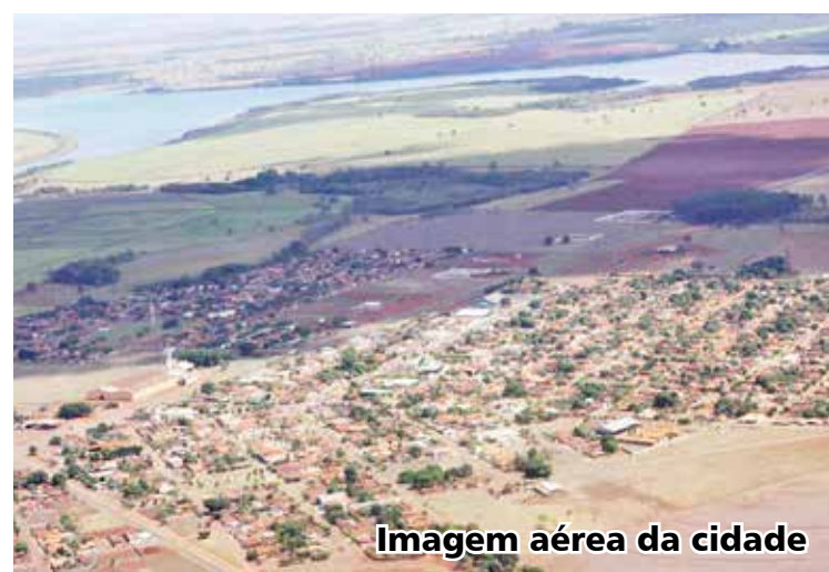
Imagem aérea da cidade