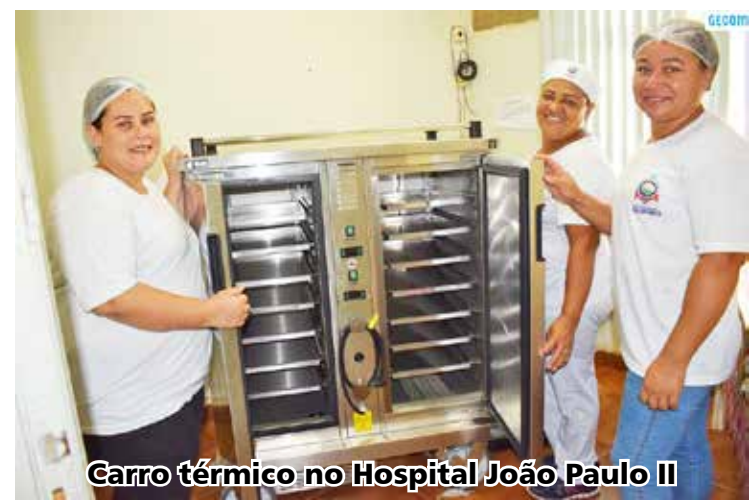
Carro térmico no Hospital João Paulo II

O equipamento é indicado para armazenamento e transporte de alimentos aquecidos em temperatura de trabalho controlada,