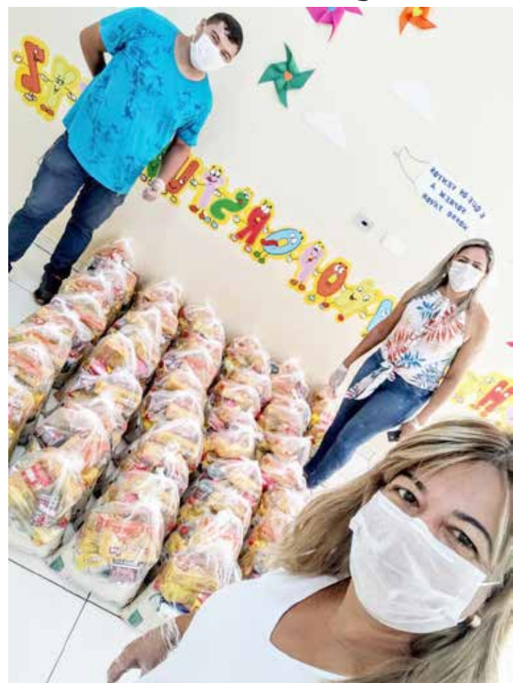
Entrega dos kits alimentação iniciou nas escolas

A entrega dos alimentos começa nesta quarta (01/04) e se estenderá até o próximo dia 08 de abril. O cronograma de entrega está sendo enviado aos pais dos alunos através dos gestores das escolas e CMEIs. A lista