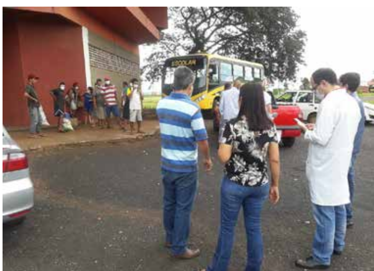
Atendimento aos moradores em situação de rua

Para quem manifestou o desejo de retornar para