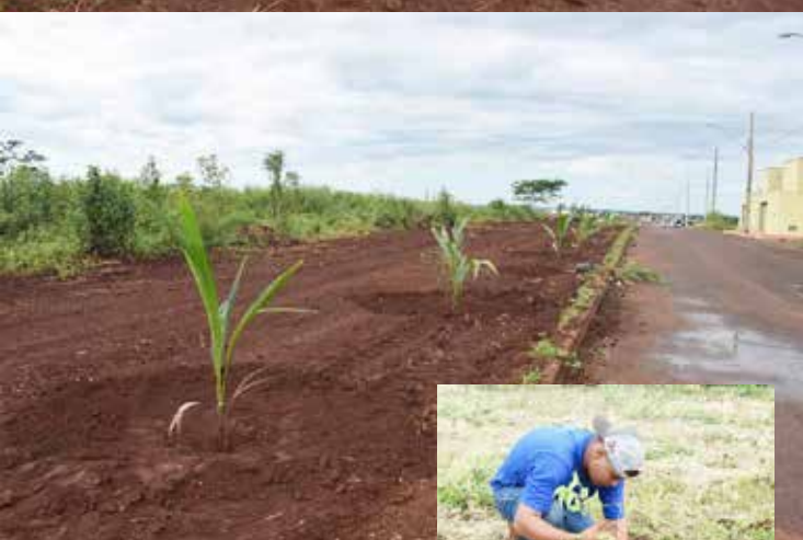
Plantio de árvores em diferentes bairros de Araporã