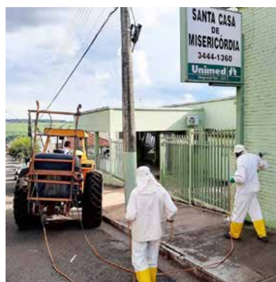
Sanitização na porta da Santa de Misericórdia e distribuição de cestas básicas para alunos da rede municipal em situação de vulnerabilidade alimentar

Prefeitura Municipal de Inaciolândia Secretaria Municipal de Saúde de Inaciolândia