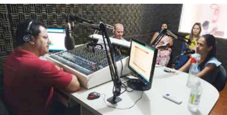
Chiquinho fala sobre as medidas adotadas pela Prefeitura para enfrentar a pandemia do coronavírus