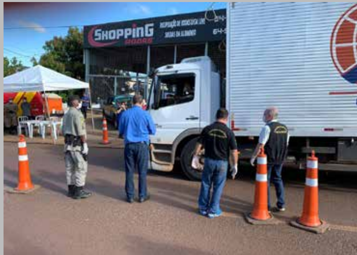
Equipes da Posturas, Vigilância, Polícia Militar e outros órgãos trabalham na barreira sanitária

Os condutores e ocupantes dos veículos passam por uma rápida entrevista com cadastro de dados pessoais, origem da viagem, destino preciso em Itumbiara e rápida triagem sobre o estado de saúde.