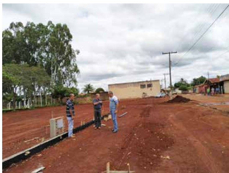
Construção da praça esportiva: mais uma obra do governo municipal para a população inaciolandense