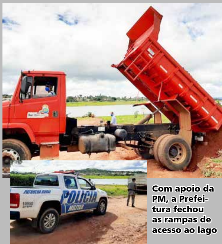
Com apoio da PM, a Prefeitura fechou as rampas de acesso ao lago

Para evitar aglomeração de pessoas que insistiam em permanecer o período de quarentena curtindo férias no Lago das Brisas, a Prefeitura de Buriti Alegre fechou os principais acessos ao lago, obstruindo as rampas da Balsa, do late e comunitária. Foram colocados avisos proibindo a presença das pessoas para evitar aglomerações. O prefeito André Chaves disse que a prioridade é salvar vidas e que a cidade continue sem nenhum caso confirmado do Covid 19, por isso a necessidade desta intervenção.