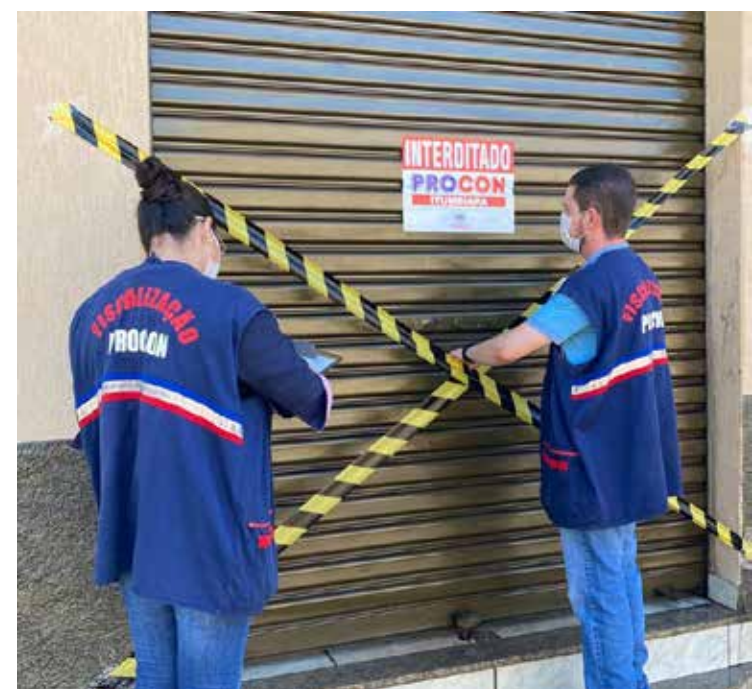
Procon interdita loja no Centro de Itumbiara por preço abusivo na venda de máscaras cirúrgicas e também produtos com validade vencida

Agradecemos à população de Itumbiara, que tem se mobilizado e buscado o PROCON como solução para o aumento abusivo desses preços e aproveitamos para informar que nossas equipes estão nas ruas fiscalizando o comércio e averiguando todas as denúncias que recebemos. Conte com o PROCON na garantia dos direitos dos consumidores. Fonte: DECOM