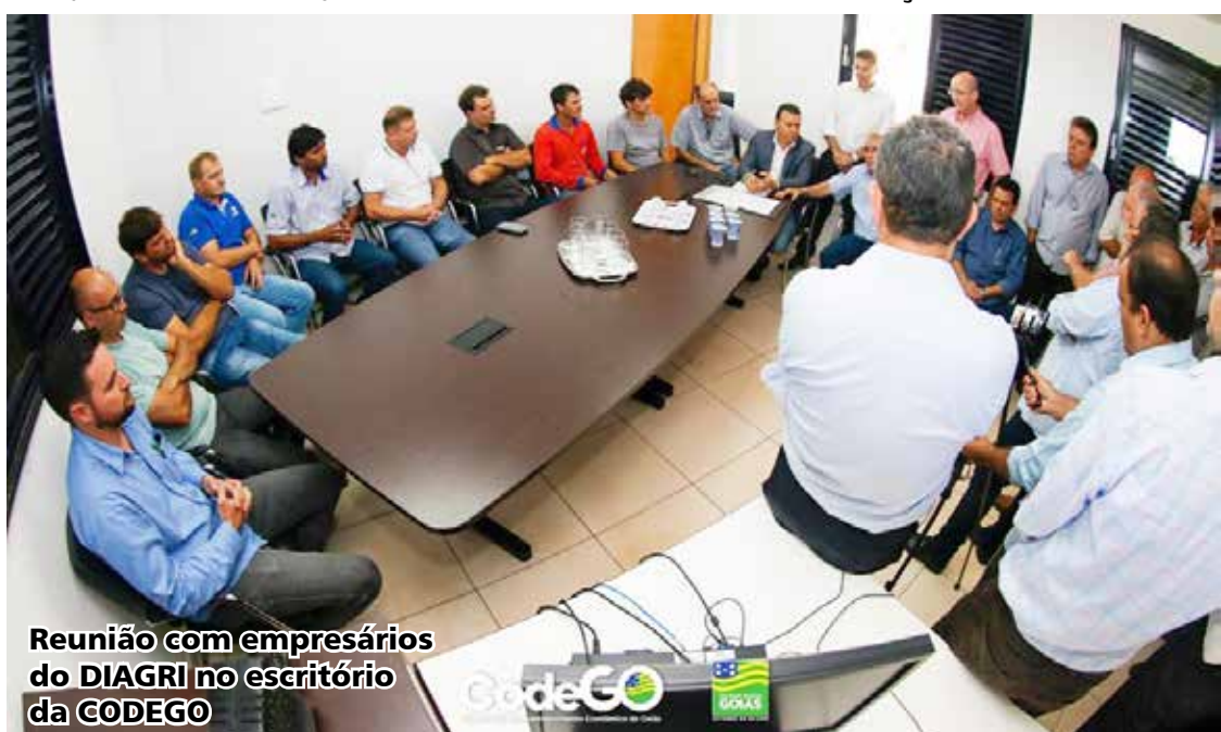
Reunião com empresários do DIAGRI no escritório da CODEGO