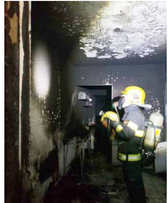
Residência ficou destruída após o incêndio no início deste mês. Suspeito vai responder pelos crimes