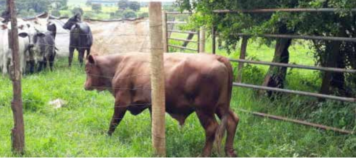
Touro foi encontrado numa fazenda em Joviânia

As investigações apontaram que o touro foi furtado em Panamá e levado para ser vendido no leilão. A autoria do crime, segundo a polícia, já foi devidamente esclarecida e o ladrão será responsabilizado criminalmente. A Polícia Civil apura também eventual crime de receptação qualificada da res furtiva.