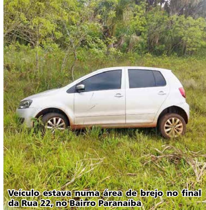
Veículo estava numa área de brejo no final da Rua 22, no Bairro Paranaíba