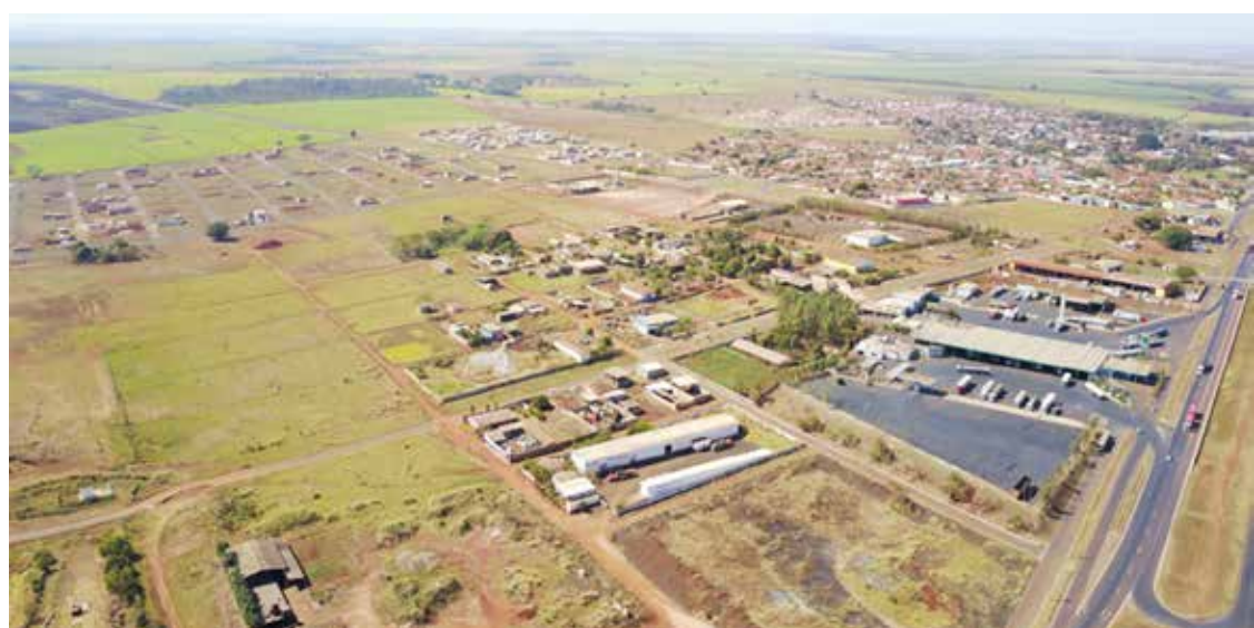
Bairro Liberdade, onde está instalado o Distrito Industrial de Araporã

Além de buscar esse recurso, a cidade também será beneficiada com a castração de 100 animais, R$ 300 mil para saúde, R$ 50 mil para a Ação Social e R$ 100 mil para realização do aniversário do município e a Festa de Peão.