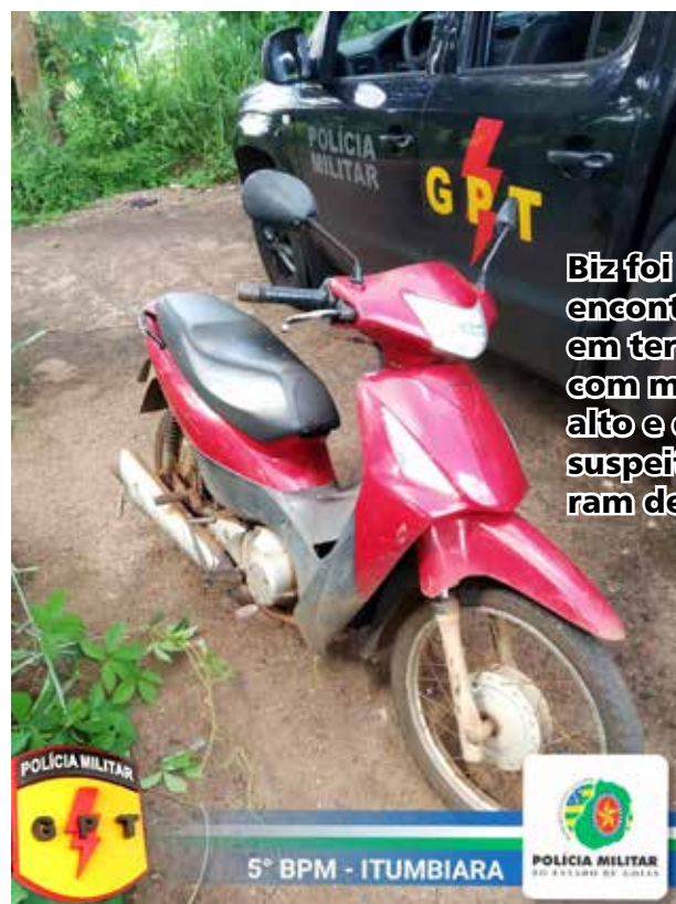
Biz foi encontrada em terreno com mato alto e os suspeitos foram detidos

O suspeito levou a equipe até o local onde a motocicleta estava escondida, num terreno com mato alto próximo à sua residência. Ele confirmou o nome do comparsa que o ajudou no furto e os policiais foram até a casa dele, onde foi detido. Em ato contínuo, a dupla foi encaminhada ao hospital para exame de corpo delicto e entregue à Polícia Judiciária. A Biz foi apreendida.