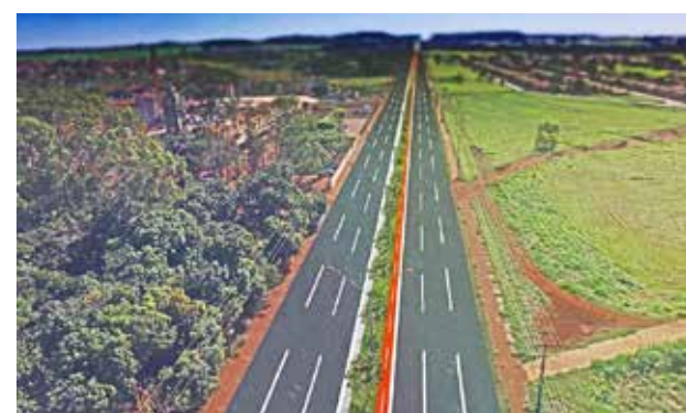
Modesto de Carvalho hoje e projeção após revitalização, com alargamento das pistas, ciclovia, pista de caminhada e iluminação