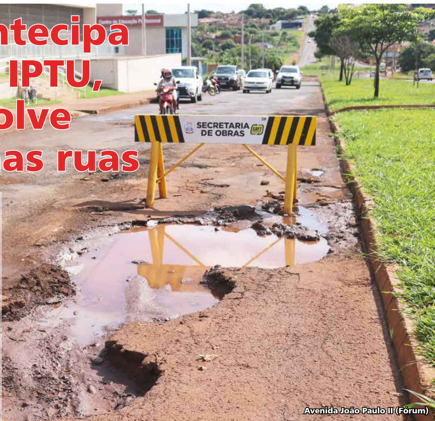
Avenida João Paulo II (Fórum)

Muitas ruas estão intransitáveis, como a Cachoeira Dourada (Brasília), Peru e Marrocos (Ladário Cardoso), Emanuel Xavier (Jardim Bandeirantes) e Vitalino Goulart (Santa Inês), esta última interditada pela própria Prefeitura. A população cobra uma resposta da Prefeitura para os problemas e espera que sejam resolvidos com a mesma rapidez da sanha arrecadatória.