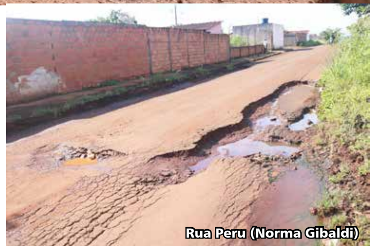
Rua Peru (Norma Gibaldi)