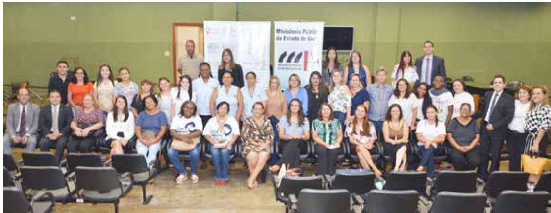
Parceiros na Rede de Proteção à Mulher em Itumbiara