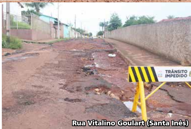
Rua Vitalino Goulart (Santa Inês)