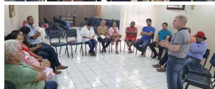
Reunião de planejamento do PT para 2020