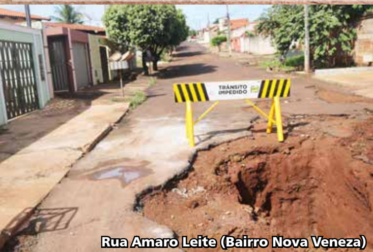
Rua Amaro Leite (Bairro Nova Veneza)