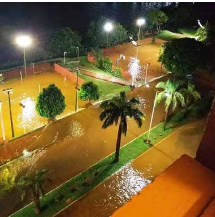
Alagamento da Avenida Beira Rio e das quadras poliesportivas