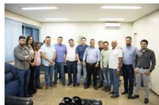
Grupo conhece a realidade da Avenida Modesto de Carvalho cheia de buracos e depois em visita à 6ª Delegacia Regional de Polícia