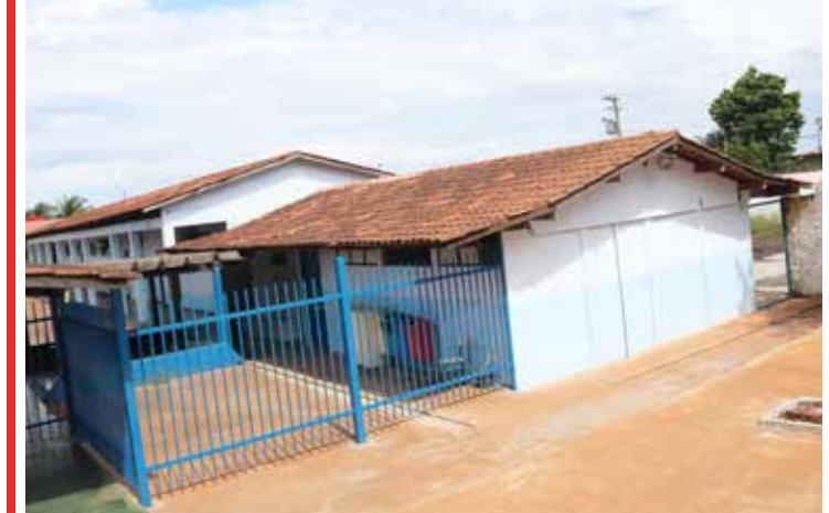
Escola Adelino Lopes: das 526 vagas, foram preenchidas apenas 187 em 2019 (35,5% da capacidade)