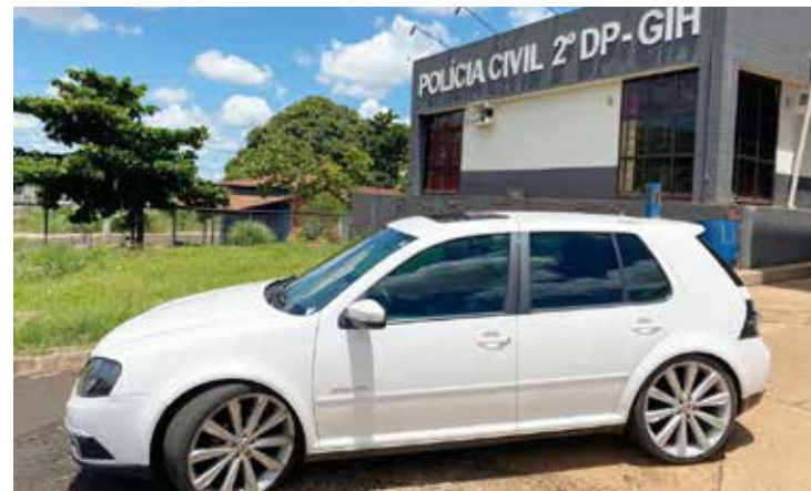
Veículo foi recuperado em Aparecida pela Polícia Civil

No instante da abordagem policial o investigado alegou que também seria uma vítima do golpe, contudo, o baixo preço pago pelo bem, a indiferença ante a constatação de que fora inserido restrição administrativa junto ao prontuário do carro, bem como a inér-