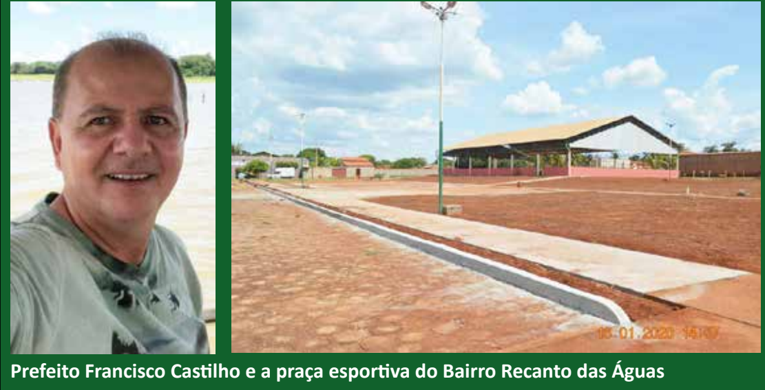
Prefeito Francisco Castilho e a praça esportiva do Bairro Recanto das Águas