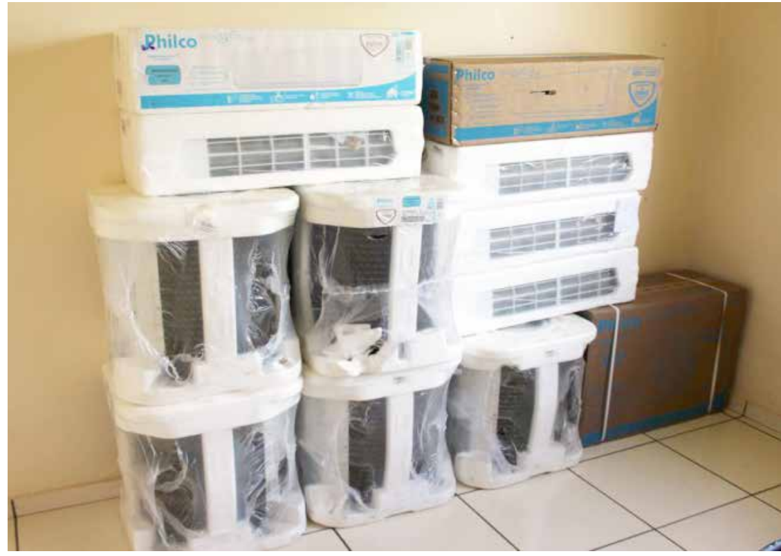
Aparelhos de ar-condicionado serão instalados na Escola Nascer do Sol em Araporã

Uma dessas conquistas é a aquisição de uma gaiola Therasuit. A outra é uma esteira. Ambos equipamentos são