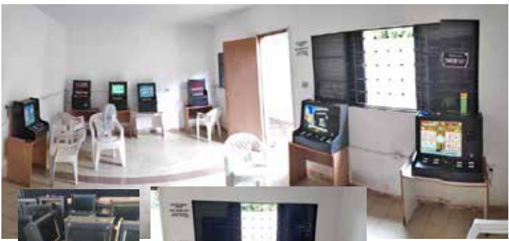
Máquinas apreendidas em Caldas Novas

A Delegacia de Polícia de Caldas Novas deflagrou operação visando combater a contravenção penal de jogo de azar. Após verificar existência de máquinas caça-níqueis sendo utilizadas para explorar financeiramente os turistas, verdadeiros jogos de azar, a Polícia Civil representou ao Poder Judiciário por mandados de busca e apreensão nos referidos endereços e, após mani-