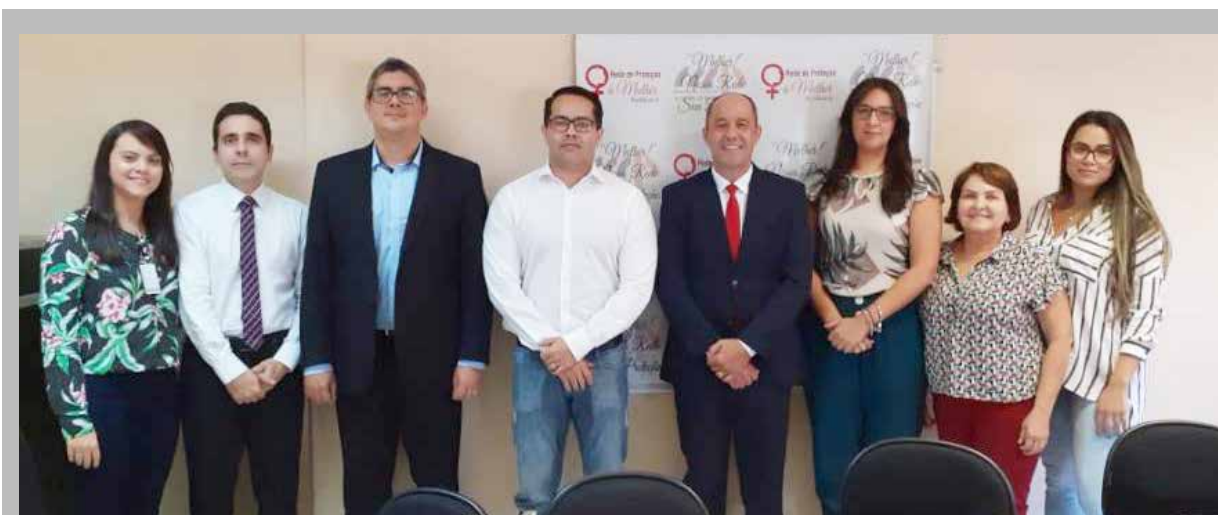
Representantes do Judiciário, Ministério Público, Delegacia da Mulher e Rede de Proteção à Mulher: parceiros na implantação do grupo reflexivo em Itumbiara

A empresa OLIVEIRA BOTTA MATERIAIS PARA CONSTRUÇÃO LTDA, inscrita no CNPJ: 29.494.750/0001-49, torna público que requereu da Agência Municipal do Meio Ambiente de Itumbiara - AMMAI, a Licença Ambiental de Instalação (LI) e a Licença Ambiental de Operação (LO), para atividades de Serviços de Comércio varejista de materiais de construção em geral. Situada na Av. Washington Luiz Nº 1413 QD 11 LT 18, Setor: Afonso Pena CEP: 75.513-405, na cidade de Itumbiara - GO.