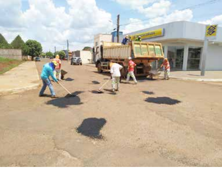
Operação Tapa-Buracos nas ruas de Inaciolândia