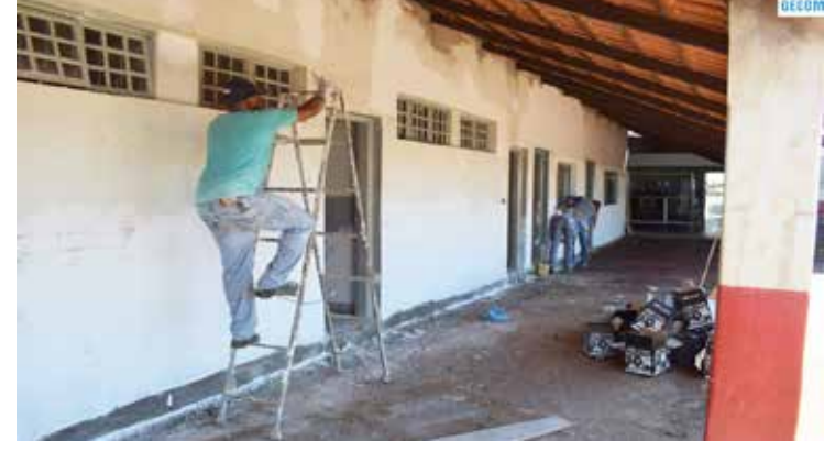
Andamento da reforma da Escola Prefeito Wilmar Alves

O prazo de conclusão da obra é para o final de fevereiro, onde a Secretaria de Educação confirmou a inauguração para o início de março. A Escola foi totalmente reformada para proporcionar aos alunos e profissionais, maior conforto e qualidade no ensino-aprendizagem. Está previsto também a reforma de outras instituições, além da construção de mais um CEMEI.