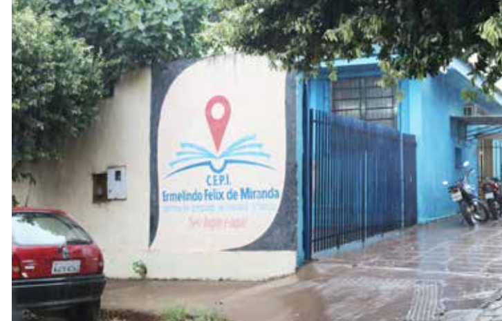
CEPI Ermelindo Félix de Miranda: das 320 vagas, foram preenchidas apenas 101 em 2019 (31,5% da capacidade)