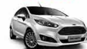
Fiesta SE 1.6 - 16/17 - Branco R$ 44.950,00