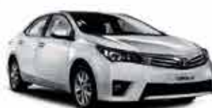
Corola XRS -17/18 - Branco R$ 92.950,00