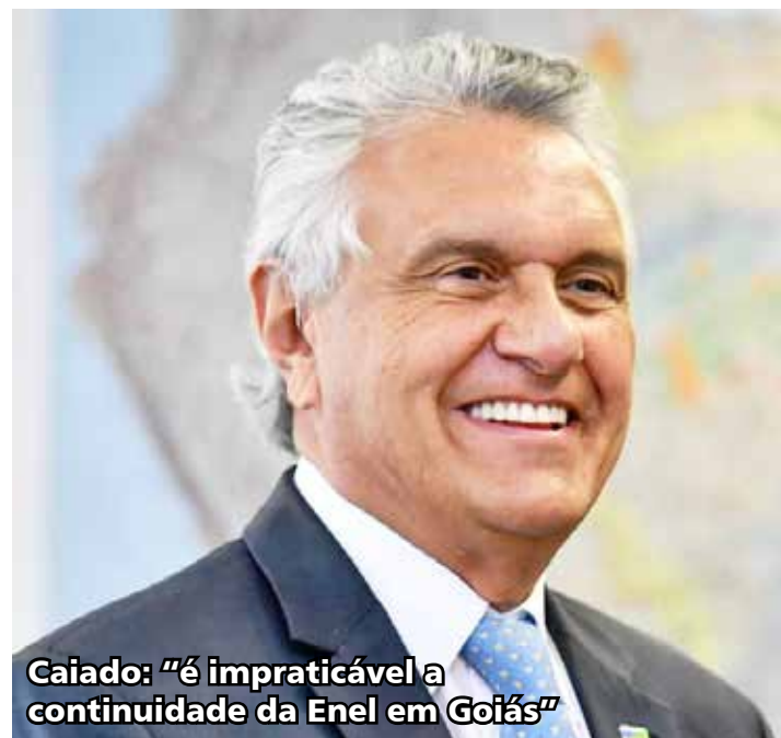
Caiado: “é impraticável a continuidade da Enel em Goiás”

Para o democrata, “torna-se impraticável a continuidade da Enel em Goiás”.