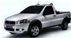
Strada Working - 1.4 - Cabine Simples 16/16 - Branco R$ 35.950,00