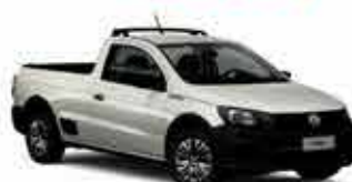
Nova Saveiro Robust Cabine simples - 17/18 R$ 39.950,00