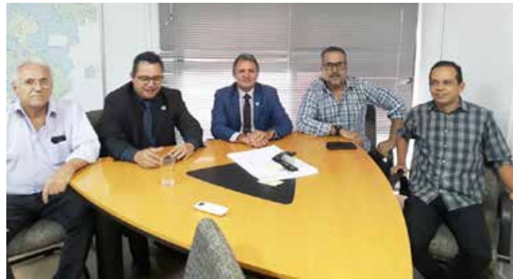
Reunião de trabalho na AGEHAB