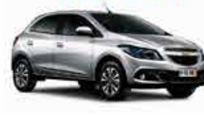
Onix LS - 15/15 - Prata R$ 34.900,00