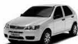
Pálio Fire Way - 17/17 - Branco R$ 29.900,00