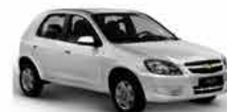
Celta LT 1.0 - 13/14 - Branco R$ 26.950,00