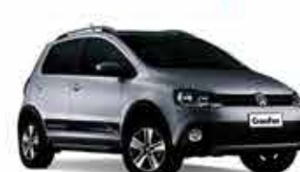
Cross Fox G2 - 11/11 - Prata R$ 31.950,00