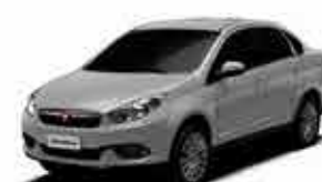
Grand Siena Essence 13/13 - Branco R$ 35.950,00