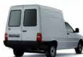
Florino Furgão - 13/13 - Branca R$ 25.950,00