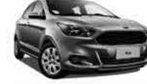
Ford K SE - 14/15 - Prata R$ 32.950,00

A VENEZA COMPRA SEU VEÍCULO SEMI NOVO DE TODAS AS MARCAS