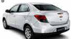
Prisma Lt 1.4 - 15/16 - Branco R$ 39.900,00