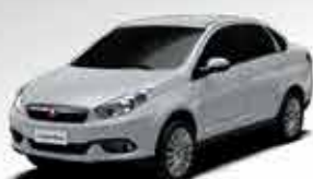
Grand Siena Atrative 1.4 13/14 - Branco R$ 33.950,00