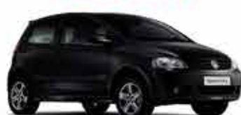
Fox G2 - 1.0 - 11/12 - Preto R$ 26.950,00