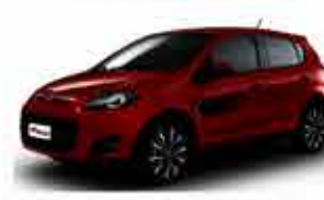
Pálio Sport 1.6 - 12/13 - Vermelho R$ 33.950,00