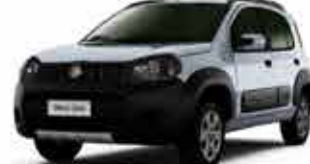
Novo Uno Way 1.0 14/15 - Prata R$ 28.900,00