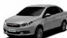
Grand Siena Atrative 1.4 14/15 - Branco R$ 35.950,00