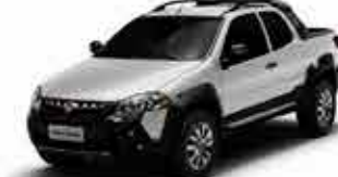
Strada Adventure 15/15 - Branco Cabine Dupla R$ 53.950,00