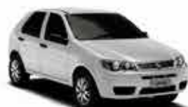
Pálio Fire Celebration 1.0 14/14 - Branco R$ 26.950,00