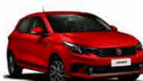
Argo Drive - 1.0 - 17/18 - Vermelho R$ 44.900,00