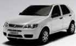
Pálio Fire - 15/16 - Branco R$ 27.950,00

O MAIOR SHOW ROOM DE SEMINOVOS DA REGIÃO