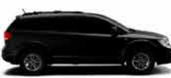
Frimont Precision - 7 lugares 12/12 - Preta R$ 42.950,00