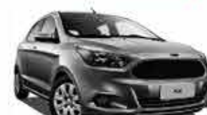
For K SE 1.0 - 16/17 - Prata R$ 39.950,00