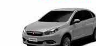
Grand Siena Atrative 1.0 - 18/18 - Branco R$ 39.900,00