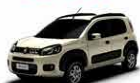
Novo Uno Way 1.4 - 14/15 - Prata R$ 32,950,00