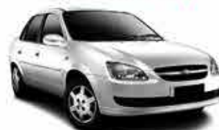
Corsa Classic LS - 13/14 - Branco R$ 25.950,00