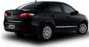
Grand Siena Essence 1.6 14/15 - Preto R$ 37.950,00