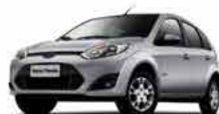
Fiesta Hat 1.6 - 11/12 - Branco R$ 22.900,00