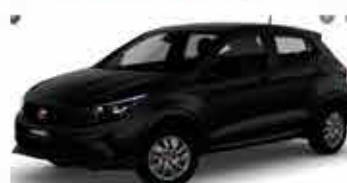
Argo Drive 1.0 - 17/18 - Preto R$ 41.950,00