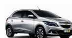
Onix LS - 15/15 - Prata R$ 34.950,00