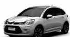
C3 Tendance -13/14 - Prata R$ 29.950,00