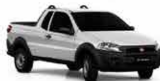
Strada Rard Working - 17/18 Cabine Estendida - Branco R$ 44.950,00