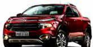
Toro Freedom Flex - Automática 16/17 - Vermelho Tribal R$ 75.950,00