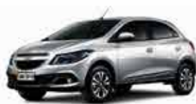
Onix LT 16/16 - Prata R$ 38.950,00