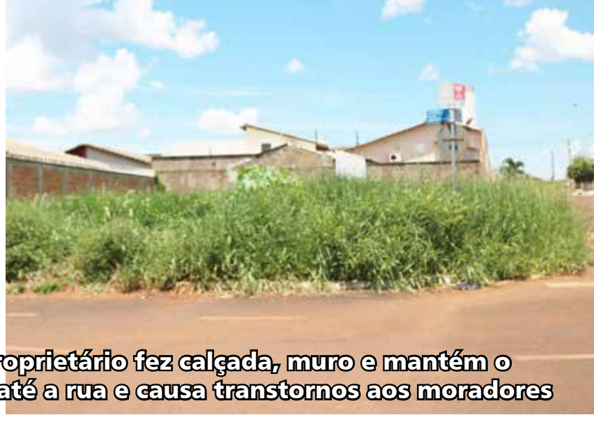
Dois exemplos de lotes vazios: no primeiro, proprietário fez calçada, muro e mantém o terreno limpo; no segundo, mato alto invade até a rua e causa transtornos aos moradores