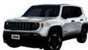
Jeep Renegade Longitude - 16/16 Flex - Automático - Branco R$ 75.950,00