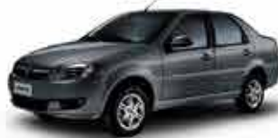
Siena EL 1.4 - 13/13 - Prata R$ 29.950,00