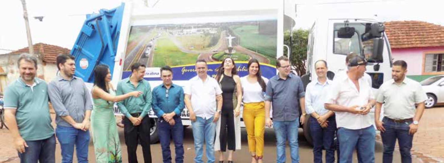
Entrega do novo caminhão compactador de lixo para a frota da Prefeitura de Centralina