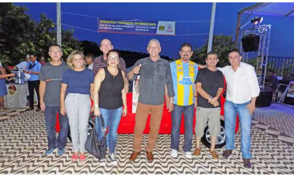
Diretores da CDL no sorteio realizado no Calçadão da Avenida Beira Rio