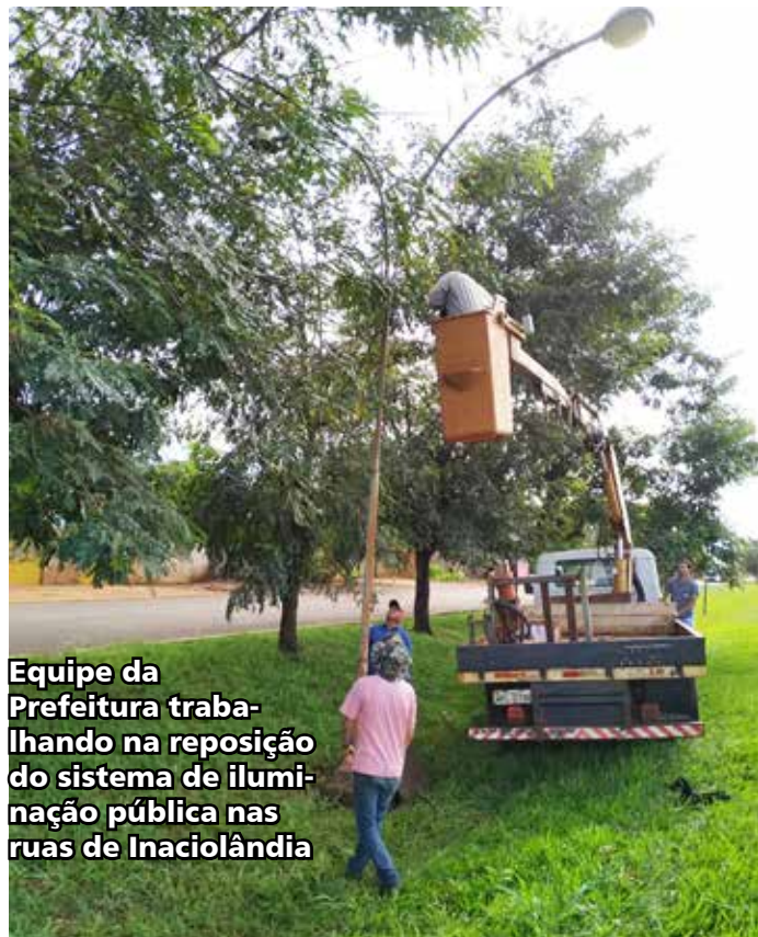
Equipe da Prefeitura trabalhando na reposição do sistema de iluminação pública nas ruas de Inaciolândia

A equipe da Prefeitura está efetuando a troca de lâmpadas e demais equipamentos necessários para garantir a iluminação das ruas no período noturno.