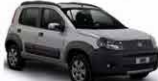
Novo Uno Way 1.0 - 11/12 - Cinsa R$ 25.950,00