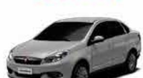
Grand Siena Essence 1.6 - 15/16 - Branco R$ 39.950,00