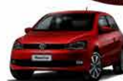
Gol G6 Confort Line 14/15 - Vermelho R$ 30.950,00