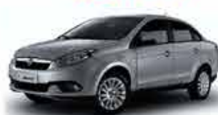
Grand Siena - Essence 1.6 15/15 - Cinsa R$ 42.900,00