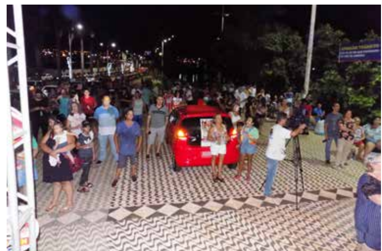
Sorteio realizado no Calçadão reuniu diretores da CDL, representantes do órgão de fiscalização e populares, que concorreram ao sorteio de brindes promocionais no evento