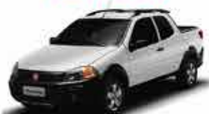
Strada Working 1.4 - 00/00 Cabine Dupla - Branco R$ 47.950,00