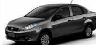
Grand Siena - Essence 1.6 15/15 - Cinsa R$ 40.950,00