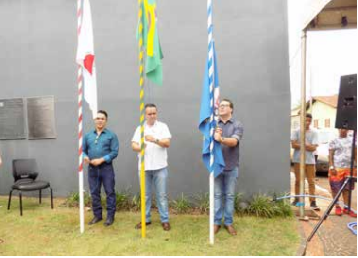
Hasteamento dos pavilhões estadual, federal e municipal na porta do Poder Legislativo e sessão festiva de posse