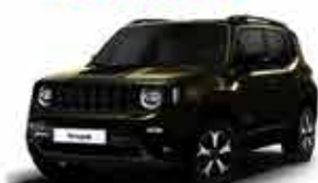
Jeep Renegade Sport - 16/16 Flex - Automático - Verde R$ 62.900,00