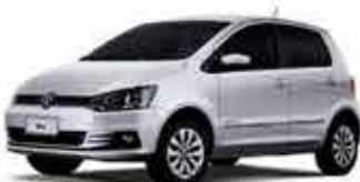
Fox TL - 4P 1.0 - 14/15 - Branco R$ 32.900,00