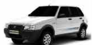
Uno Mille Fire 4P 1.0 - 12/13 - Branco R$ 23.950,00