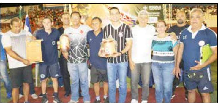
Paraguai agradece a hospitalidade dos itumbienses