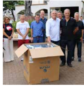
Fogão 6 Bocas Mônaco NELIO CARDOSO CUNHA