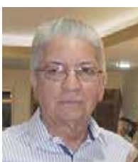
Autoria Professor Otávio Bernardes