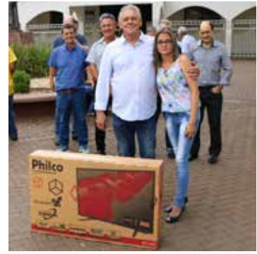
TV Philco Led HD 39" Smart SUELAINÉ SILVA SANTOS