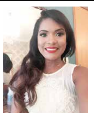
VERA Versatto Modas

"Parabéns aos participantes do Natal Premiada e em especial a nossa cliente que ganhou com cupom da Loja Versatto um vale compras. Muito feliz por ser um cliente da Versatto"