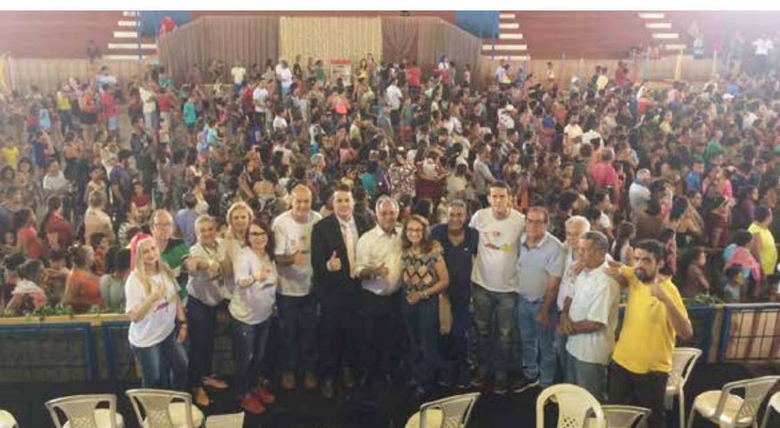
Representantes do governo, autoridades e voluntários na entrega dos brinquedos