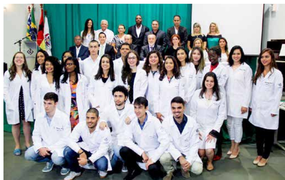
Alunos da primeira turma de Medicina da UEG Itumbiara

O câmpus Itumbiara oferece ainda os cursos de Farmácia, Enfermagem e Educação Física.