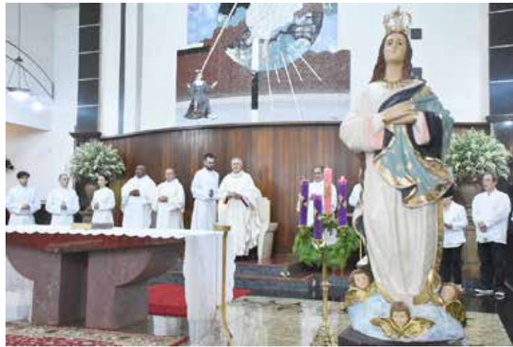
Celebração da Imaculada Conceição de Nossa Senhora, 53 anos da Diocese e bênções da Capela da Ressurreição