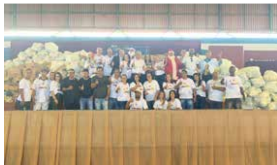
Distribuição dos brinquedos