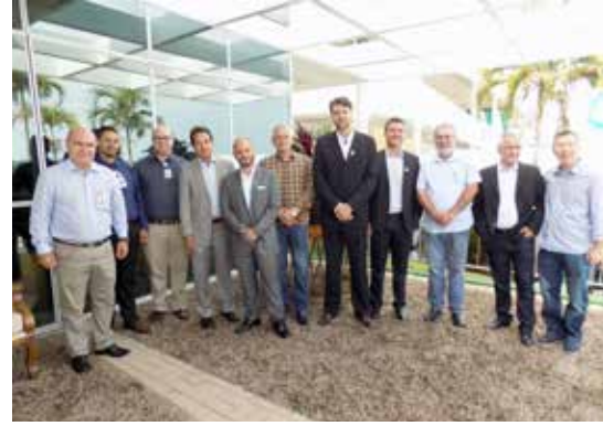
Diretores da Unimed com representantes da ACISI, CDL e o deputado estadual Álvaro Guimarães na inauguração da UTI