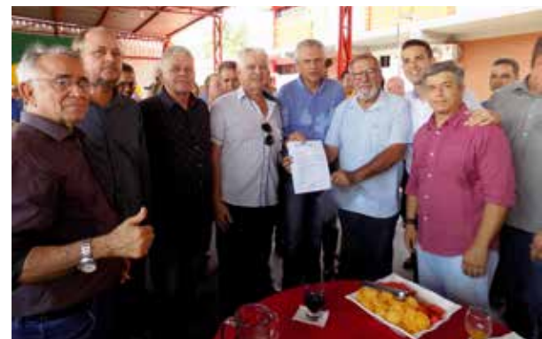
Representantes do Sindicato Rural, CDL e ACISI com o governador Ronaldo Caiado