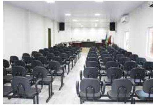
Fachada e instalações do novo Plenário, com novo mobiliário, sistema de som, ar-condicionado e auditório