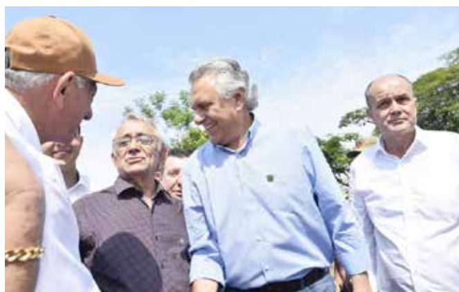
Deputado estadual Álvaro Guimarães, governador Ronaldo Caiado e o empresário Dione Araújo

A sustentabilidade foi um dos conceitos que norteou a reforma. O quartel agora conta com um sistema de energia solar fotovoltaica com 120 módulos solares, que garantirá a utilização de energia limpa e renovável e promoverá economia anual estimada de R$ 53 mil aos cofres públicos. Além da inauguração, foram entregues novos materiais operacionais para o Batalhão. O investimento foi de mais de R$ 56 mil em equipamentos como detector multigás, computador e cilindros de mergulho, cabo para rapel, máscara de proteção química, lanternas de led, vestimentas para atendimento de ocorrências com produtos perigosos, motosserras, esguicho regulável, entre outros materiais.