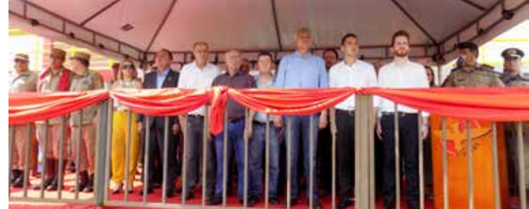
Autoridades presentes no evento do Corpo de Bombeiros