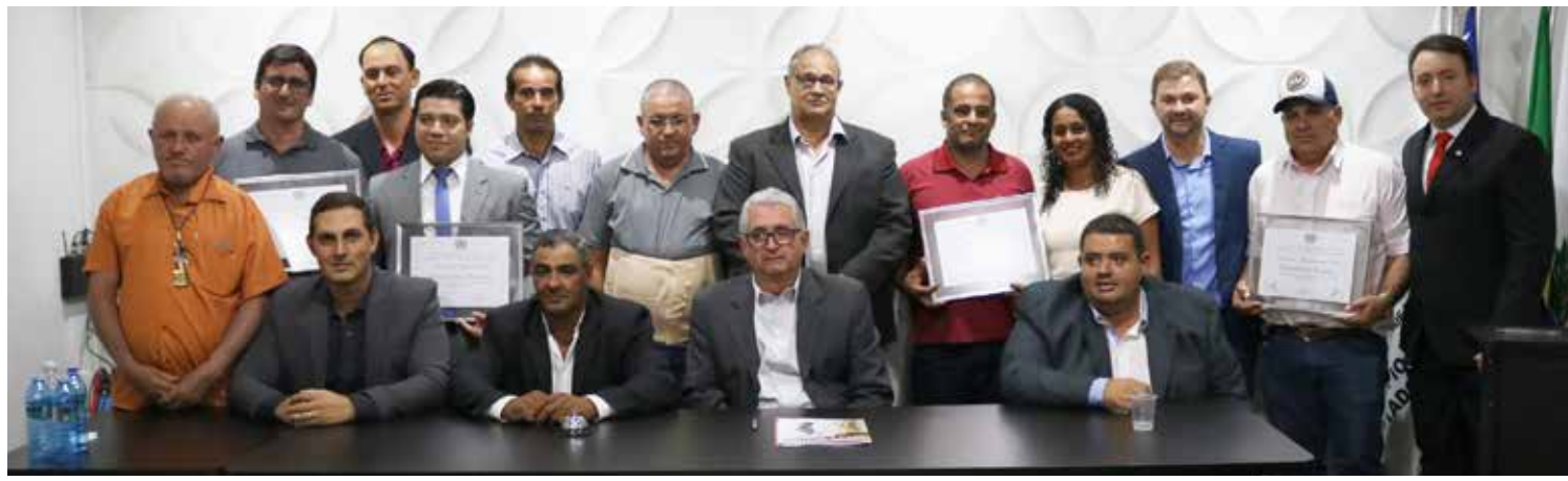
Vereadores com autoridades municipais e homenageados com título de cidadão panamaense