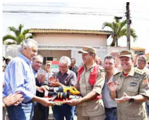
Governador entrega novos equipamentos ao Corpo de Bombeiros