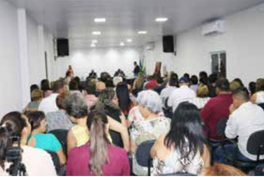
População prestigia a solenidade de inauguração do novo Plenário da Câmara