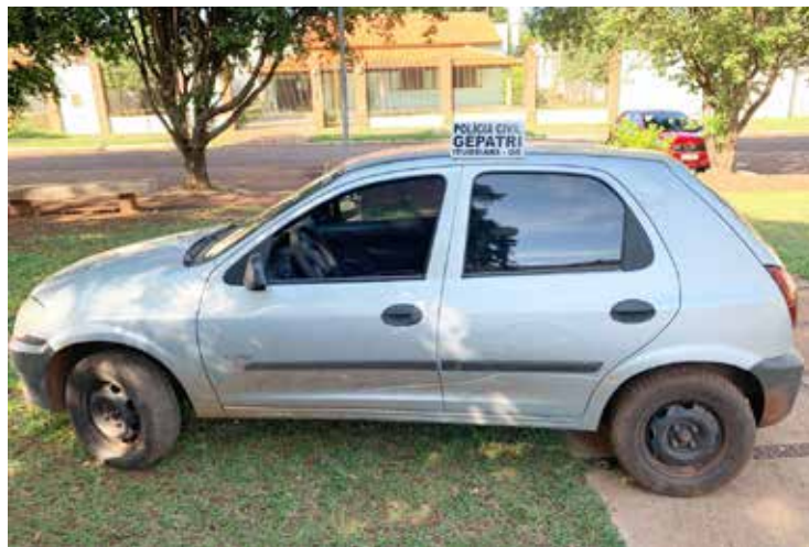
Veículo recuperado pela Polícia Civil

Ambos os assaltos foram praticados nos últimos cinco dias, sendo que os Policiais Civis prosseguem trabalhando para chegar a autoria dos delitos. Quem tiver informações sobre os autores pode fazer denúncia anônima pelo telefone 197 ou (64) 3431-7282.