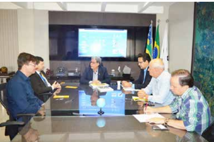
Reunião na sede do Crea para assinatura do convênio

Interessados em fazer uma pré-inscrição para análise devem entrar em contato pelo Whats App (64) 99328-3358. Serão atendidas até 20 famílias por semestre, desde que seja a única casa, que tenha até 70 m² de construção, sem laje, somente para famílias que comprovem renda bruta até 2 salários mínimos e já tenham no mínimo 50% do valor da obra para início da construção.