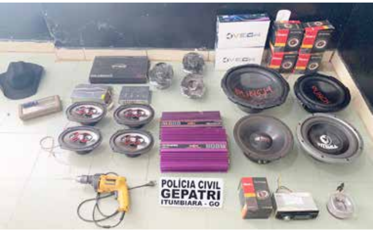
Aparelhos de som automotivo, ferramentas, televisão e videogame recuperados pelos agentes do Gepatri