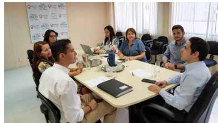
MP apresenta projeto de lei de políticas públicas e instalação da Casa da Mulher em Itumbiara

Participaram dos debates a titular da Delegacia Especializada no Atendimento à Mulher e de Apuração de Atos