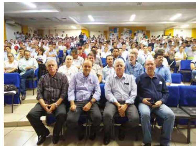
Representantes do segmento produtivo, dos trabalhadores e de vários segmentos da sociedade itumbiarense presentes na reunião no auditório da Ulbra