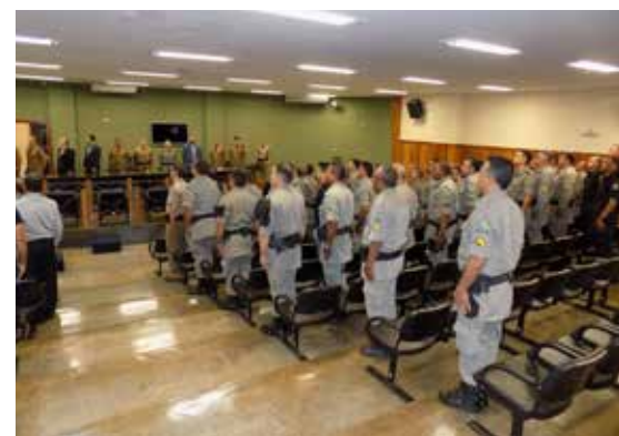
Policiais militares e representantes da sociedade na passagem de comando