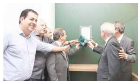
Inauguração oficial da agência Unicred na Rua Dr. Valdivino Vaz, 10, Centro