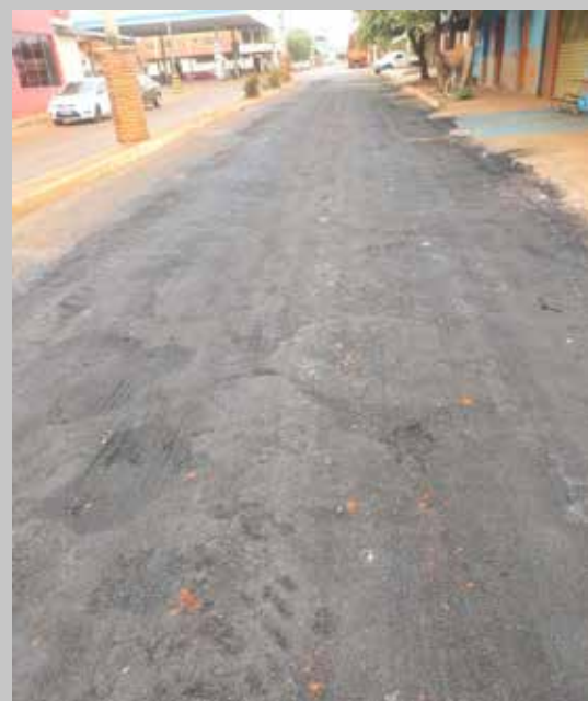
Trecho recapeado da Av. Osmar José Garcia: serviço de baixa qualidade e desperdício de material levou a Prefeitura a interditar a via

lhas e quando os veículos passavam "grudava" nos pneus, arrancando o piche.