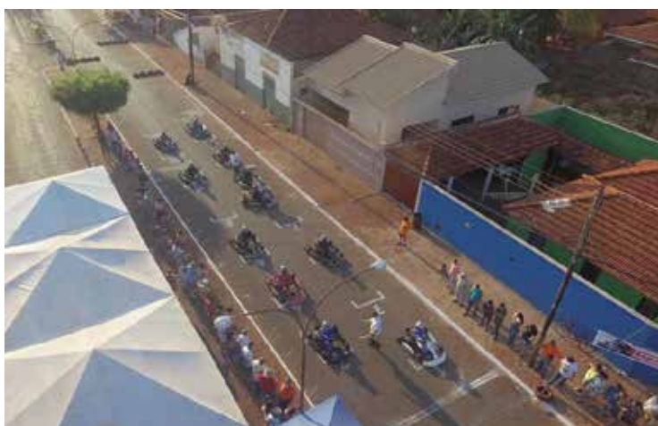
Provas do Kart de Rua em Inaciolândia e o prefeito Chiquinho na entrega dos troféus aos pilotos