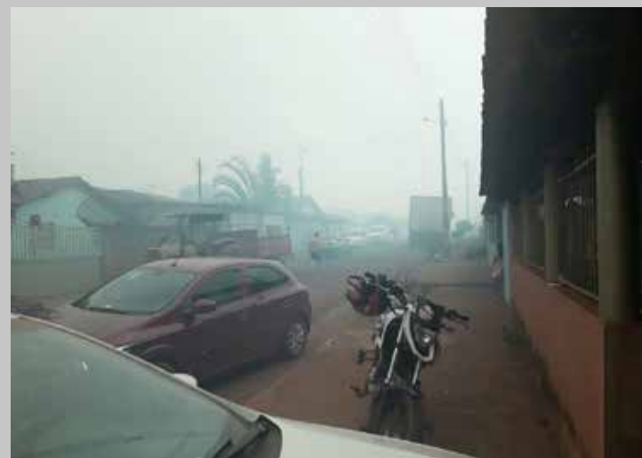
Fumaça cobriu o distrito e causou muitos transtornos

As causas do incêndio ainda não foram apuradas, mas há suspeita que tenha sido criminoso. Moradores cobram agora a reparação dos danos, identificação e punição dos responsáveis e que as usinas de cana não façam plantio em áreas muito próximas da zona urbana para evitar que o problema ocorra novamente.