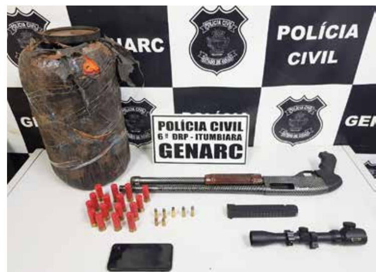
Armas e munições apreendidas pelo GENARC