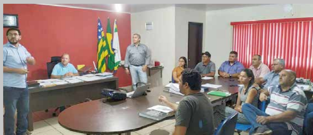
Equipe da Juceg durante apresentação da REDESIM na Prefeitura de Inaciolândia