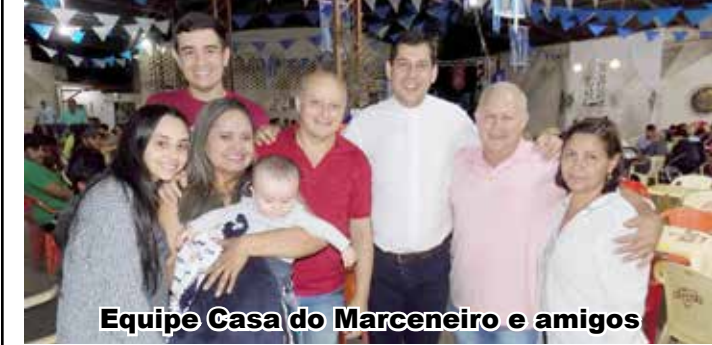
Equipe Casa do Marceneiro e amigos