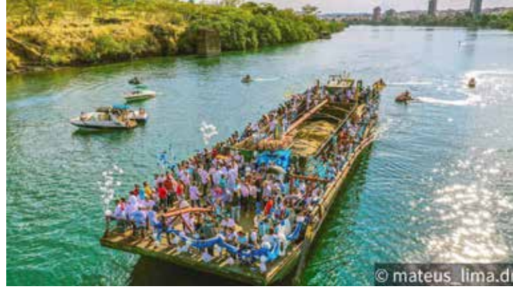
Trecho da procissão fluvial pelas águas do Rio Paranaíba. Tradição foi iniciada em 1960, com canoas de madeira