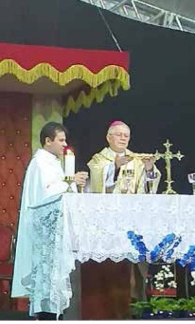
Bispo dom Fernando Brochini durante a celebração da missa campal na paróquia, ao final da procissão