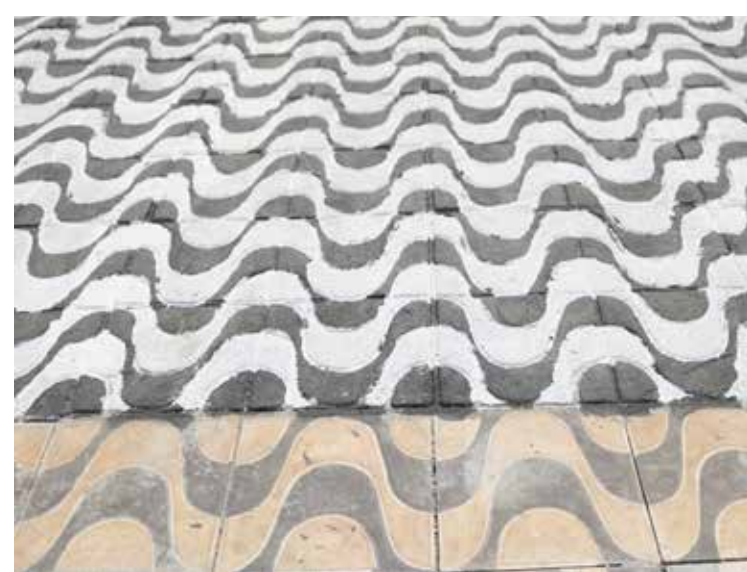
FORA DO PRUMO O novo piso (parte superior) não seguiu nem mesmo o desenho do piso original (parte inferior), desconfigurando o projeto original do Calçadão

O projeto original do ladrilho da Avenida Beira Rio, chamada de Copacabana de Goiás ao ser inaugurada há 20 anos, está sendo desconfigurado pela Prefeitura de Itumbiara e Saneago. Após reparos no sistema de esgoto na margem do rio, foram colocados novos ladrilhos no Calçadão, mas não seguiram o modelo anterior. Como a Prefeitura não encontrou os ladrilhos originais no mercado, foram fabricados e pintados, mas a qualidade do serviço deixou a desejar, desarmonizando o Calçadão, que perde parte de sua beleza original.