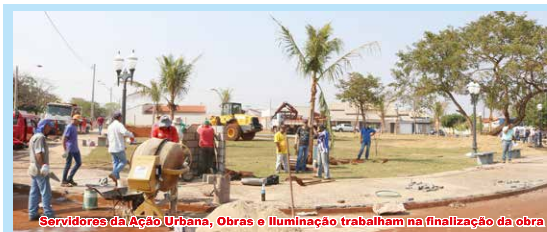
Servidores da Ação Urbana, Obras e Iluminação trabalham na finalização da obra