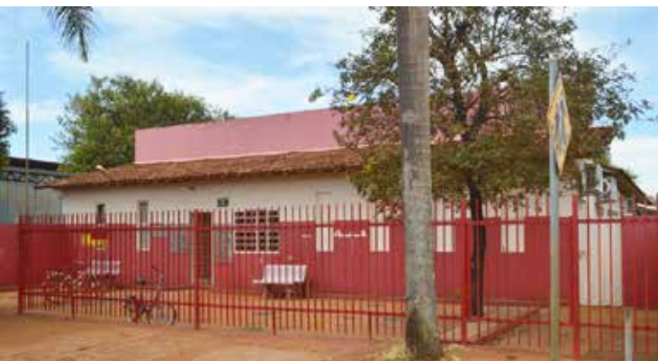
Unidades escolares de Inaciolândia

Com objetivo de oferecer melhor comodidade, segurança e conforto aos alunos, professores e pessoal administrativo da rede municipal de ensino, a Prefeitura de Inaciolândia, através da Secretaria Municipal da Educação e Cultura (SMEC), realizou obras de reforma e ampliações na Escola Municipal Agmar Fernandes Balleiro, no Centro Municipal de Educação Infantil (CMEI) Cândida Leopoldina de Andrade e no Anexo Escolar.