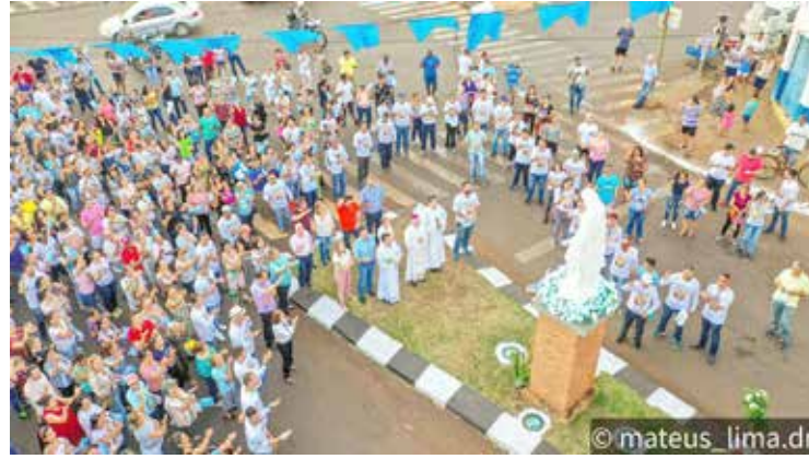
Católicos acompanham a procissão no percurso a pé pelas ruas de Itumbiara, com a imagem da santa à frente