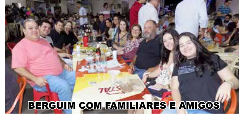
BERGUIM COM FAMILIARES E AMIGOS