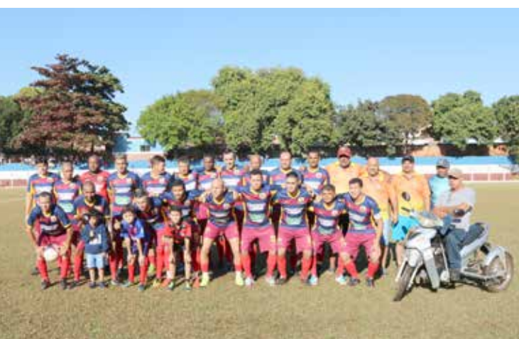
Time do Barcelona Master