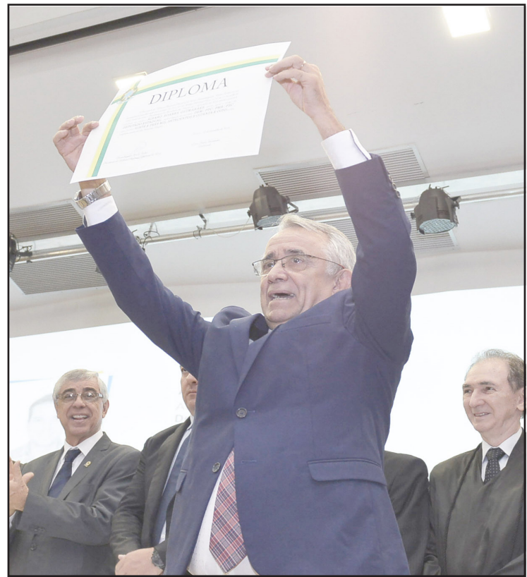
Deputado comemora com entusiasmo mais um diploma em mandato outorgado pelo povo goiano