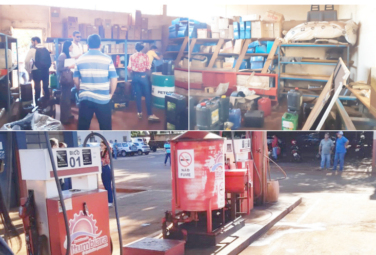
Equipe técnica do Tribunal de Contas dos Municípios e Ministério Público na inspeção do Centro de Serviços

re contratado pelo município para fins de controle e gerenciamento do combustível, uma vez que a gestão municipal não faz o confronto entre os dados da quilometragem do veículo e a litragem do combustível de maneira automática. Constatou-se ainda ausência de cadastro de alguns motoristas no sistema de informática contratado e, por fim, insuficiência de informações no relatório expedido pelo software, o que prejudica o controle externo pelos órgãos de fiscalização. As informações obtidas na vistoria instruirão inquérito civil público do Ministério Público contra o município.