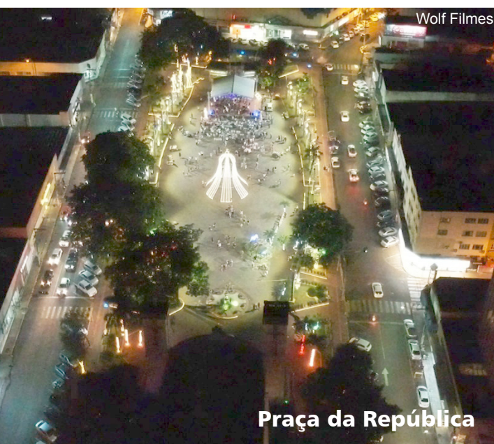
Praça da República