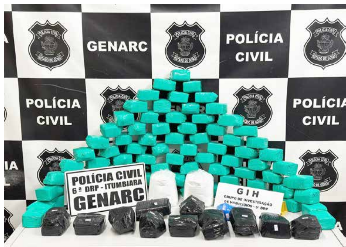
Drogas apreendidas pela Polícia Civil na BR-153, na região de Itumbiara