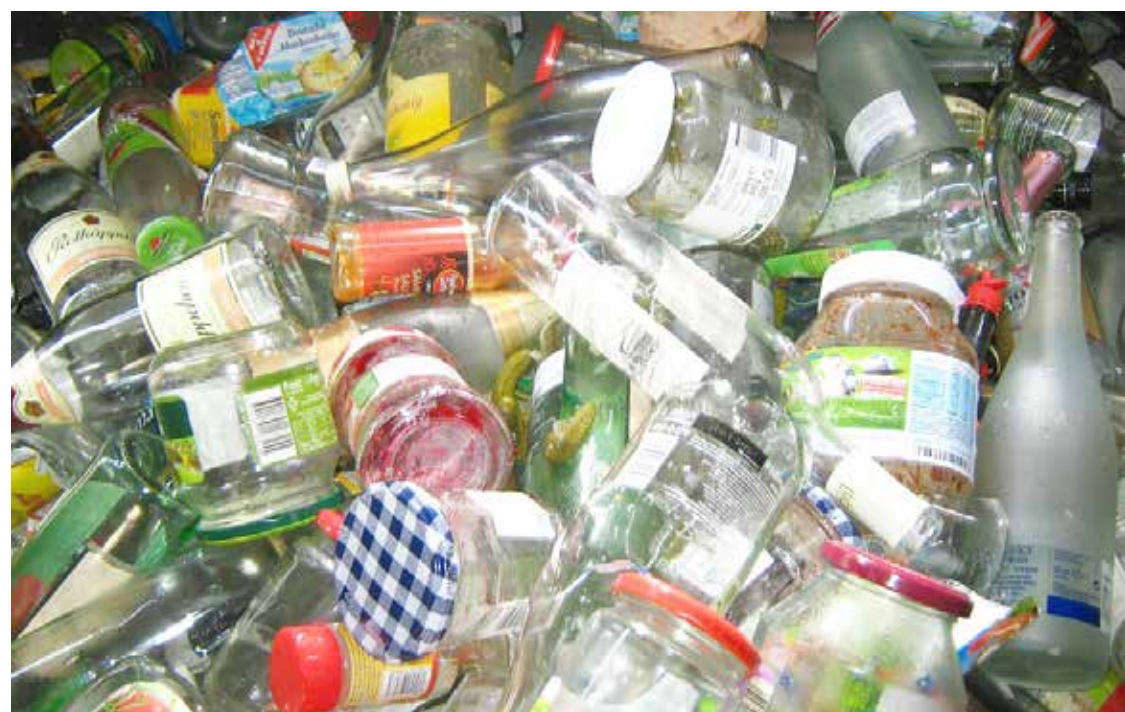
Recicla Goiás regulamenta a política de logística reversa no Estado