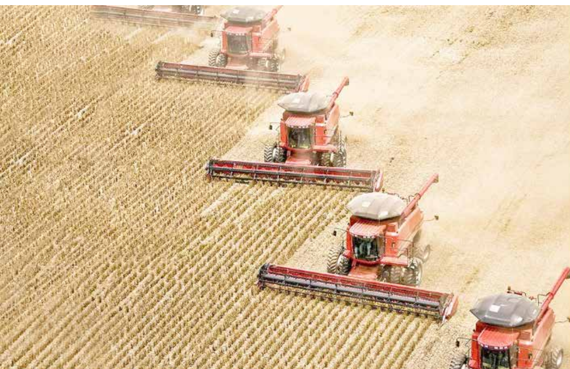
Governo de Goiás já arrecadou cerca de R$ 400 milhões com a taxa do agronegócio

O Fundeinfra será repassado para a Secretaria da Infraestrutura e aplicado na conservação de rodovias estaduais e obras que interessam ao agronegócio para escoamento da produção. Os efeitos anteriores à publicação da decisão estão resguardados e os produtores devem optar pela contribuição facultativa ao Fundeinfra para ter acesso aos benefícios fiscais