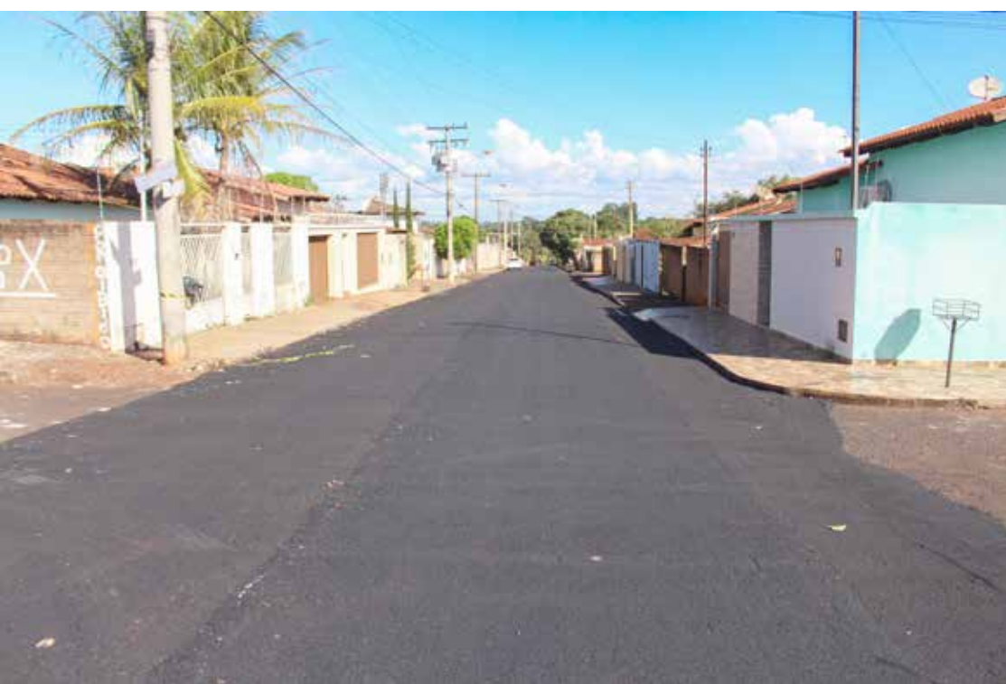
Recapeamento das ruas do Bairro Paranaíba