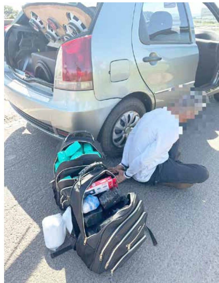
Suspeito transportava as drogas dentro de um veículo

Segundo a Polícia Civil, as drogas seriam comercializadas e distribuídas na Região Sul. Para denunciar crimes à Polícia Civil, a população pode utilizar os telefones 197 e (64) 9 9220-0235.