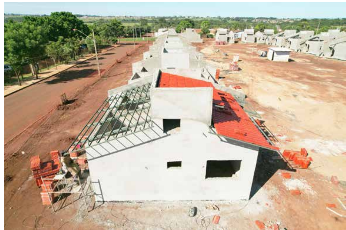
Conjunto de 170 casas está sendo erguido na região do Morada dos Sonhos

As casas serão destinadas para famílias com renda de até um salário mínimo que estejam inscritos no CADÚNICO. O período de inscrições será informado nos próximos meses pela Prefeitura e AGEHAB nos canais oficiais da Prefeitura.