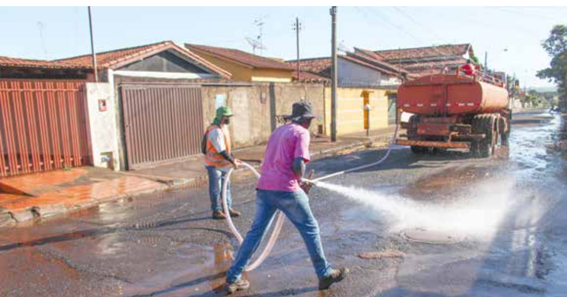
Trabalho de limpeza das ruas antes de receber o micro revestimento asfáltico

A Prefeitura de Itumbiara retomou os serviços de recapeamento das ruas com micro revestimento. A Secretaria de Obras está executando o serviço nas ruas do Bairro Paranaíba.