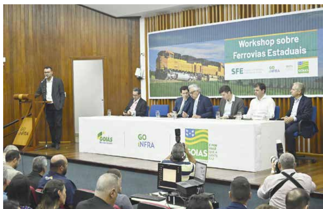
Governo e representantes da iniciativa privada no Workshop sobre Ferrovias Estaduais

A movimentação por meio de ferrovias promoverá um transporte eficiente, econômico e seguro, o que resulta em benefícios relacionados ao escoamento da produção agropecuária e industrial. A expectativa é de que com a redução dos