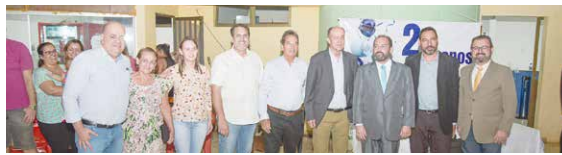
Prefeito Dione Araújo com reitor da UEG Antônio Cruvinel na entrega do Laboratório

Outro grande projeto da instituição é a construção do Centro de Saúde, um prédio que será destinado a prática de ensino e numa segunda etapa, ao atendimento à população. Investimento de mais de R$ 8 milhões da UEG e governo estadual, com obras em fase de licitação.