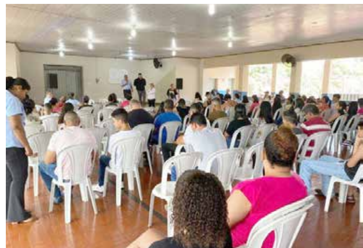
Reunião para apresentação das diretrizes do programa

Vale frisar que a iniciativa é uma parceria entre prefeitura, Câmara Municipal e Polícia Militar. Cada participante do programa recebe um auxílio no valor de R$ 600,00.