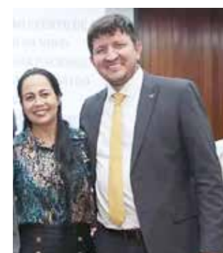
Deputado federal Glaustin da Fokus