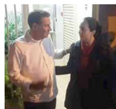
Senador Vanderlan Cardoso