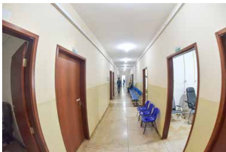
Reforma geral das instalações da UPA e farmácia, com todos os medicamentos essenciais na urgência e emergência

Ainda neste ano de 2023, a Prefeitura vai investir na reforma e ampliação do NABS, requalificação do CAIS para funcionar como Policlínica, construção do Hospital da Criança e reforma geral do Hospital Municipal Modesto de Carvalho (HMMC). O prefeito Dione Araújo tem afirmado que 2023 será o ano da saúde, elecionando também investimentos na aquisição de equipamentos e mobiliários para as unidades de saúde.