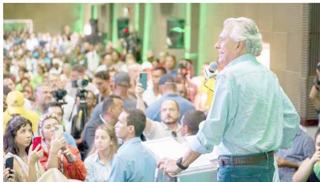
Governador Ronaldo Caiado durante discurso na Tecnoshow, em Rio Verde

Por fim, Caiado chamou atenção para o fato de que Goiás não pode ficar atrás de outros estados, e citou o Mato Grosso como ‘concorrente’ direto em capacidade de investimento e infraestrutura do setor do agronegócio. “Com todo respeito que tenho ao amigo, irmão, governador Mauro Mendes, mas o Mato Grosso está indo com muita velocidade, e Goiás não pode ficar atrás. Me deem dois anos e vocês vão ver as nossas rodovias e como o dinheiro [do Fundeinfra] foi aplicado”, ponderou.