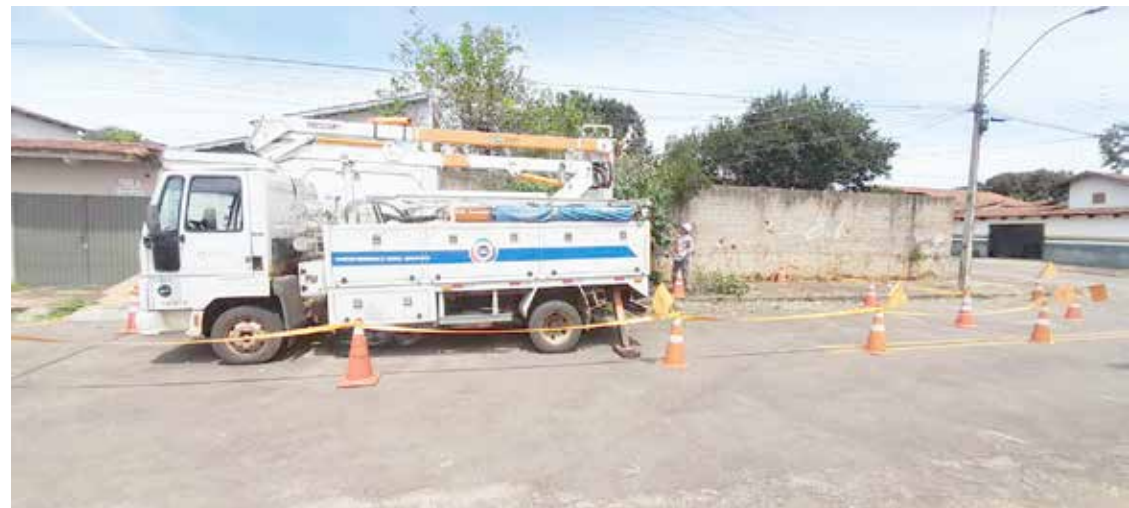
Trabalho de manutenção nas redes executado pelas equipes da Equatorial Goiás

A Equatorial Goiás é uma empresa que pertence à holding Equatorial Energia, 3º maior grupo de distribuição de energia do País, com 7