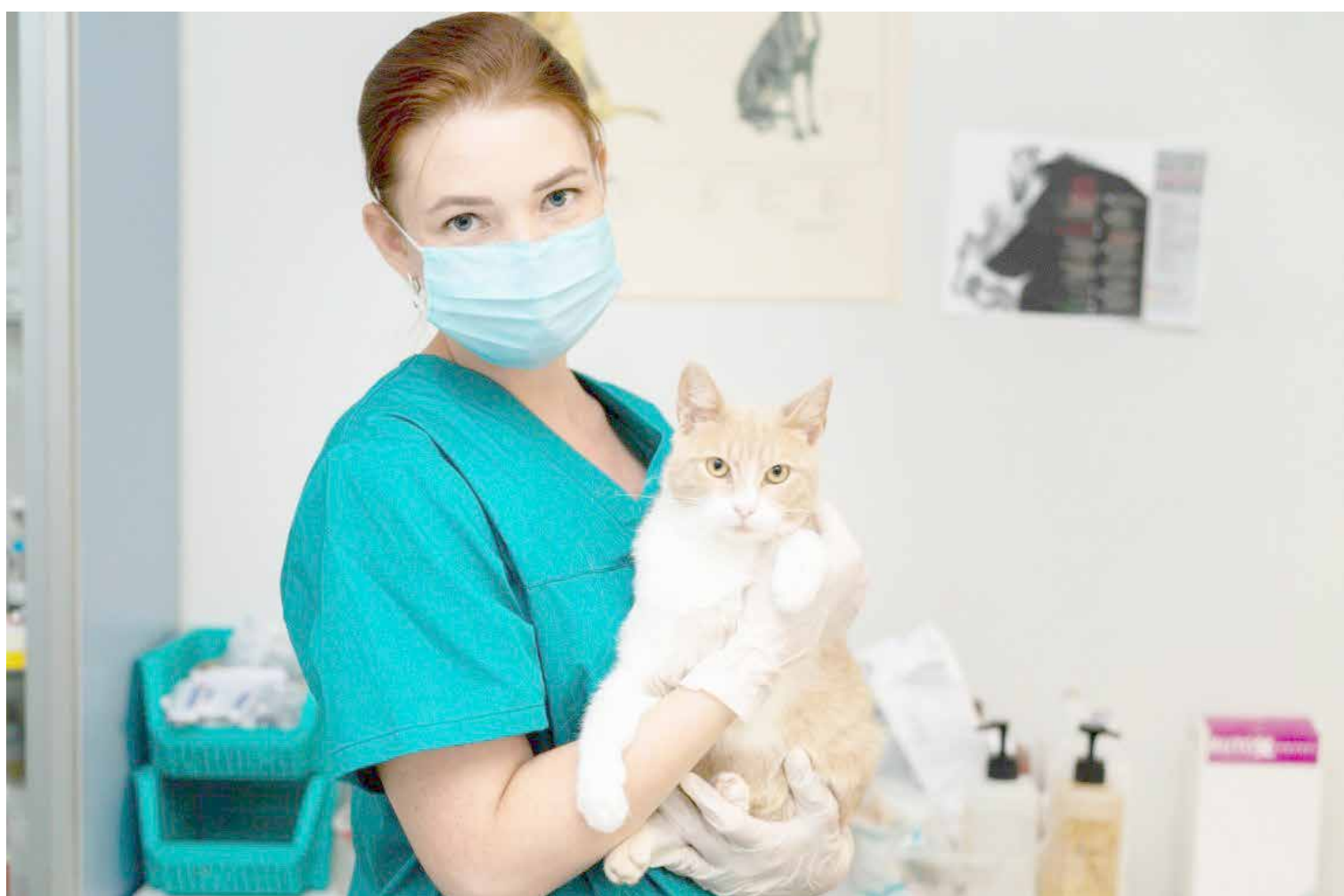
O mercado de medicina veterinária está aquecido e gera boas expectativas para quem deseja se tornar um profissional em alta e com amplo campo de trabalho

A licença para funcionamento é resultado de uma avaliação, realizada pelo MEC, que considerou três critérios: a organização didático-pedagógica, o corpo docente e técnico-administrativo e as instalações físicas oferecidas pela instituição para a oferta do curso. Com a autorização, este será o primeiro curso de graduação em Medicina Veterinária ofertado em Itumbiara. Página 3