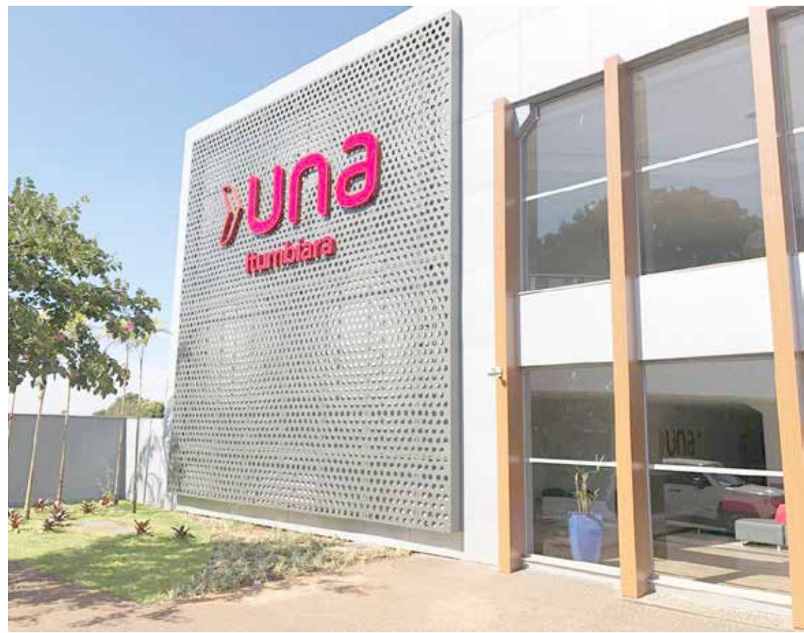
Unidade da Faculdade UNA em Itumbiara, na Avenida Santos Dumont

Costa garante que a Una oferece isso. “O curso dá a oportunidade de realizar atividades práticas, como estágios, atendimentos clínicos e cirúrgicos; promove atividades de extensão, atendimentos gratuitos e projetos sociais que aproximam alunos da comunidade, proporcionando uma formação