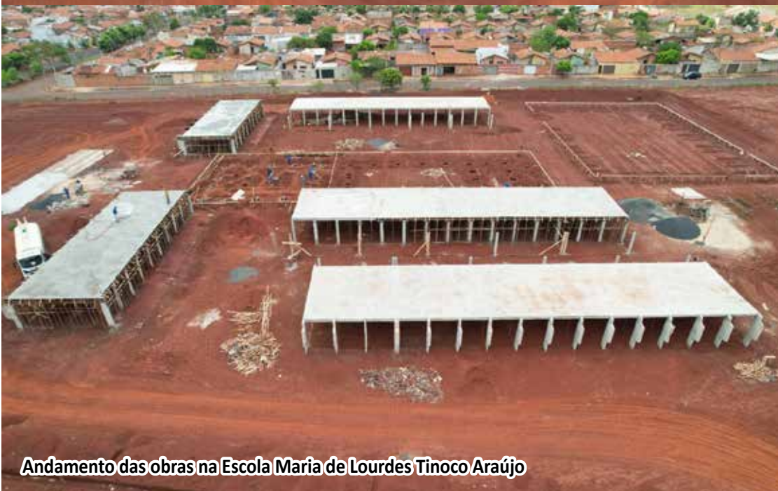
Andamento das obras na Escola Maria de Lourdes Tinoco Araújo