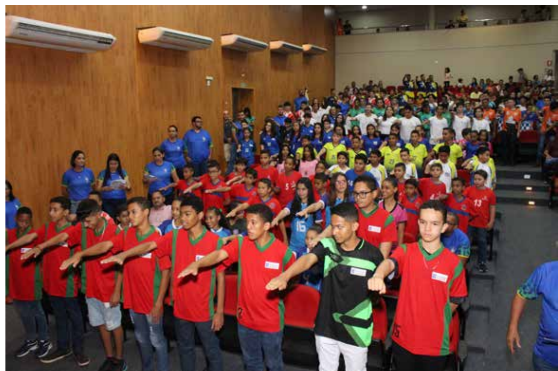
Atletas durante o juramento no Teatro Municipal