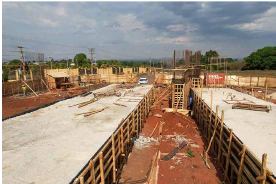
Obras em andamento no portal de entrada da cidade de Itumbiara pela BR-452: obra será entregue nos próximos meses pelo prefeito Dione Araújo