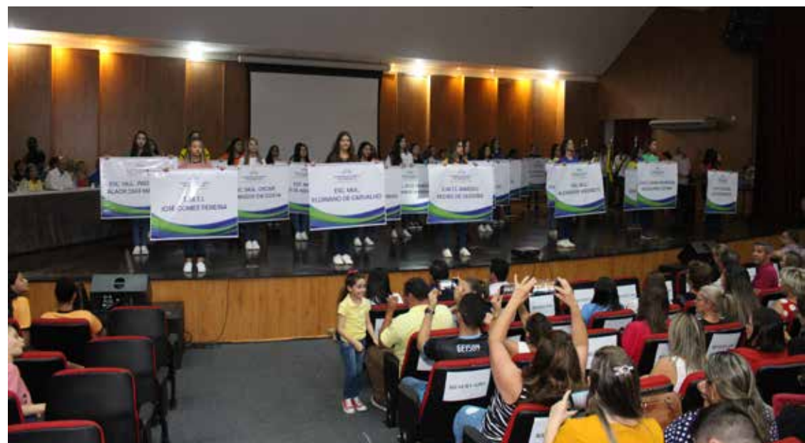
Representantes das 36 delegações de escolas que vão participar da Olimpíada Estudantil