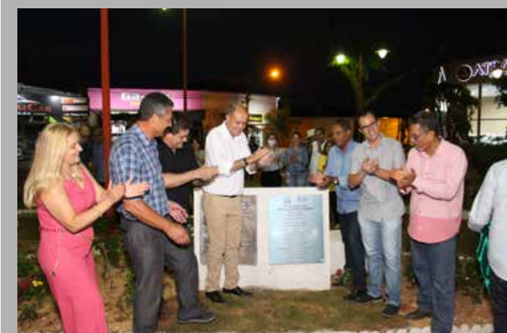
Descerramento da placa de revitalização da praça