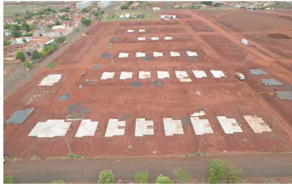
Construção dos alicerces de 170 moradias em andamento na região do Morada dos Sonhos. Parceria da Prefeitura com o governo de Goiás e Agehab, com investimento de mais de R$ 20 milhões

Governo de Goiás e Agehab estão investindo R$ 20 milhões. Todas as casas terão custo zero para os moradores, sem mensalidades.