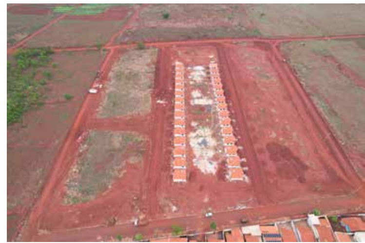
30 casas no conjunto Messias Faria, em fase final de conclusão

Na região do Morada dos Sonhos são mais 170 uni-