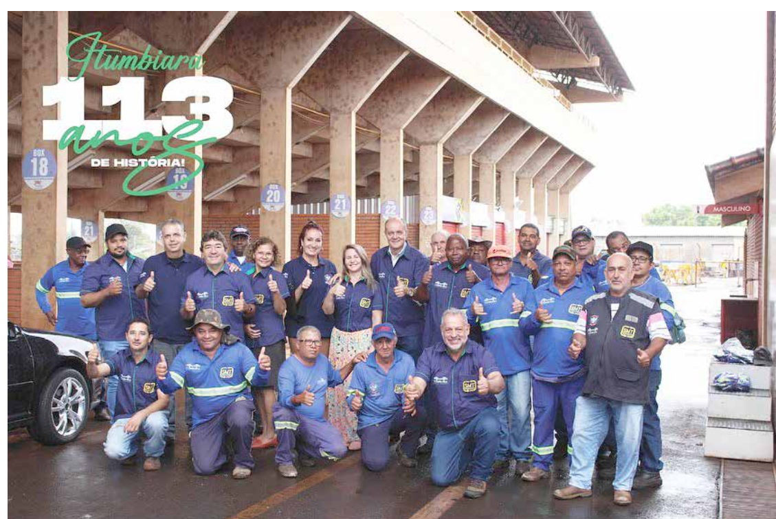
Servidores da Superintendência Municipal de Trânsito com os novos uniformes

que irá ajudar na identificação dos trabalhadores nas ruas, aumentando a segurança e visibilidade para os motoristas no trânsito.