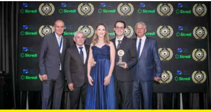
BELAFORMULA (FARMÁCIA DE MANIPULAÇÃO)