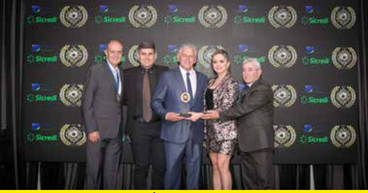
MOTOGOL (CONCESSIONÁRIA DE MOTOS)