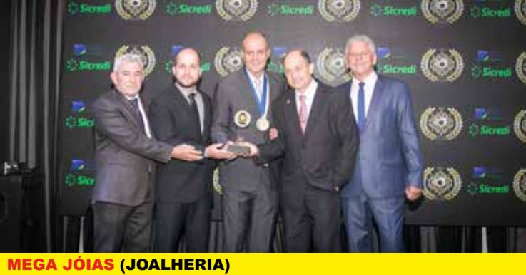
MEGA JÓIAS (JOALHERIA)