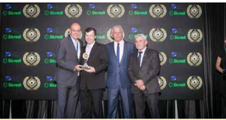
ULBRA (ENSINO SUPERIOR)