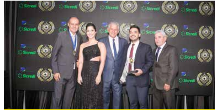
REIS SUPERMERCADO (SUPERMERCADO)