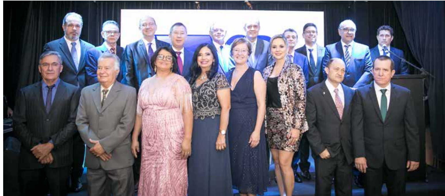
DIRETORIA DA CÂMARA DE DIRIGENTES LOJISTAS DE ITUMBIARA