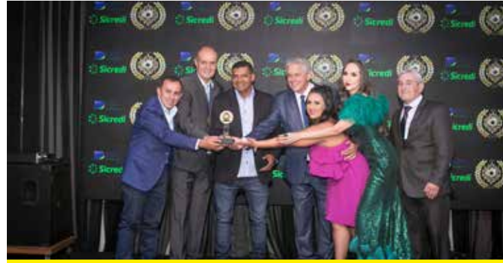
ALERTA SERVIÇOS (ALARMES E MONITORAMENTO)