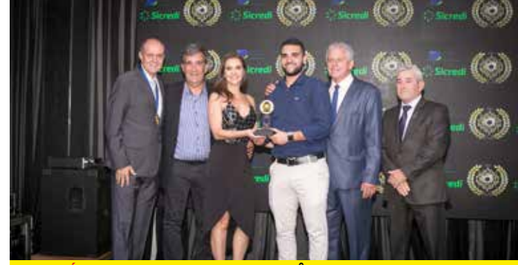
POLITÉCNICA (REVENDA E ASSISTÊNCIA AR CONDICIONADO)