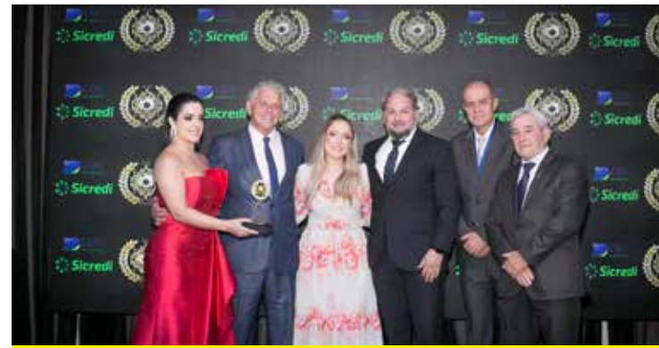
SECURITY (CORRETORA DE SEGUROS)