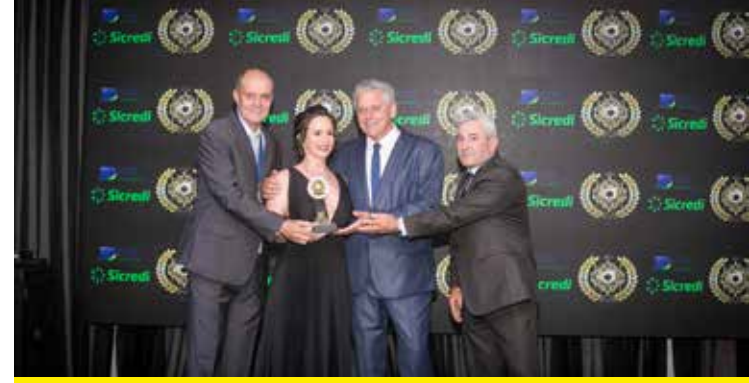
BILLY PET SHOP (PET SHOP)