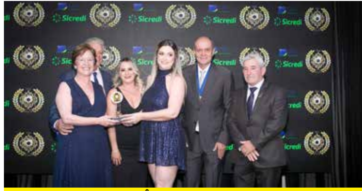
LEONOR TURISMO (AGÊNCIA DE TURISMO)