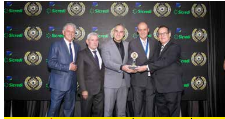
VENEZA VEÍCULOS (CONCESSIONÁRIA DE AUTOMÓVEIS)