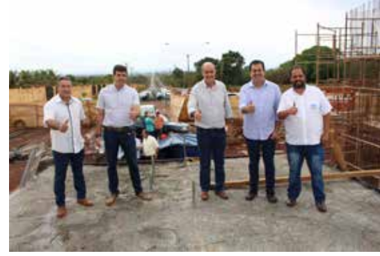
MODESTO DE CARVALHO Revitalização do trecho urbano da GO-206 está em fase de conclusão. Prefeitura está construindo o Portal de Entrada e vai fazer ainda o paisagismo e iluminação com LED