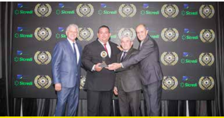
INVIOLÁVEL (PORTÕES E PORTAS AUTOMÁTICAS DE ENROLAR)