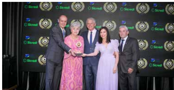
CENTRAL DE ELETRIFICAÇÃO (MATERIAL ELÉTRICO E HIDRÁULICO)