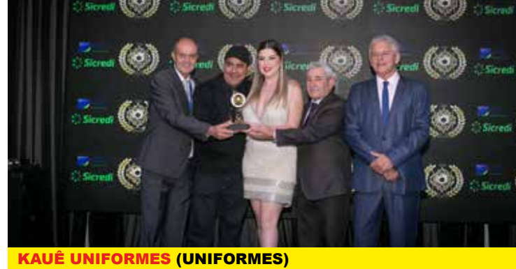
KAUÊ UNIFORMES (UNIFORMES)