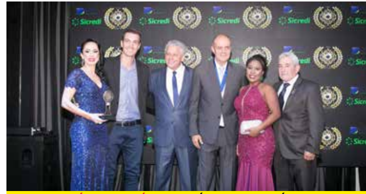
NERIAH CLÍNICA ESTÉTICA (CLÍNICA DE ESTÉTICA)