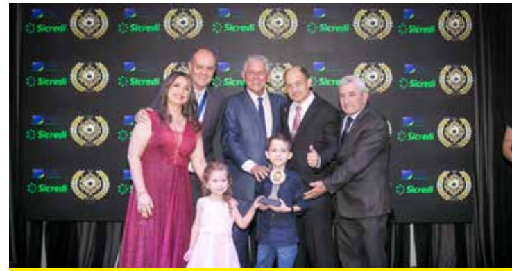
PATOTINHA MODA INFANTIL (MODA INFANTIL)