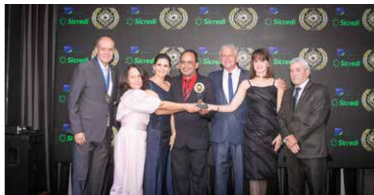
COLÉGIO ZÊNITE (ENSINO MÉDIO)