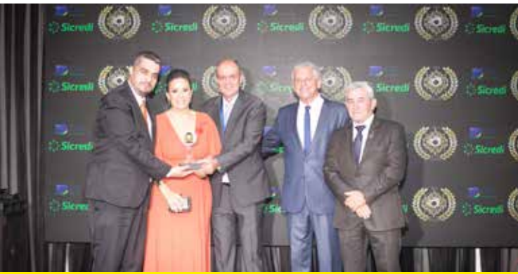
PÃO DOURADO (PANIFICADORA E CONFEITARIA)