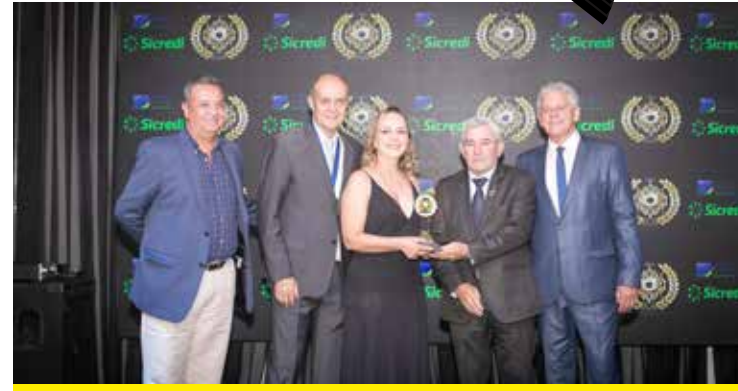
REY DO VIDRO (VIDRAÇARIA)