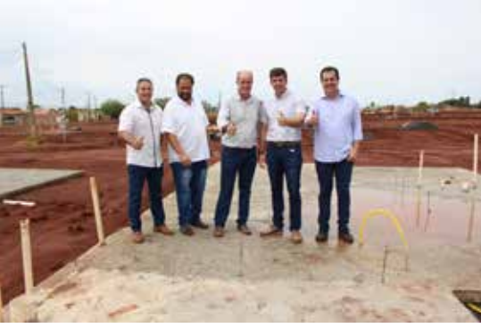
170 CASAS NO MORADA DOS SONHOS Prefeitura e AGEHAB conferem a construção das bases das casas populares. Governo de Goiás está investindo mais de R$ 20 milhões em moradia em Itumbiara