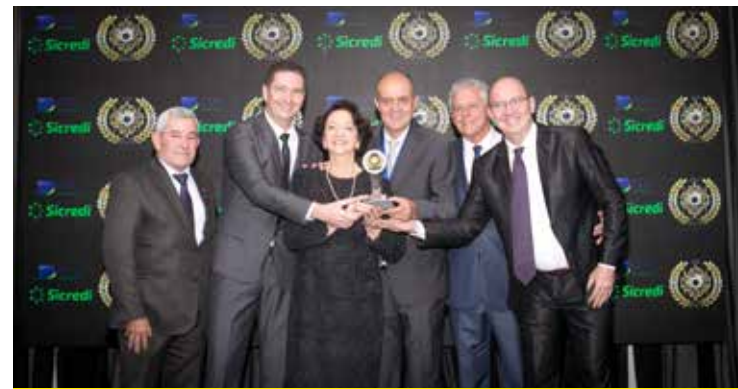
GUIZZETTI & GUIZZETTI (LOJA DE PEÇAS E FERRAMENTAS)