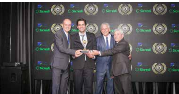
DANILO MOTOS (OFICINA/PEÇAS/ACESSÓRIOS PARA MOTOS)