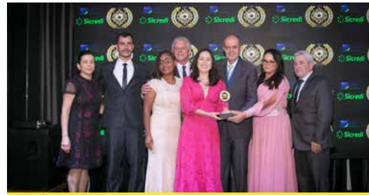
COLÉGIO ZÊNITE (ENSINO FUNDAMENTAL)