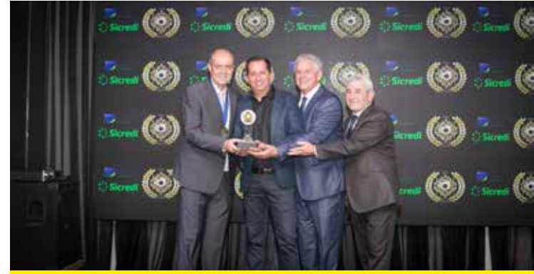
FOLHA DE NOTÍCIAS (JORNAL LOCAL IMPRESSO)