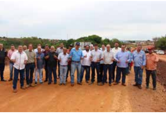
GO-309 RODOVIA ZÉ GOMES DA ROCHA Representantes da Prefeitura, Câmara, Sindicato Rural e GOINFRA na rodovia entre Itumbiara e Cachoeira Dourada. Capa asfáltica será aplicada na segunda