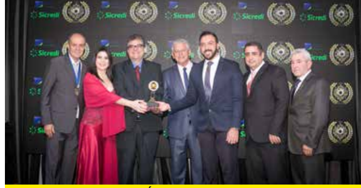
UNIMED (PLANO DE SAÚDE)