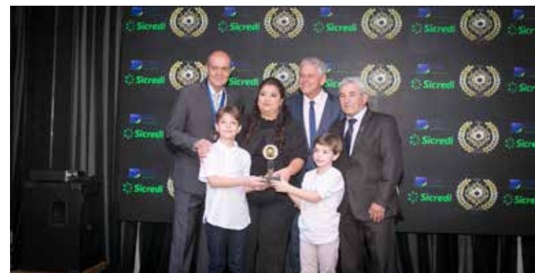
PAMAQ (MÓVEIS E EQUIPAMENTOS PARA ESCRITÓRIO)