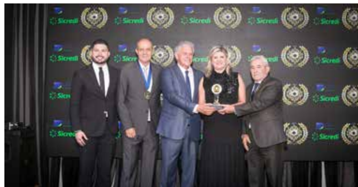
ALGAR TELECOM (OPERADORA DE TELEFONIA FIXA)