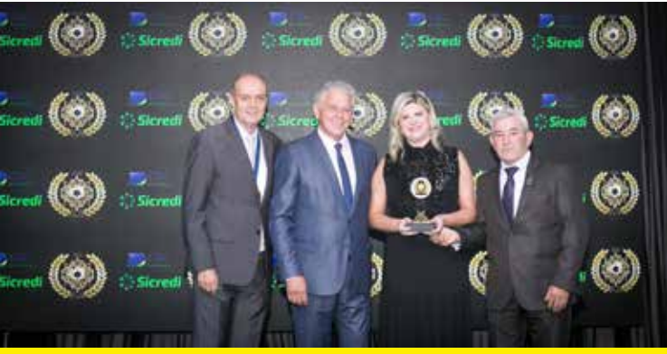
ALGAR TELECOM (EMPRESA DE INTERNET)