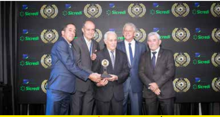
IAE - ITUMBIARA AUTO ELÉTRICA (AUTO ELÉTRICA)