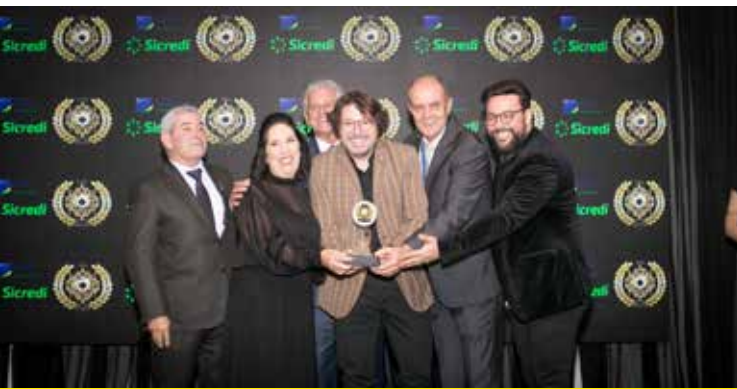
CLÁSSICUS CERIMONIAL (DECORAÇÃO DE EVENTOS)