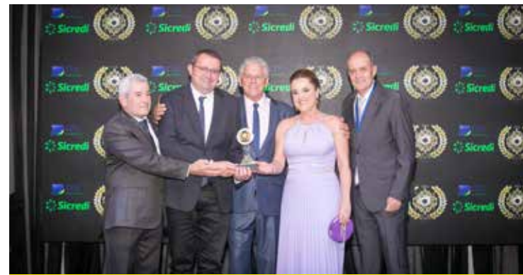
ALMA PROPAGANDA (AGÊNCIA DE PUBLICIDADE)