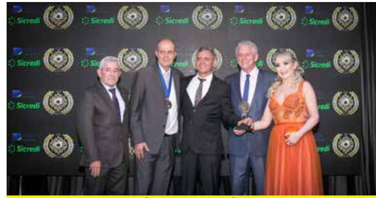
GAVOLA NET (INFORMÁTICA - ASSISTÊNCIA E EQUIPAMENTOS)