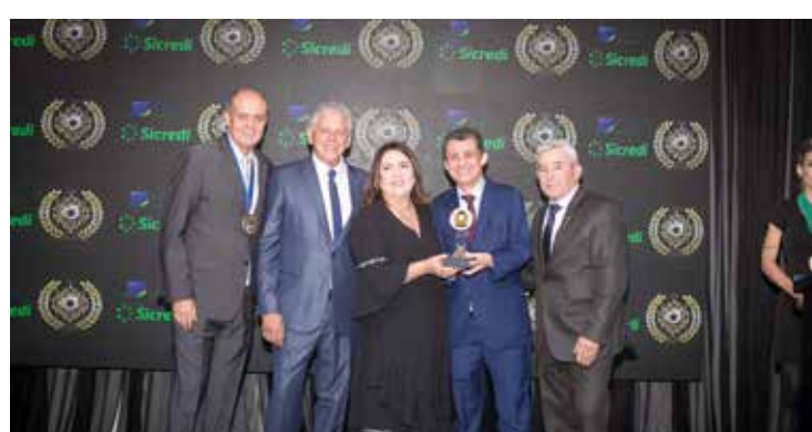
KIPASSO (LOJA DE CALÇADOS)