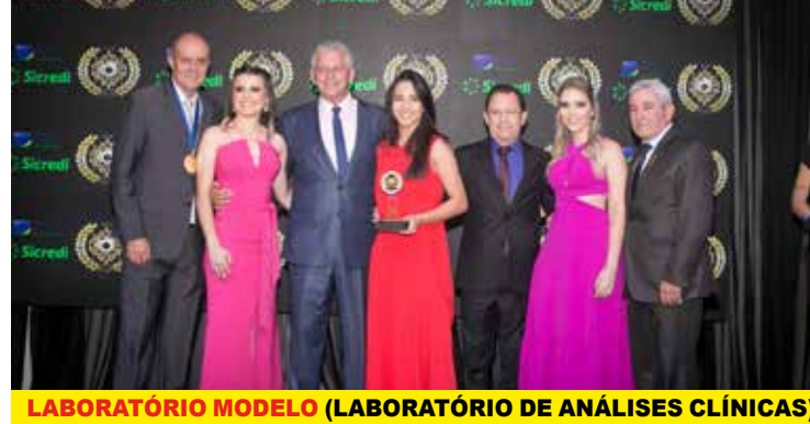
LABORATÓRIO MODELO (LABORATÓRIO DE ANÁLISES CLÍNICAS)