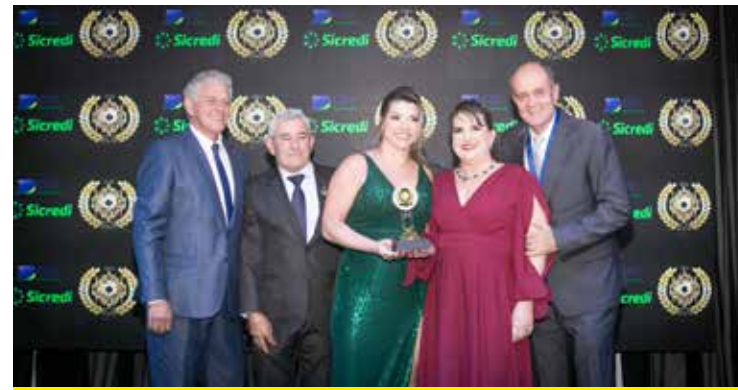
ENILSA PERFUMARIA (COSMÉTICOS E PERFUMARIA)