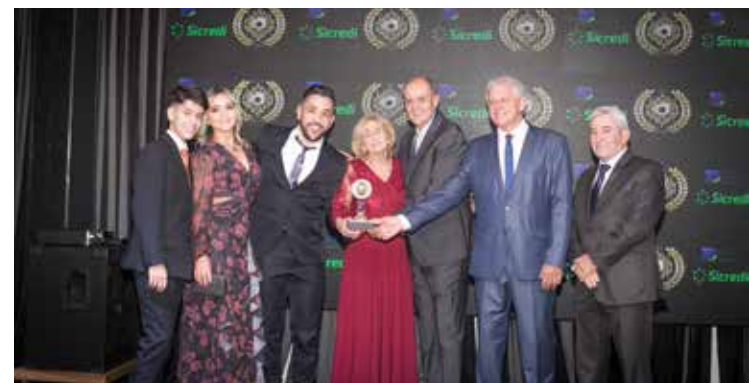
TIJOLÃO (MATERIAL PARA CONSTRUÇÃO)