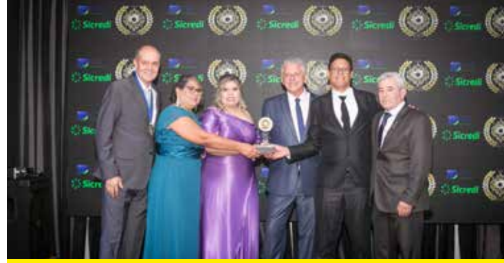
APOLO (LIVRARIA E PAPELARIA)