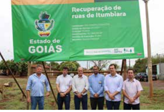
ALTO DO TRINDADE Resultado da parceria entre Governo/GOINFRA e Prefeitura/Câmara, o asfalto do Bairro Alto do Trindade custou R$ 4 milhões e será inaugurado em outubro