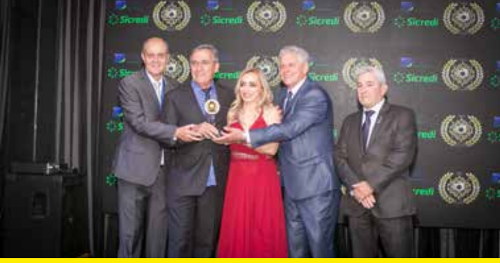
CENTER PISOS (PISOS E ACABAMENTOS)