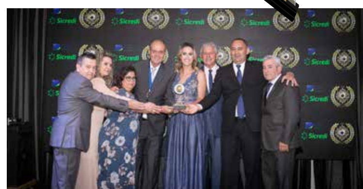
FAMÓVEIS (LOJA DE MÓVEIS E DECORAÇÕES)