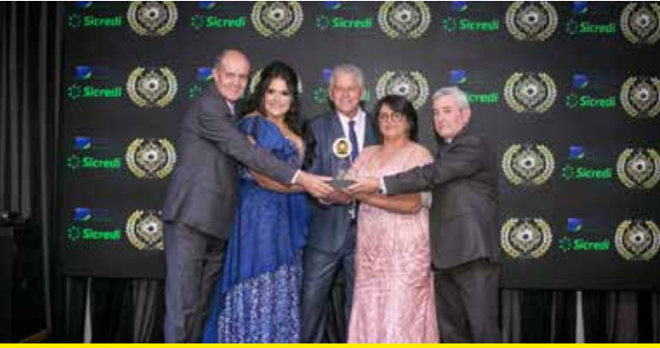
A NOIVA MODERNA (TRAJES PARA NOIVAS, NOIVOS E FESTAS)