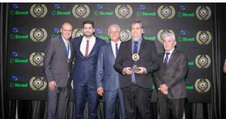
RÁDIO PARANAÍBA (EMISSORA DE RÁDIO)