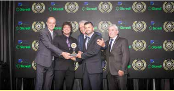
MAIS SAÚDE (REVISTA LOCAL IMPRESSA)