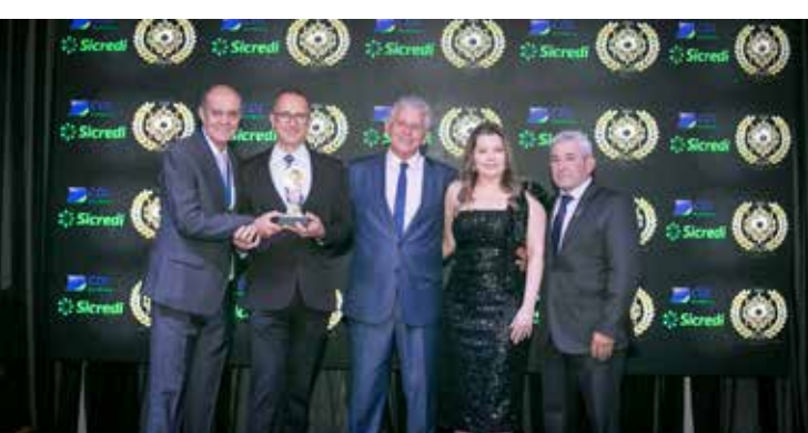
RENNER BIKE (LOJA DE BICICLETAS)