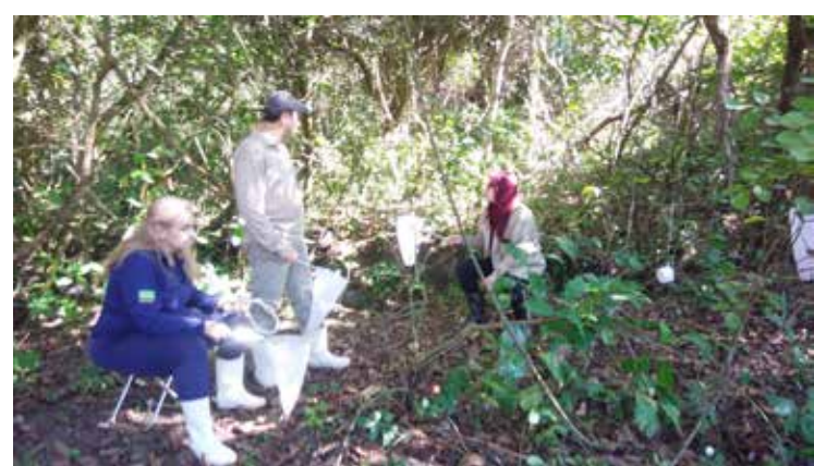
Coleta na mata ciliar às margens do Rio Paranaíba

Uma coleta semelhante aconteceu em 2017 na mata ciliar da Avenida Beira Rio e resultou na captura de 436 mosquitos de 9 espécies diferentes, todos com capacidade de transmissão de doenças, inclusive febre amarela. Um novo levantamento com a equipe técnica estadual acontece neste semana na cidade.