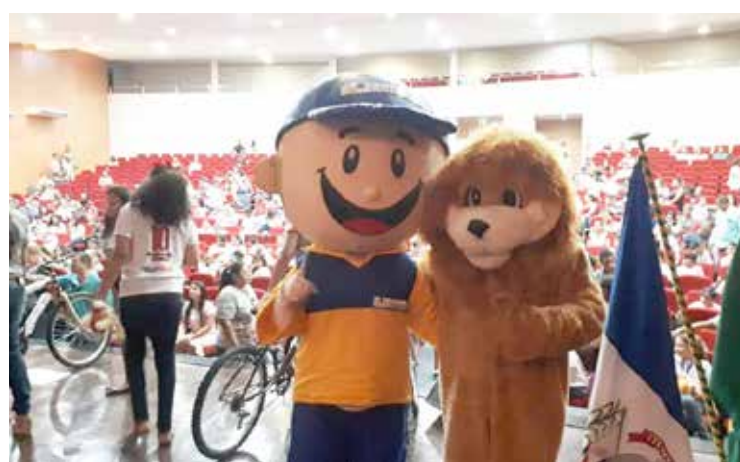
Mascotes Correios e PROERD no Teatro Municipal

experiências do cotidiano dos participantes e, sobretudo, exploram suas potencialidades. As aulas são bastante dinâmicas, com a participação de grupos e aprendizado cooperativo, por meio de dramatizações e estudos de casos.