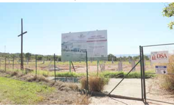
Local onde está sendo erguido o novo Santuário de Panamá

A Prefeitura de Panamá é a grande parceira na realização da festa, oferecendo toda estrutura, com apoio da Câmara Municipal. A cidade se prepara para receber milhares deromeiros, de todo Sul Goiano e Triângulo Mineiro, mobilizando toda sua estrutura para receber bem os visitantes.