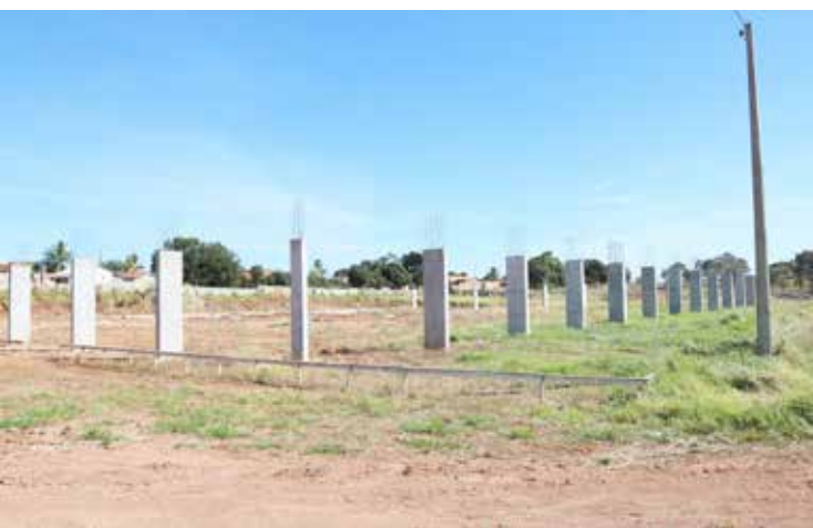
Obra foi iniciada em 2018 pela DSA Construtora e fundação foi concluída, com as primeiras colunas erguidas