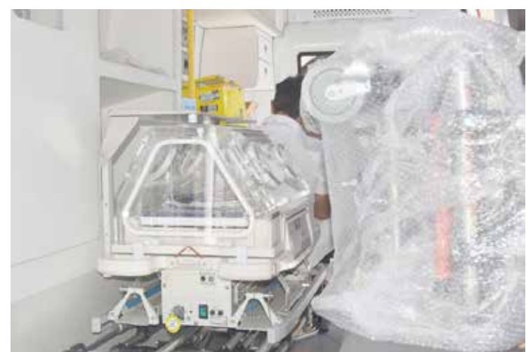
UTI Móvel foi adquirida por R$ 540 mil, com recursos direcionados pelo Ministério Público do Trabalho