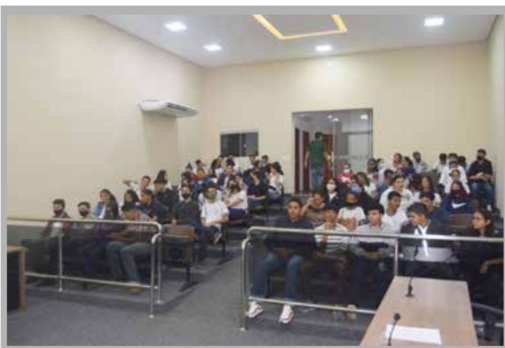
Alunos durante a palestra no auditório da Câmara Municipal