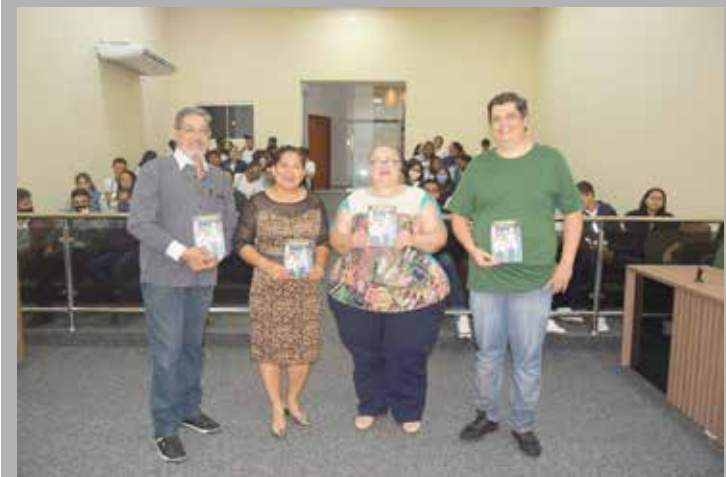
Representantes do COMTUR, SEMED e SECTUR durante o evento do Circuito Turístico Rota do Triângulo em Araporã

O exemplar também será distribuído em toda rede municipal e estadual de educação do município de Araporã.