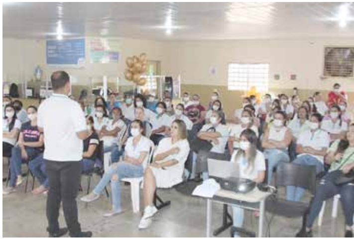
Treinamento com servidores da Saúde de Buriti Alegre

Os servidores da área de Saúde em Buriti Alegre receberam orientação sobre a monkeypox. O treinamento foi realizado por uma equipe capacitada e especialista na chamada "Varíola dos Macacos". Os servidores da saúde como lidam direto com a população, foram orientados de como informar, auxiliar e possivelmente encaminhar um paciente com sintomas da doença a um tratamento correto.