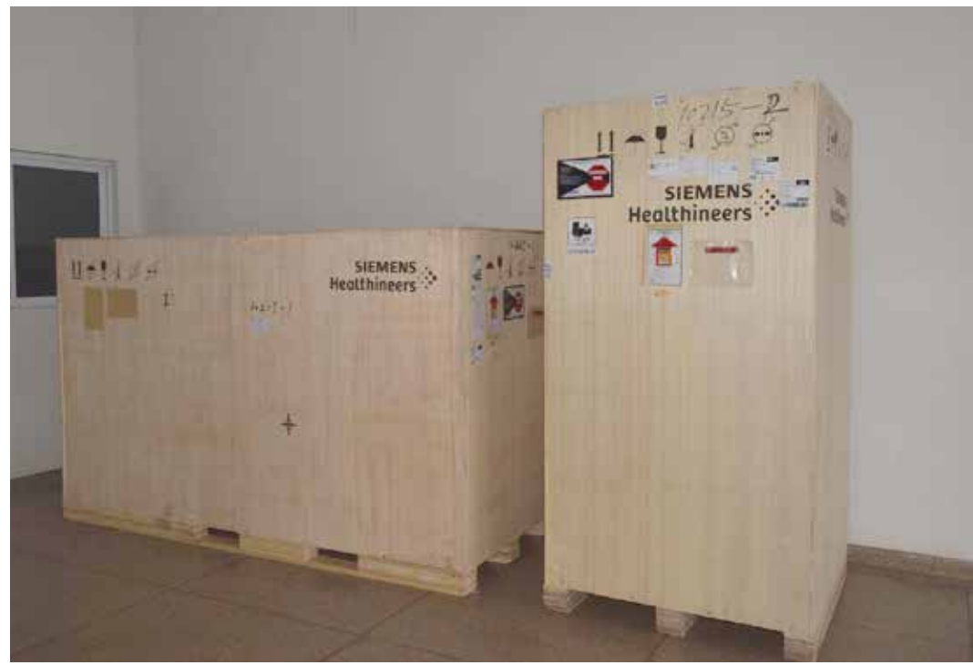
Equipamento custou R$ 340 mil e será instalado no hospital público de Araporã

O arco cirúrgico é utilizado geralmente em cirurgias de urologia, ortopedia, vasculares, implantes de marca passos entre outros procedimentos, no qual é possível produzir imagens em tempo real com até milhares de tons cinza através de geração de imagens digitais.