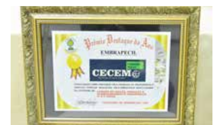
CECEM - ESCOLA DE LÍNGUAS, REDAÇÃO E ACOMPANHAMENTO PEDAGÓGICO Rua Pres. Antônio Carlos, 48 / 3281-6859