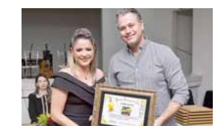
RÁDIO SUCESSO FM 91,9