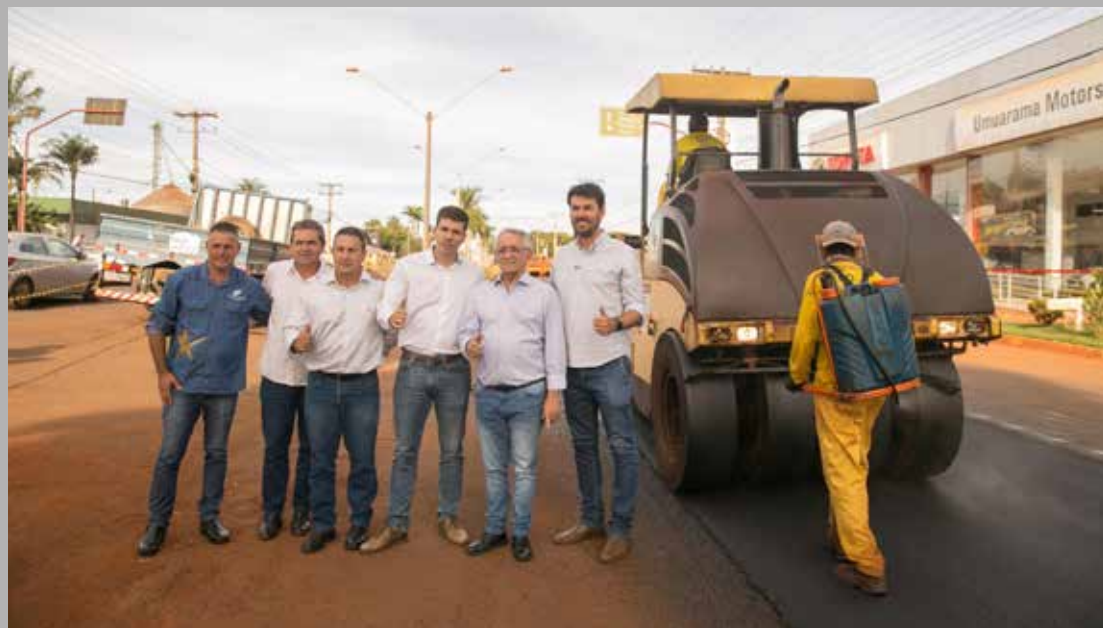
Pavimentação da Avenida Modesto de Carvalho

Na GO-309, o investimento é de R$ 46 milhões, com a pavimentação de 31 quilômetros, sendo três deles duplicados a partir da saída do Bairro Brasília. Máquinas e homens da construtora trabalham a todo vapor e a previsão é que o asfalto comece a ser aplicada ainda no mês de junho. As obras são fruto do trabalho do prefeito Dione Araújo e deputado Álvaro junto ao governador Ronaldo Caiado.