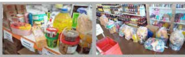
Apreensão de alimentos impróprios para consumo em supermercado

A apreensão ocorreu durante fiscalização feita pela equipe da Polícia que coletou que vários alimentos e produtos artesanais e depositados à venda estavam fora do prazo de validade, situação confirmada pelos agentes de polícia. O proprietário do estabelecimento, sob voz de prisão, foi conduzido ao 2º Distrito Policial e autuado em flagrante delito, respondendo pelo crime estipulado no art. 2º, inciso IX, da Lei 8.137/90, cuja pena máxima pode chegar a 5 anos de detenção, além da sanção administrativa que será aplicada pelo órgão municipal.