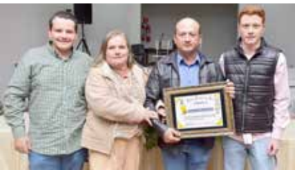
TÁXI TUPACIGUARA Conforto e Segurança. Rua Tiradentes, 217 / (34) 3281-1313