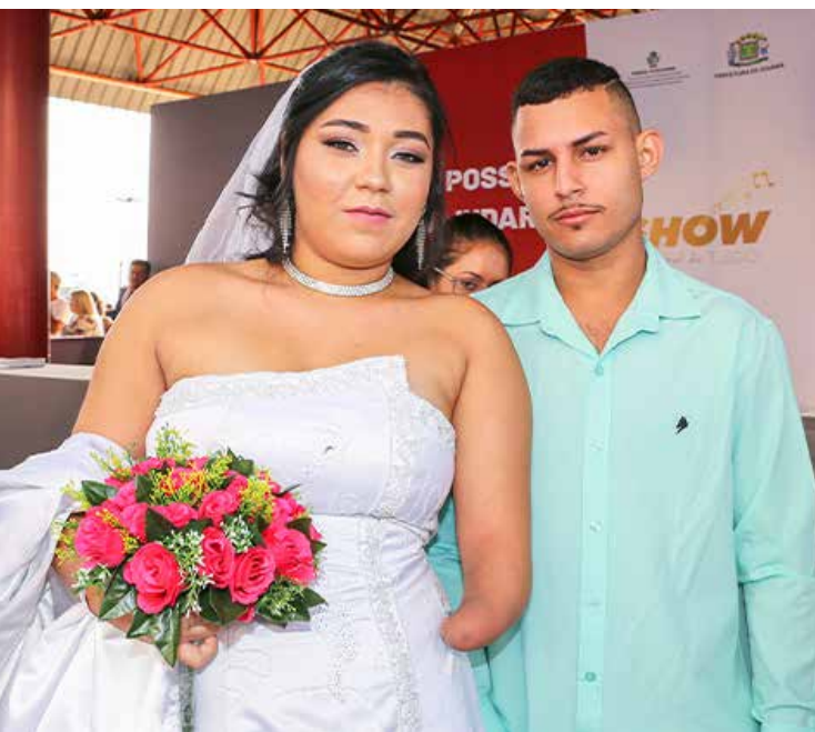
Casamento Comunitário organizado pelo TJGO