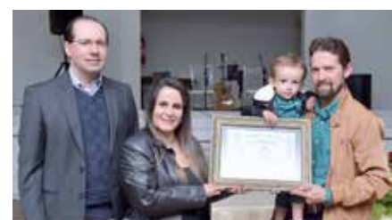
HORTIFRUTI VILA VERDE Rua José Pereira de Carvalho, 111 (34) 99806-3223