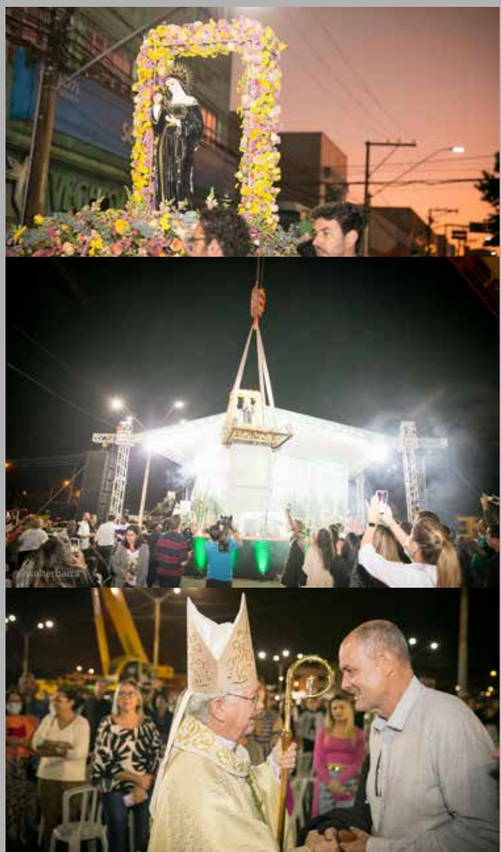
Imagens da missa de Santa Rita de Cássia, no dia 22/05

A imagem de Santa Rita foi suspensa com um guindaste e ficou cerca de 20 metros de altura durante toda a celebração. O governador Ronaldo Caiado iria participar do evento, mas como estava se recuperando da Covid, enviou como representante seu assessor especial, Rogério Troncoso. O deputado estadual Álvaro Guimarães e o prefeito Dione Araújo participaram da missa.