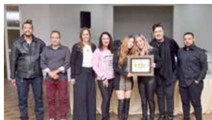
AUTO ESCOLA TUPACIGUARA Rua Bueno Brandão, 65 (34) 3281-1539