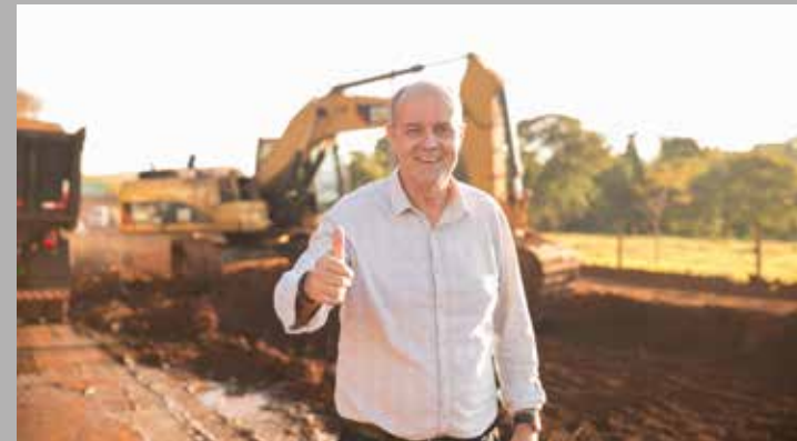
Prefeito Dione Araújo percorrendo trecho da GO-309 em obras: sonho antigo da população que se torna realidade