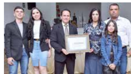
AUTO ELÉTRICA RODRIGUES Auto Elétrica e Ar-Condicionado Rua 2, Vagner Rossi nº 02 (34) 3281-4460