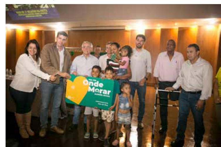
Entrega dos cartões no Teatro Municipal

Teatro Municipal. As entregas desta semana foram realizadas para famílias já inscritas e aprovadas, conforme checagem da documentação entregue. O programa garante R$ 350,00 mensais para os beneficiados pelo período de 18 meses, podendo ser prorrogado por igual período. Para ter direito ao benefício, a família tem que estar com o CadÚnico atualizado, morar há pelo menos 3 anos na cidade, estar em situação de vulnerabilidade social e não possuir imóvel próprio. O cadastro continua aberto, pois são 500 vagas para Itumbiara.