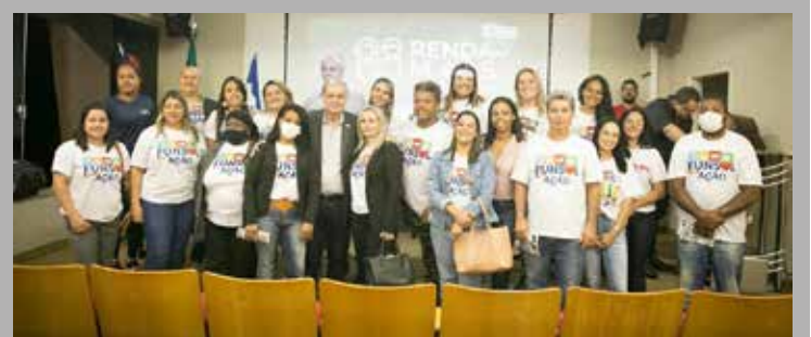
Prefeito Dione Araújo com equipe da FUNSOL

Serão priorizadas famílias chefiadas por mulheres, com maior número de crianças e adolescentes menores de 18 anos, que tenham familiares com deficiências e/ou pessoas incapacitadas para a vida independente e o trabalho profissional, ou ainda idosos com mais de 60 anos e menos de 65 anos, e que, na