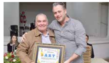
ART - ASSOCIAÇÃO RECREATIVA TUPACIGUARENSE Salão de Eventos