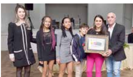
IINBOX BIJUTERIAS E ACESSÓRIOS Rua Bueno Brandão, 45 (34) 99203-9996