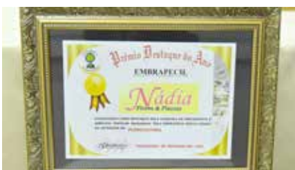
NÁDIA FLORES E PLANTAS - Floricultura Av. Tiradentes, 211 (34) 99660-6260