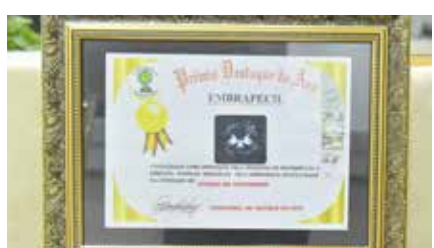
SAHARA TATOOS BODY PIERCING Studio de Tatuagens - Rua Bueno Brandão, 121-A / (34) 99142-0038