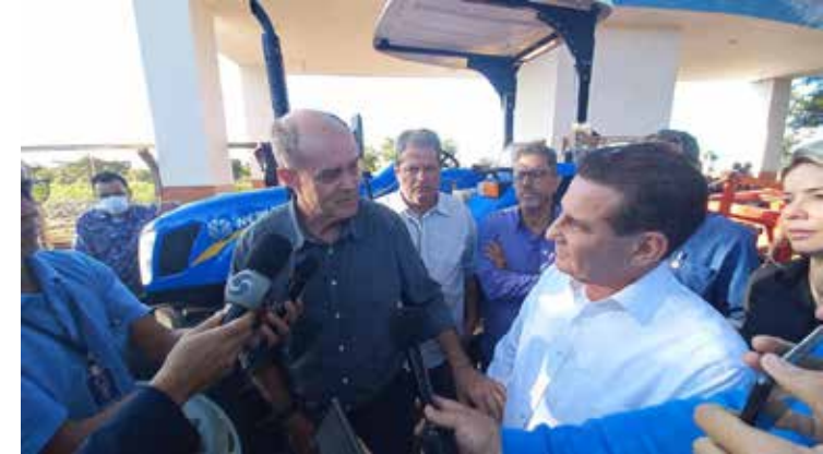
Visita do senador Vanderlan Cardoso em Itumbiara