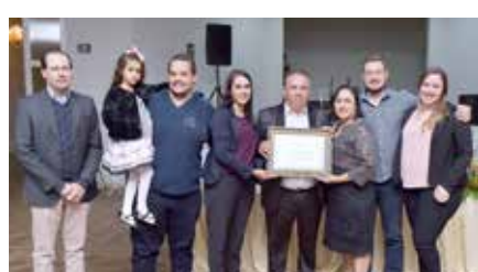
PLASTIFORROS - Forros PVC, Acartonado e Vidraçaria - Rua Duarte Ulhoa, 40 (34) 99662-5336