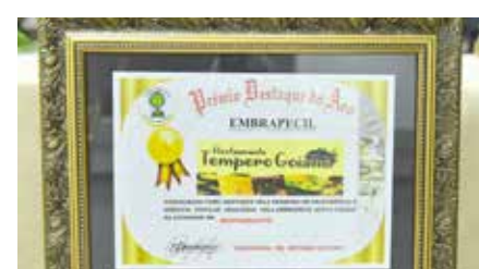
RESTAURANTE TEMPERO GOIANO Rua Bueno Brandão, 57 (34) 99964-8666