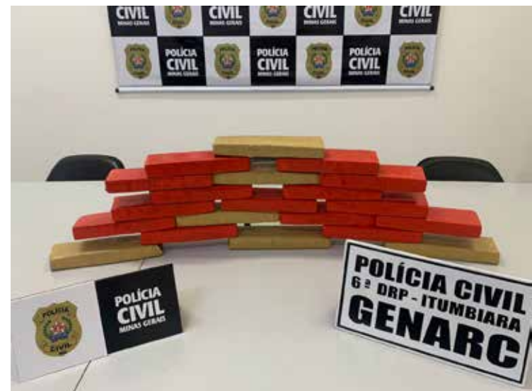
20 tabletes de maconha foram apreendidos com o menor

A ação ocorreu na cidade de Uberlândia/MG após investigações conduzidas pelo GENARC que apontaram que um adolescente, morador de Itumbiara, transportaria grande quantidade de drogas para a cidade. Diante das informações, a fim de evitar que a droga ingressasse em território itumbiarense e aqui fosse difundida, a equipe do GENARC se deslocou até a cidade mineira, e lá, com o