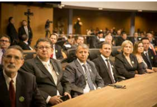
Diretores da Caramuru Alimentos prestigiando a sessão especial na Assembleia Legislativa