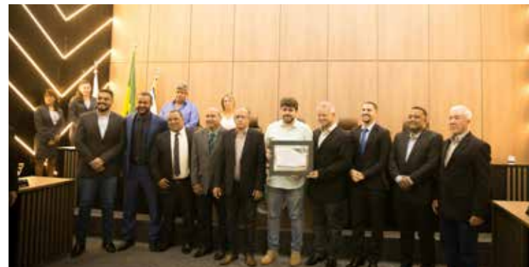
HONRA AO MÉRITO Deputado federal Zé Vitor