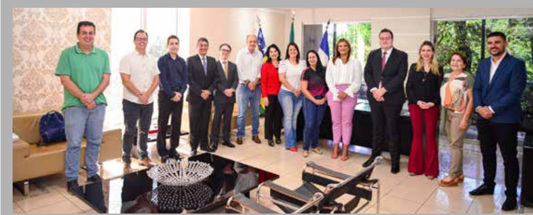
Representantes dos poderes Executivo, Legislativo, Judiciário, Ministério Público, Polícia Civil e Rede de Proteção à Mulher no Palácio 12 de Outubro