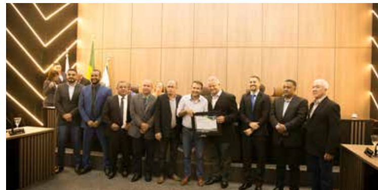
HONRA AO MÉRITO Deputado estadual Arnaldo Silva