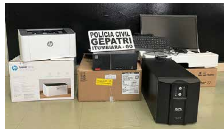
Equipamentos recuperados pela Polícia

O delito ocorreu no dia 27 de março de 2022, por volta das 18h, oportunidade em que dois indivíduos subtraíram um computador, um monitor, um nobreak e uma impressora, objetos avaliados em mais de R$ 10.000,00 (dez mil reais). Após serem identificados