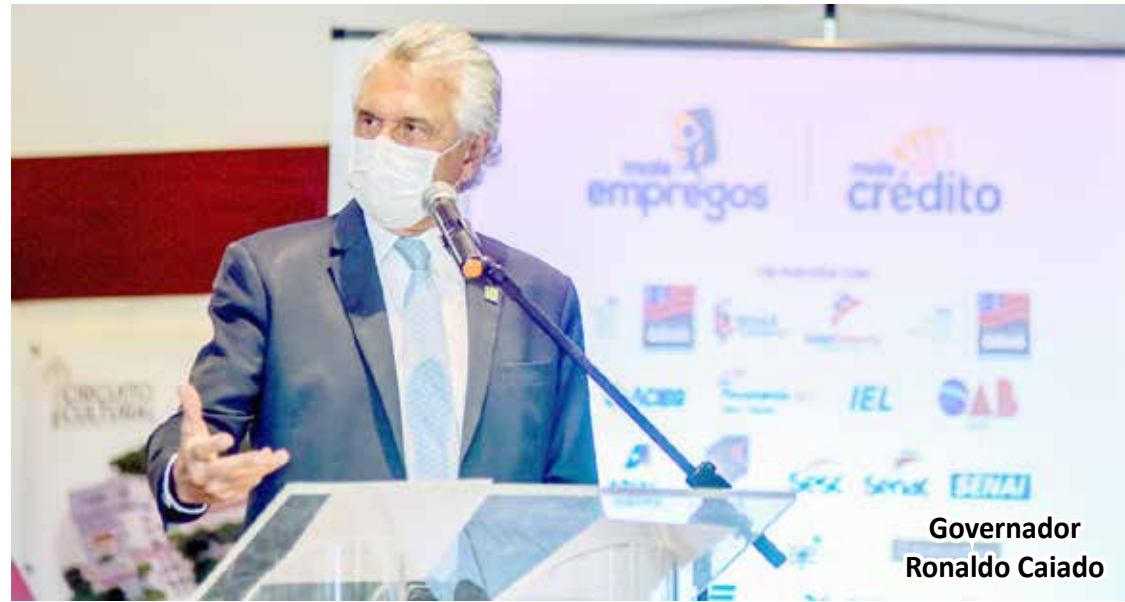
Governador Ronaldo Caiado

Em Itumbiara, o saldo é de 1.898 empregos gerados desde janeiro de 2021.