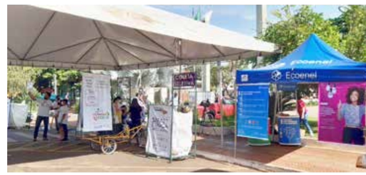
Posto de recolhimento na Praça da República

Na Faculdade Una, foi realizada mesa redonda com o tema: "Coleta Seletiva - Legislação e Operacionalização".