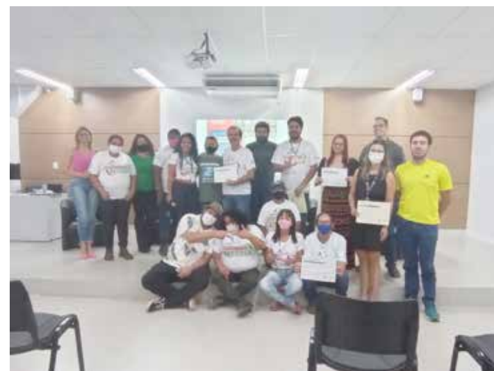
Mesa redonda sobre coleta seletiva, na Faculdade UNA