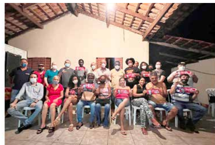
Em reunião com movimentos negro e popular