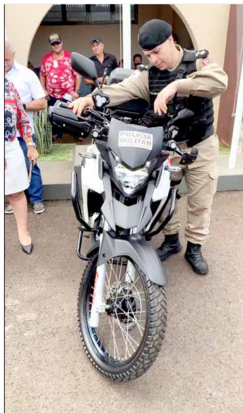
Motocicleta vai ajudar no policiamento das ruas de Araporã, contribuindo para uma cidade mais segura e tranquila