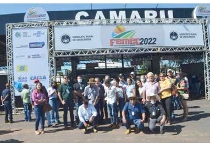
Comitiva de Araporã no CAMARU, em Uberlândia