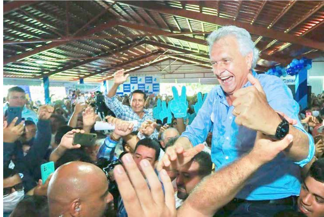
Governador Ronaldo Caiado durante encontro multipartidário em Jaraguá

Em Jaraguá, representantes de 200 municípios marcaram presença, entre eles 116 prefeitos. Os presidentes do MDB, PRTB, Avante, Cidadania, PSC, PP, Solidariedade e PV declararam apoio à reeleição do governador. Também estavam presentes