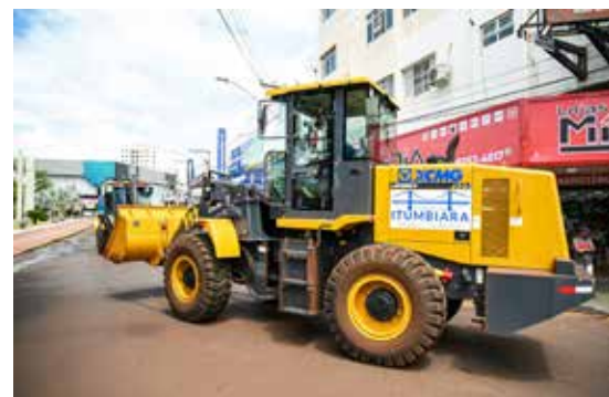
Pá carregadeira (recursos próprios da Prefeitura)