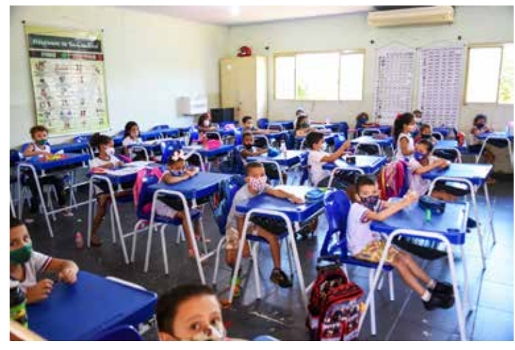
Sala de aula da Escola Municipal Peixoto da Silveira, com novas carteiras e mobiliário escolar adquirido na atual gestão e entregue no início do ano letivo