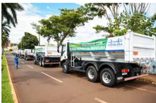
6 caminhões basculantes (recursos próprios da Prefeitura)