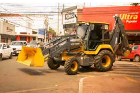
Retroescavadeira (recursos próprios da Prefeitura)