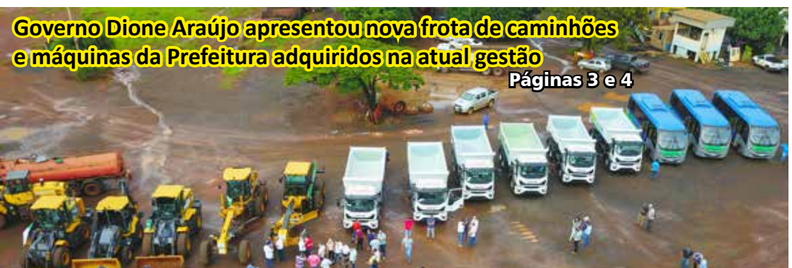
Governo Dione Araújo apresentou nova frota de caminhões e máquinas da Prefeitura adquiridos na atual gestão

O município de Itumbiara já aplicou 200 mil doses de vacina contra a Covid-19 na população. São 85.141 (1ª dose), 75.861 (2ª dose), 33.133 (3ª dose) e 5.703 (pediátrica). A vacinação segue em cinco postos da cidade: Clínicas Dionária Gomes (Vila Vitória), Dr. Antônio de Pádua Peppe (Marolina), Dr. Mário Guedes (Saúde) e ainda no Palácio das Águas (Nova Aurora) e CAIS (Anhangueira). O último boletim aponta 374 casos ativos, com apenas dois pacientes internados na enfermaria. 85% da população já recebeu uma dose e 75% duas doses da vacina.