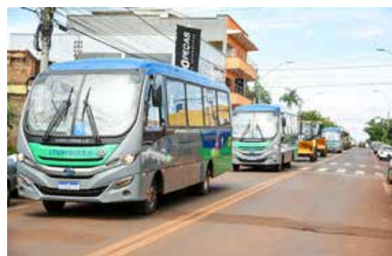
6 ônibus do transporte coletivo (recursos próprios da Prefeitura)