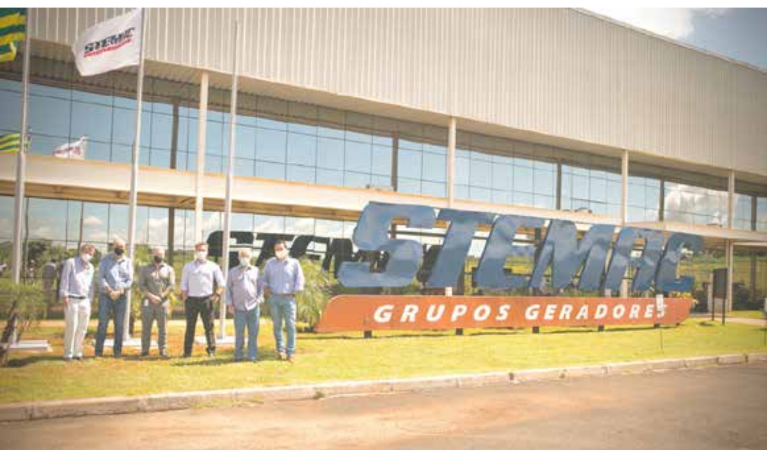
Visita na unidade da Stemac em Itumbiara

A Stemac, maior especialista nacional na fabricação e comercialização de grupos geradores, anunciou a inauguração neste mês do novo centro nacional de distribuição de peças em Itumbiara-GO. “Nós estamos aumentando e