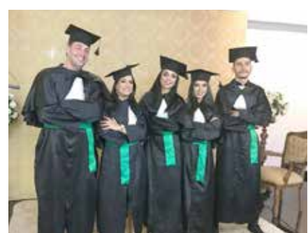
Formandos de Educação Física