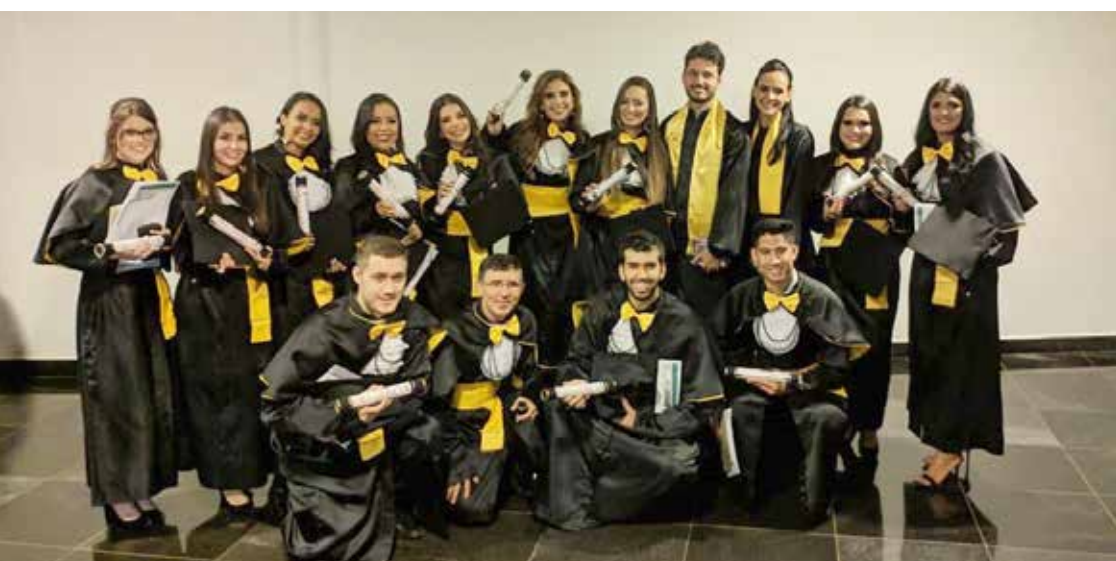
Formandos do curso de Farmácia da UEG