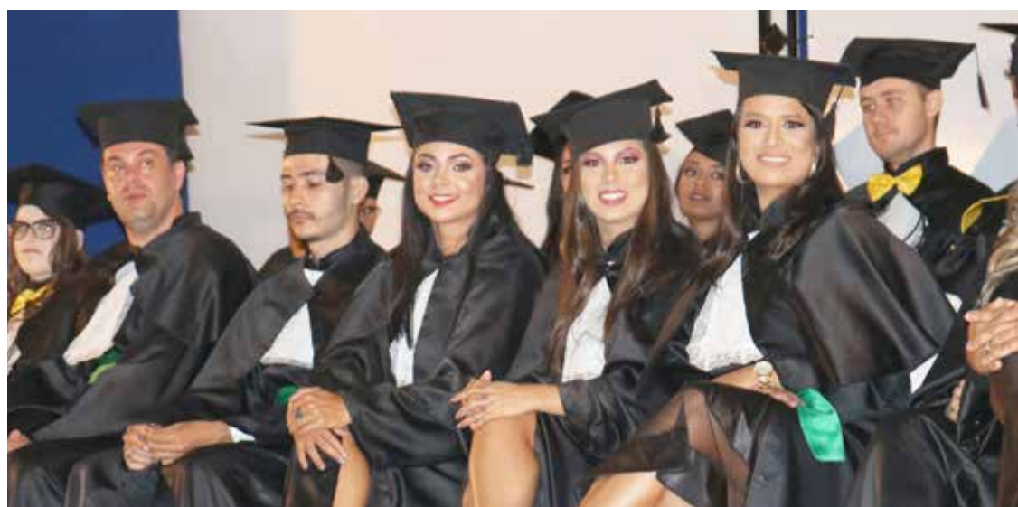
Formandos do curso de Educação Física (Licenciatura): primeira turma da UEG