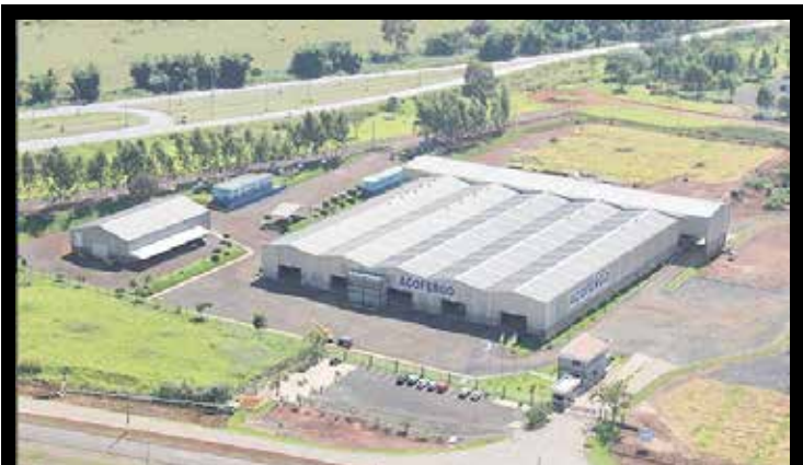
Unidade da Açofergo em Itumbiara