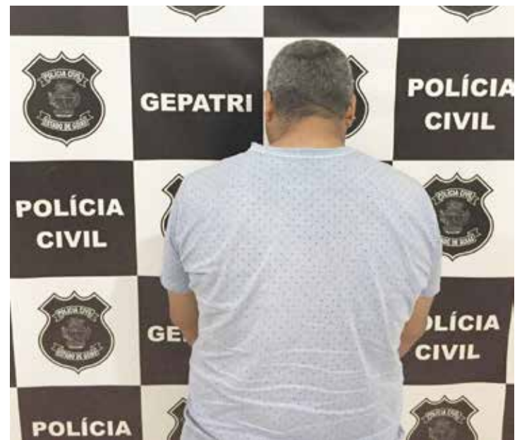
Homem de 41 anos foi identificado a partir de uma denúncia feita pelo Conselho Tutelar de Cachoeira Dourada

O inquérito policial concluído será remetido ao Poder Judiciário em 10 (dez) dias, respondendo o investigado por crime de estupro de vulnerável (pena de até 15 anos de reclusão) e ameaça (pena de até seis meses de detenção).