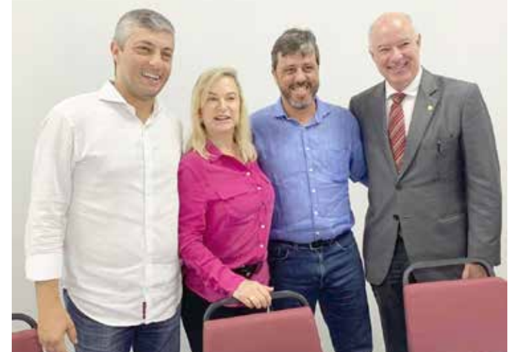
Prefeito André Chaves, deputada federal Magda Mofatto, vice-prefeito João Rafael e o presidente da Frentur, deputado federal Herculano Passos, durante reunião da Comissão de Turismo da Câmara dos Deputados, na capital goiana

De acordo com o prefeito André Chaves, hoje existem 18 Kombis, com mais de 10 anos de uso, que transportam diariamente 300 crianças da rede municipal e estadual. Com os recursos, a Prefeitura vai adquirir veículos maiores, vans, com ar-condicionado, cinto de três pontos e freio ABS, garantindo maior conforto e segurança aos estudantes, além de economia com combustível. André participou da reunião e agradeceu aos vereadores que votaram pela autorização legislativa.