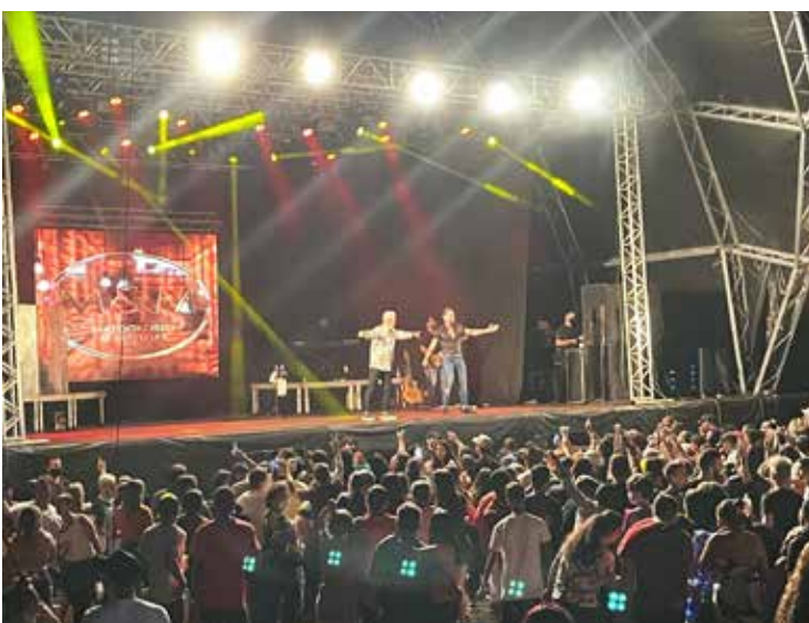
Grande público presente no Parque de Exposições