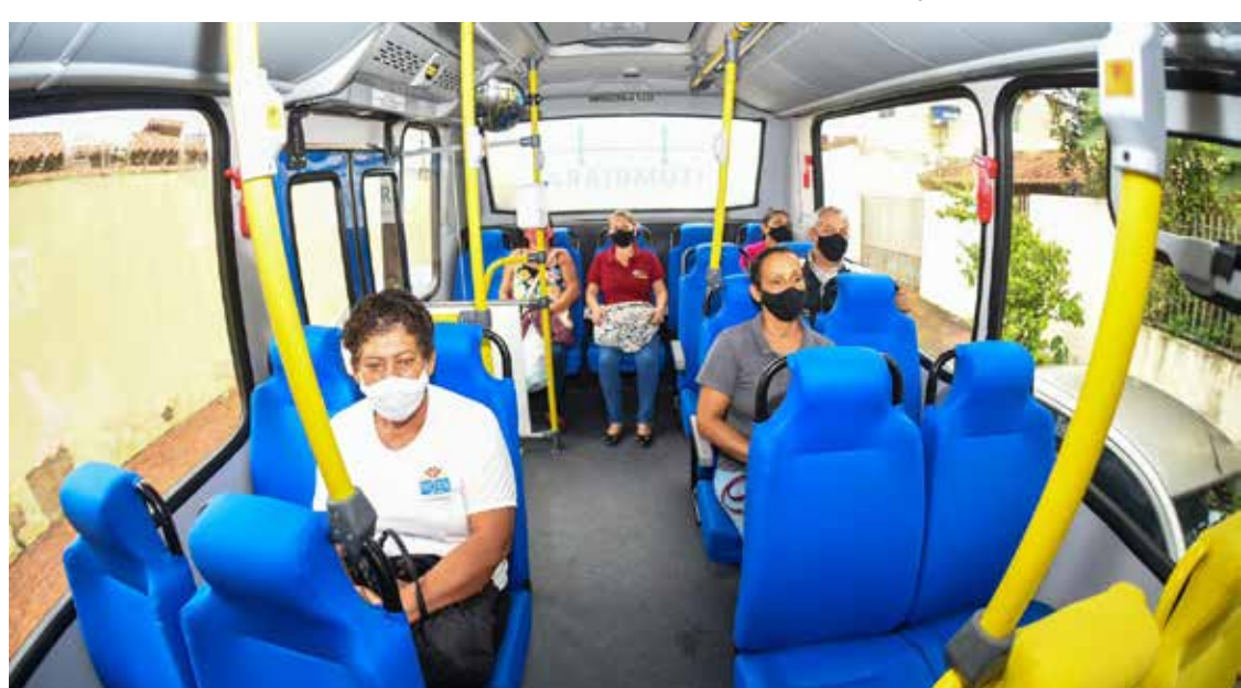
Usuários do transporte coletivo em Itumbiara, agora administrado pela SMT

A lista completa, com os itinerários, está disponível no site da Prefeitura, www.itumbiara.go.gov.br , na aba https://itumbiara.go.gov.br/transporte coletivo/