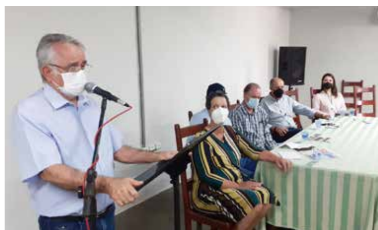
Deputado estadual Álvaro Guimarães