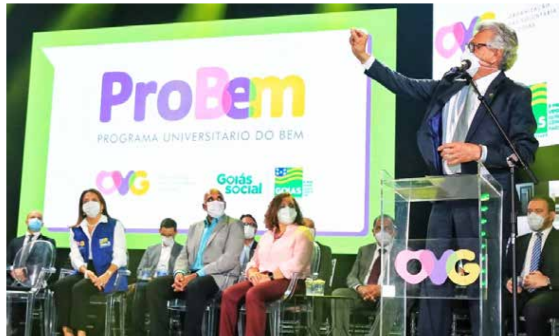
Governador Ronaldo Caiado durante o anúncio das novas bolsas para universitários

ProBem é necessário que o estudante esteja inscrito no Cadastro Único para Progra-mas Sociais do Governo Fe-deral (CadÚnico) e possua vaga na Instituição de Ensi-no Superior (IES). Para esse processo seletivo, a inscrição no CadÚnico precisa ter sido