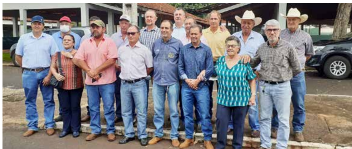
Membros da diretoria do Sindicato Rural 2022/2025