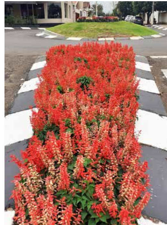
Prédios públicos e canteiros centrais bem cuidados em Goiatuba