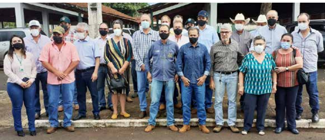
Diretoria do Sindicato Rural com o prefeito Dione Araújo