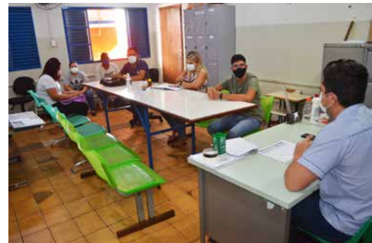
Técnicos de saúde reunidos em Araporã

O trabalho de eliminação de focos e criadouros para o mosquito que já é realizado rotineiramente, como visitas domiciliares, retirada de mate-rial em quintais e terrenos baldios, bloqueio com aplicação de inseticida, também será intensificado. Além de bombas costeais motorizadas e bombas jato já disponíveis para a Vi-gilância, é meta da Secretaria da Saúde a aquisição de um veículo para UBV pesado (co-nhecido como fumacê) para o