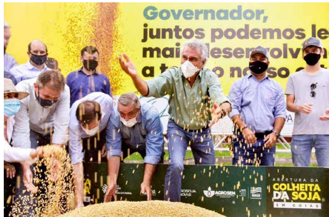
Governador Ronaldo Caiado na abertura da colheita da soja em Montividiu

“Enxergo Goiás como sendo o Estado com maior capacidade de desafiar o mo-mento de crise”, afirmou o governador Ronaldo Caiado. Comparado com 2019, a alta da balança comercial é ain-da mais expressiva. As ven-das internacionais cresceram 31,8%, um avanço de mais de US$ 2,24 bilhões. Enquanto as compras do mesmo por-te subiram 56,9%, saindo de