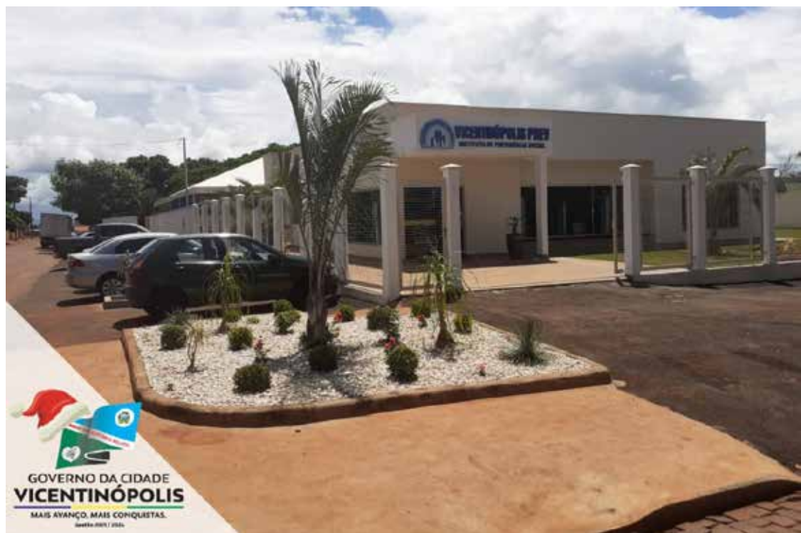
Vicentinópolis Prev: seriedade com a previdência dos servidores municipais