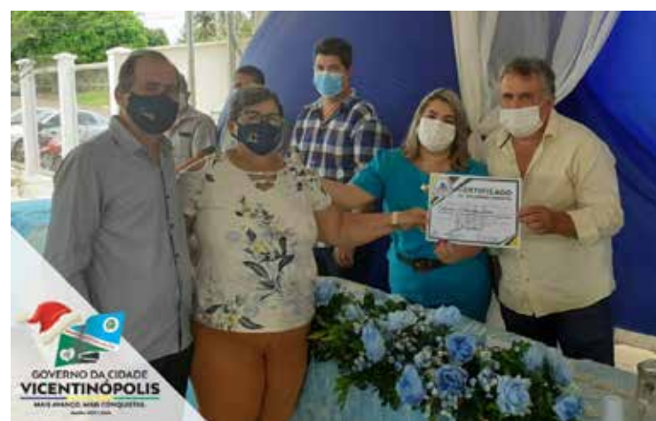
Entrega de certificado de reconhecimento aos servidores do município de Vicentinópolis

Rua Paranaíba - Bairro Paranaíba nº 1283 Telefone: (64) 3431-7311