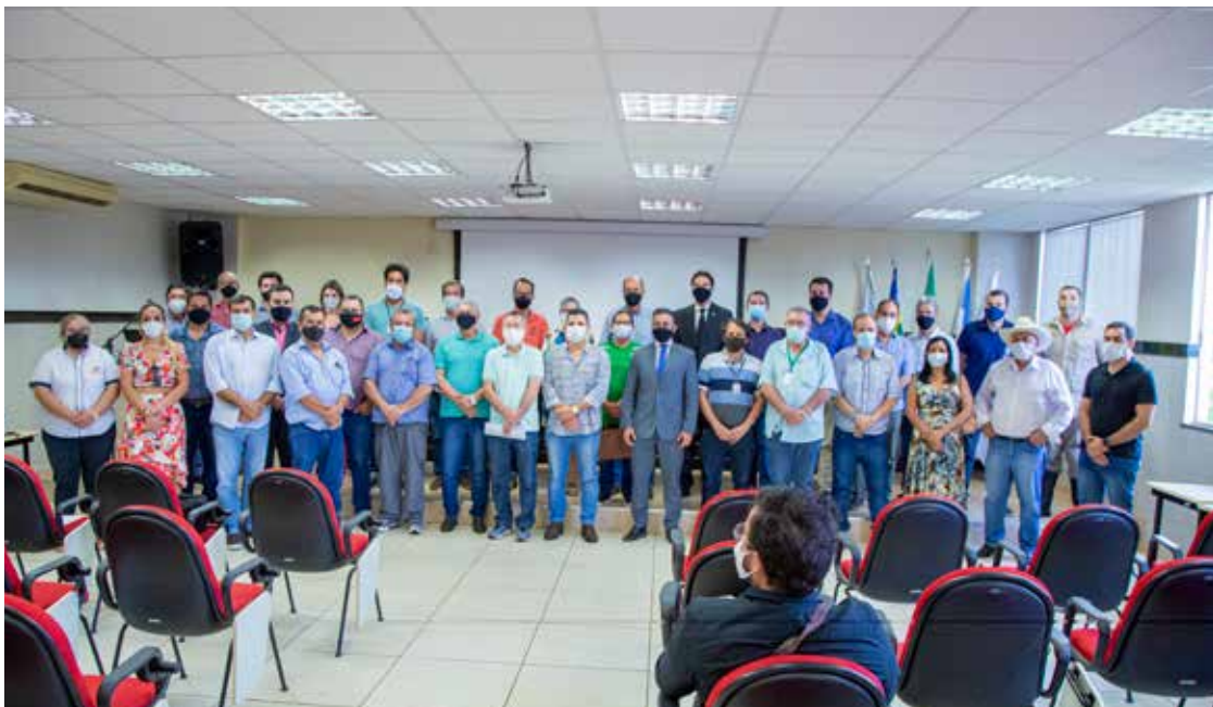
Prefeito Dione Araújo com novos membros do Conselho de Desenvolvimento Urbano

Os novos membros do COMDUR, o Conselho Municipal do Desenvolvimento Urbano, de Itumbiara, tomaram posse nesta sexta-feira, dia 1º de outubro, numa reunião no auditório do Complexo Administrativo da Saúde, no Se-