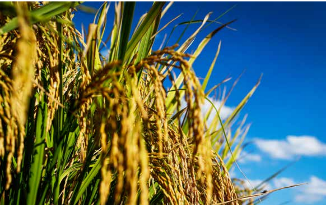
Lavoura de arroz cresceu 29%. Goiás também aumentou produção de feijão e mandioca

O Produto Interno Bruto (PIB) goiano cresceu 4,4% no segundo trimestre de 2021, em comparação com o mesmo período do ano anterior. A informação é do Boletim da Economia Goiana, produzido pelo Instituto Mauro Borges (IMB). O estudo aponta sinais de recuperação do processo produtivo no Estado, alavancado pelo melhor desempenho de setores como pecuária, indústria, serviços e comércio, em relação aos meses de abril, maio e junho de 2020, início da pandemia de Covid-19.