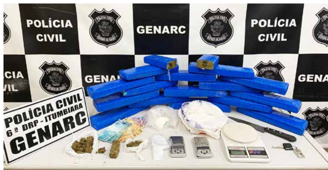
Drogas apreendidas com traficante no Bairro Nossa Senhora da Saúde

caína e maconha, além de objetos e insumos usados para a preparação da droga. O indivíduo, de 35 anos, que já possui anotação criminal por tráfico de drogas, foi conduzido à sede do Genarc e autuado em flagrante pelo crime de tráfico de drogas, e posteriormente recolhido à Unidade Prisional da região, onde permanecerá à disposição da Justiça.