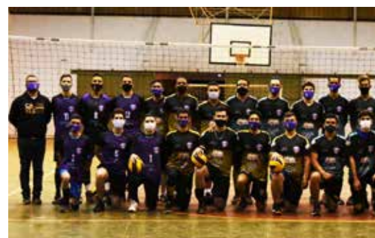
Associação Vôlei Mais Itumbiara

A Associação Vôlei Mais Itumbiara é um projeto voluntário de integração de jovens e adultos da comunidade ao esporte. Com mais de 25 atletas, a associação sobrevive com o suporte de empresas parceiras e de eventos beneficentes para custear gastos essenciais e oferecer melhor qualidade para os jovens, que hoje contam com assistência nutricional, fisioterapia e academia regularmente. No próximo mês, a equipe participará da maior liga do estado e a segunda maior do Brasil, a Liga Goiana de Vôlei que conta com mais de 120 equipes e com uma representati-