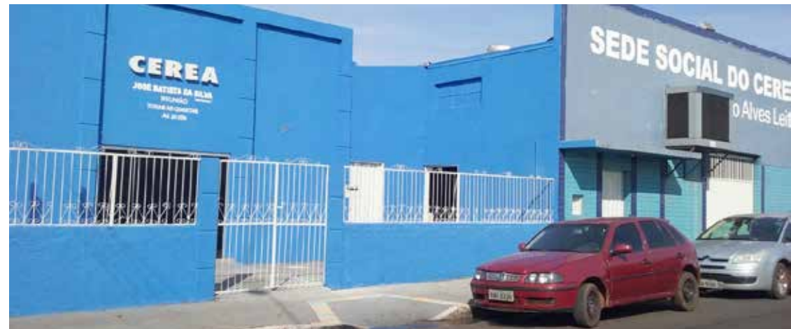
Sede do CEREA Itumbiara na Rua Marechal Deodoro, no Centro

A sede do CEREA fica na Rua Marechal Deodoro, 366, no Setor Central. Telefone: (64) 3404-8608.