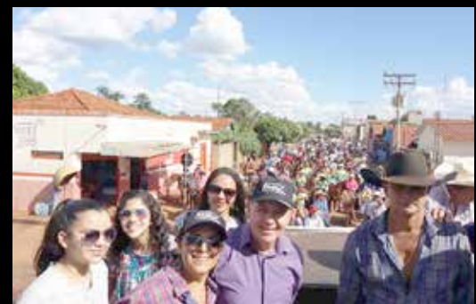
AVENIDA 13 REVITALIZADA PELA PREFEITURA; ENTREGA DE NOVOS VEÍCULOS PARA A FROTA DO MUNICÍPIO E CAVALGADA DO TRABALHADOR PELAS RUAS DA CIDADE