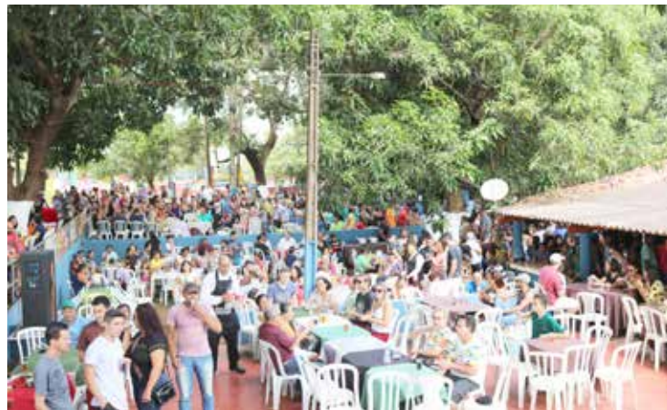
A Festa da Família, como foi chamada, lotou todo o Clube do Servidor e foi marcada pela organização e clima festivo