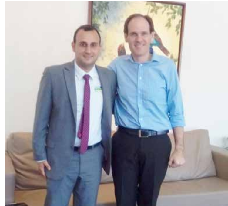
Vereador Neto Karfan e o presidente da Assembleia Legislativa, deputado Lissauer Vieira: visita a Itumbiara em breve

"Eu reuni com as famílias que têm inscrições da Prefeitura no dia 12 de abril e o diretor de Habitação Dalminho se comprometeu de arrumar a documentação para a Prefeitura formalizar o convênio e fazer a contrapartida. E no dia seguinte já fui para Goiânia atrás de recursos e conversei com o presidente da Assembleia deputado Lissauer, que está assumindo este compromisso comigo e com o povo de Itumbiara", afirmou Neto Karfan. Ele está preparando a visita do presidente da Assembleia a Itumbiara para os próximos meses e acredita que se ele confirmar a emenda, os recursos sairão, já que o Orçamento Impositivo está