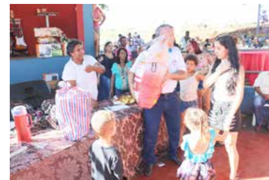
Sorteio e entrega dos prêmios aos servidores efetivos da Prefeitura que são filiados ao Sinditumbiara