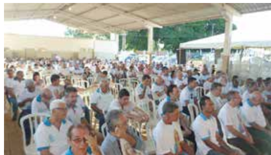
Reza do Terço seguida por café da manhã oferecido aos participantes

ORIGEM- O Terço dos Homens em Itumbiara começou no dia 22 de abril de 2006, na porta da Igreja de São Pedro e São Paulo, no Bairro Paranaíba, com a presença de sete homens. 13 anos depois, o grupo reúne cerca de 300 participantes. As reuniões são realizadas aos sábados, às 7h em ponto, nas residências dos membros, de pessoas que solicitam a reza do terço ou ainda em empresas, hospitais, entidades e outros locais onde há o chamado de fé. Além das ações sociais realizadas semanalmente, o Terço dos Homens é responsável pela distribuição das cestas básicas da Campanha Natal Solidário da Diocese de Itumbiara.