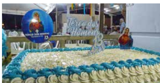
Confraternização do Terço dos Homens na Área de Lazer de Furnas