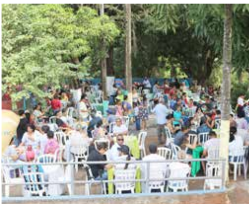
Ambiente da Associação ficou lotado com a presença maciça dos servidores e seus familiares para festejar o Dia do Trabalhador