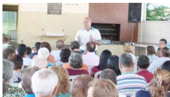
Palestra sobre fé e família realizada na Área de Lazer de Furnas