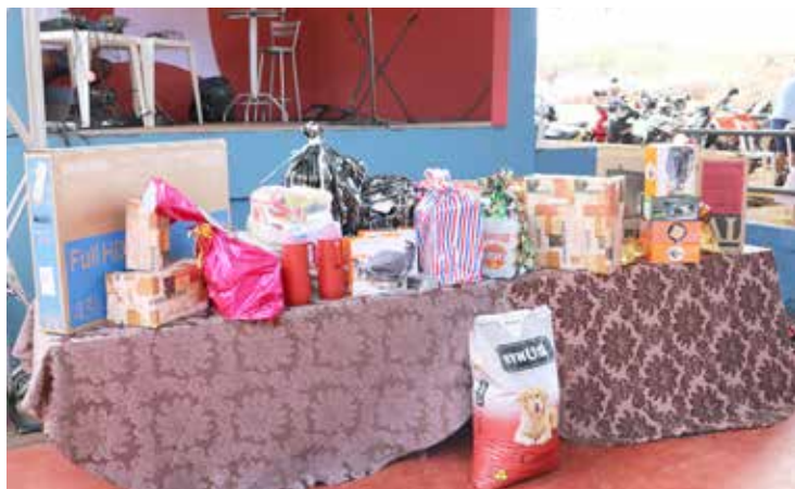
37 prêmios doados por parceiros do Sinditumbiara foram sorteados entre os servidores filiados ao Sindicato