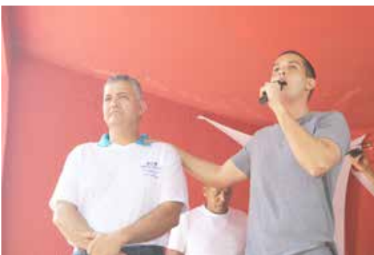
Prefeito Zé Antônio discursa na festa