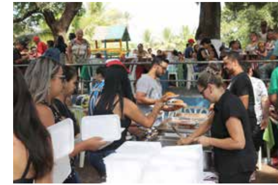
Almoço para cerca de 3 mil pessoas, entre servidores e familiares, foi servido na sede do Sindicato para comemorar o 1º de Maio