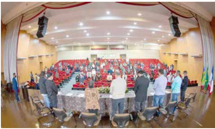
Encontro dos Gestores de unidades escolares no Teatro Municipal