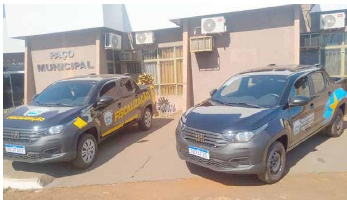
Caminhonetes Strada 0Km vão atender departamentos de Fiscalização e Obras