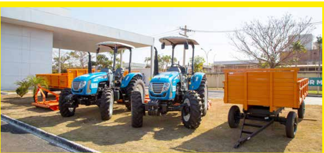
ADQUIRIDO COM RECURSOS PRÓPRIOS Prefeitura investe R$ 820 mil na compra de cinco tratores equipados com roçadeiras e carretas para a Secretaria Municipal de Ação Urbana Página 4