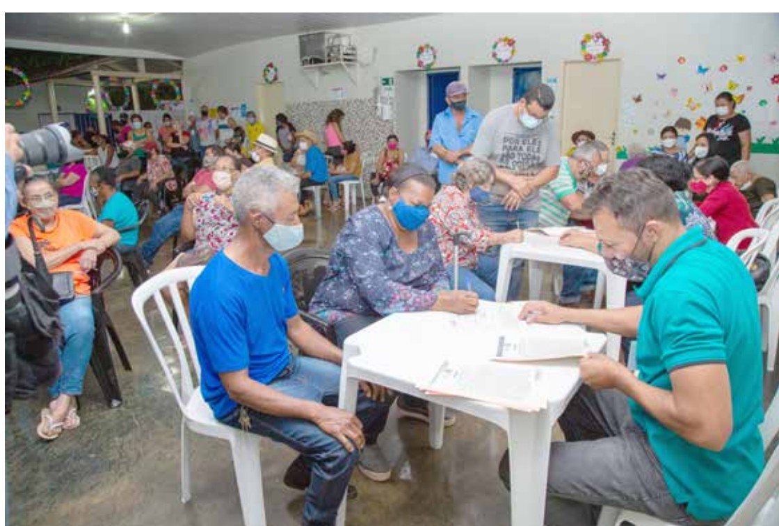
Moradores da Vila Mutirão assinam escrituras junto com equipe da Agehab e Prefeitura de Itumbiara: após o registro em cartório, irão receber os documentos de propriedade