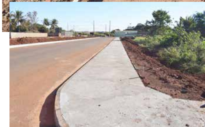
ARAPORÃ Construção de calçadas no trecho final da Avenida Afonso Pena em Araporã, garantem maior segurança e acessibilidade para os moradores. Mais uma obra executada pela prefeita Renata Borges