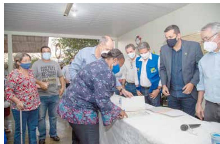
Moradores da Vila Mutirão assinam escrituras: após o registro em cartório, irão receber os documentos de propriedade

vernador Ronaldo Caiado, a equipe da Agehab retomou o cadastramento de imóveis no município justamente pela Vila Mutirão.