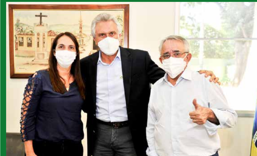
Prefeita de Bom Jesus Sivalda Fernandes, governador Ronaldo Caiado e o deputado estadual Álvaro Guimarães

O prefeito de Panamá saiu muito otimista da reunião com o governador, agradecendo as obras e benefícios e destacou a força do deputado Álvaro Guimarães junto ao governo, reforçando a parceria administrativa e política.