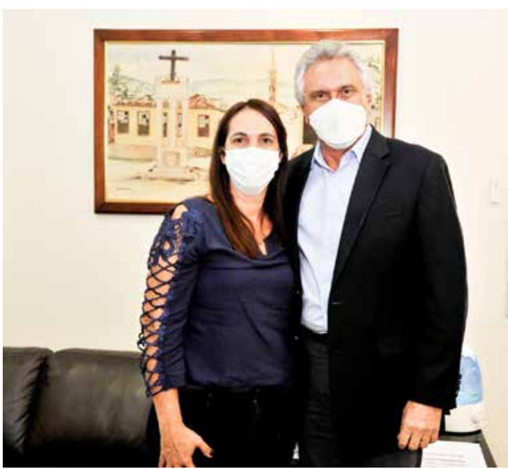
Prefeita interina de Bom Jesus Sivalda Fernandes (PSD) com o governador Ronaldo Caiado (DEM)