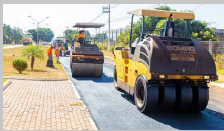
Serviço de recapeamento no DIAGRI teve início no último sábado pela GOINFRA

representantes da Prefeitura de Araporã e os professores da UFU. Depois, os participantes fizeram uma vistoria na Ponte Affonso Penna. Na reunião, ficou definido que as duas prefeituras terão uma cooperação para reformar a ponte, que pode durar até dois anos. A reforma poderá ser feita com recursos próprios, com verbas vindas de órgãos federais ou ainda com a participação de empresas privadas. Mas alguns reparos já serão feitos de imediato. PATRIMÔNIO HISTÓRICO Instalada em 1909, ano da emancipação político-administrativa de Itumbiara (na época, Santa Rita do Paranaíba), a Affonso Penna é uma ponte pênsil. Depois da construção da Ponte Ciro de Almeida, na BR-153, nos anos 1960, ela ficou desativada. No início dos anos 1970, foi transferida para o local onde está até hoje. A ponte é tombada como patrimônio histórico pelo IPHAN, o Instituto do Patrimônio Histórico e Artístico Nacional.