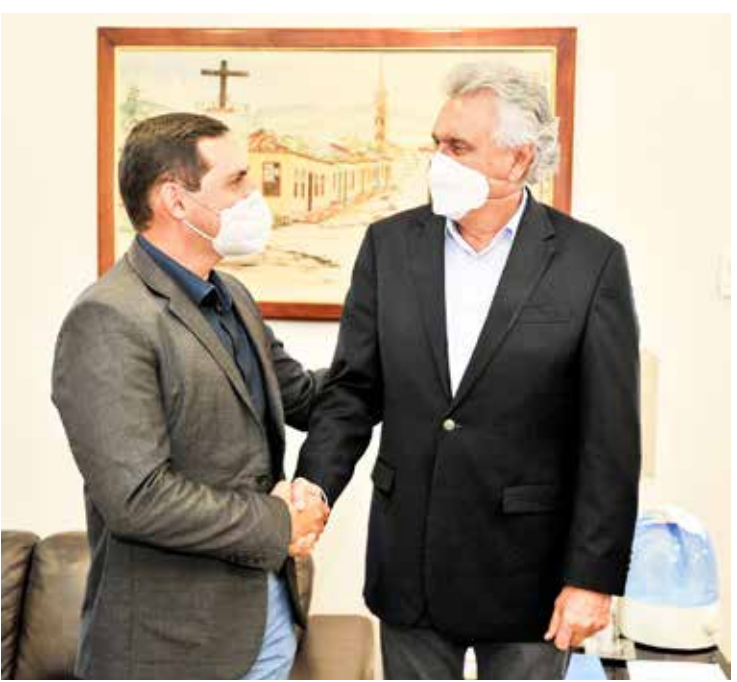
Prefeito de Panamá Zé Willian (PL) com o governador Ronaldo Caiado (DEM)