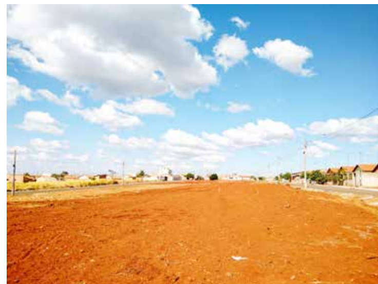
Local onde será construída a Praça Ayrton Senna

De acordo com André, os recursos são federais. “As praças serão reformadas com recursos da emenda do ex-deputado Alexandre Baldy, já a construção da terceira praça só foi possível devido à emenda do ex-deputado Pedro Chaves. Eu, em nome de toda a população buritiegrense, quero agradecê-los por essa parceria”, reforça o prefeito.