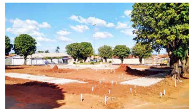
Reforma da Praça Rui Barbosa

Parabéns BURITI ALEGRE pelos 94 anos de progresso, fé, trabalho e qualidade de vida.