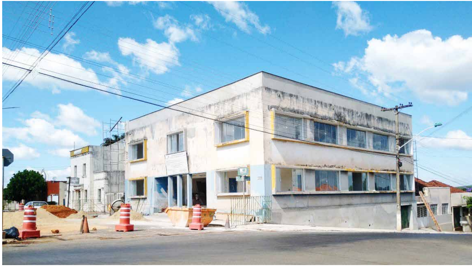
Ampla reforma do Prédio da Prefeitura de Buriti Alegre