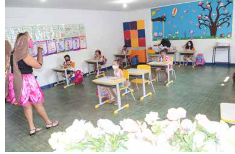
Professora trabalha gêneros textuais com alunos do 5º ano

Na etapa seguinte, esses alunos serão estimulados a representar, recontar e reproduzir essas histórias através da contextualização (textos e desenhos), imprimindo a sua interpretação e a sua imaginação. Todo esse material será transformado em um e-book e um livro impresso onde cada aluno terá a oportunidade de ilustrar a sua própria história. A culminância do Projeto Meu Primeiro Livro Digital: Sou Escritor! está prevista para acontecer no mês de setembro com a apresentação dos livros.