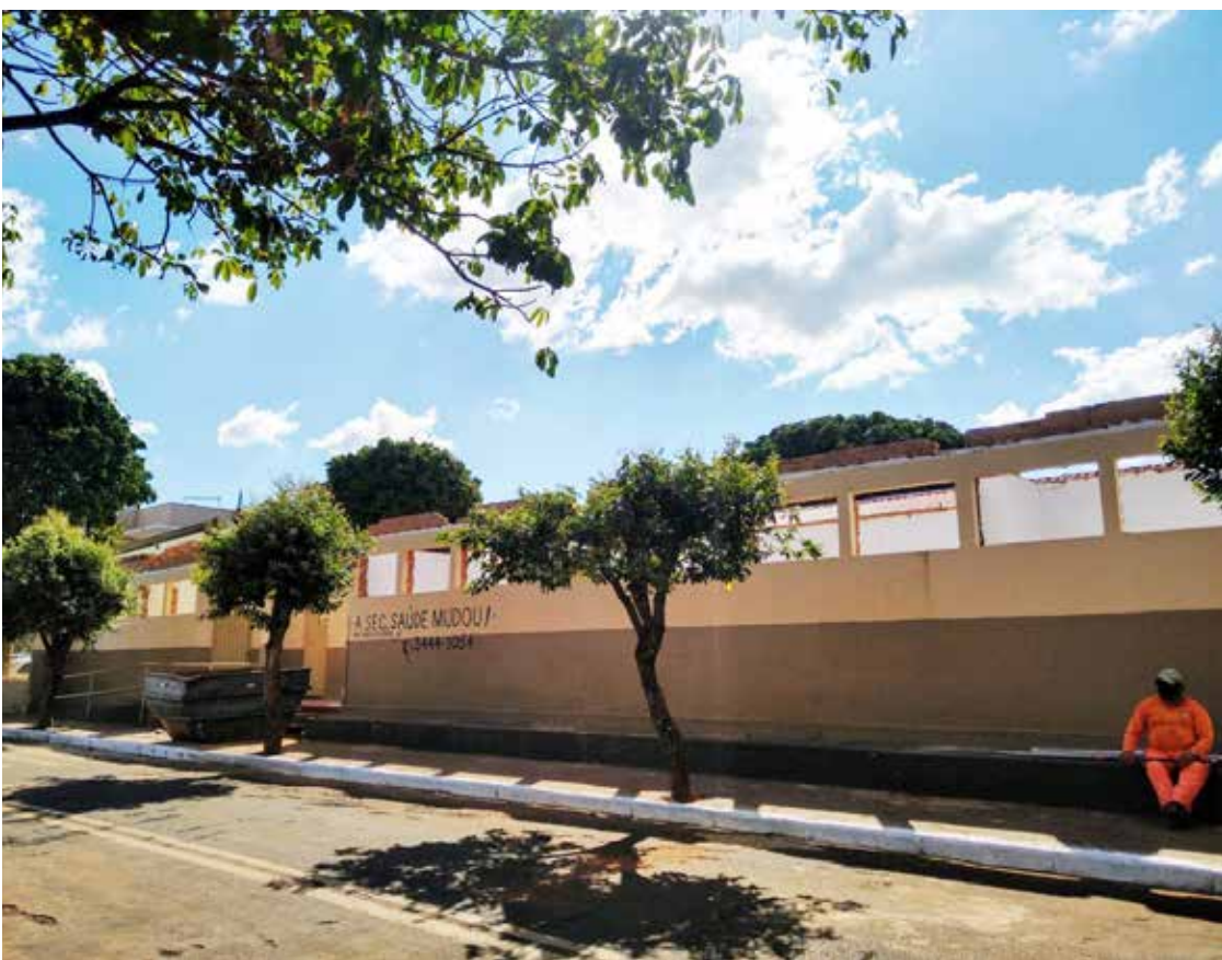
Secretaria Municipal de Saúde fica na Rua Xavier de Almeida, 367

A Secretaria de Saúde está funcionando, provisoriamente, na Rua Xavier de Almeida 367, de segunda a sexta, das 7h às 11h e de 13h às 17h. Mais informações pelo telefone (64) 3444-1054.