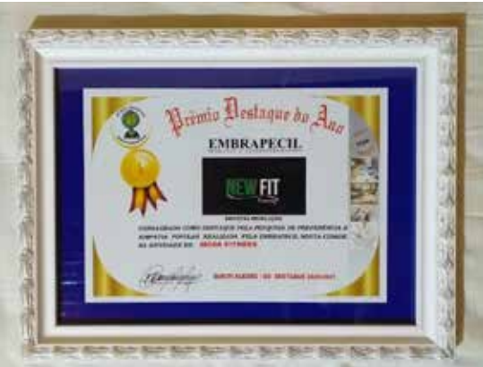
NEW FIT TRAINING A sua Loja Fitness Av. José Messias Ferreira, 1.907 - Sala 01 Tel.: (62) 99992-8573