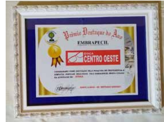
ÓTICA CENTRO OESTE Exames de vista todos os meses, óculos de grau e esportivos, armação e receituários Rua José Sinhá, 815 / Tel.: 3444-3546