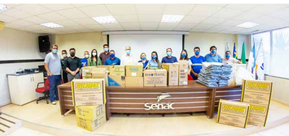
Secretaria Municipal de Saúde, HMMC e UPA recebem doação da Louis Dreyfus