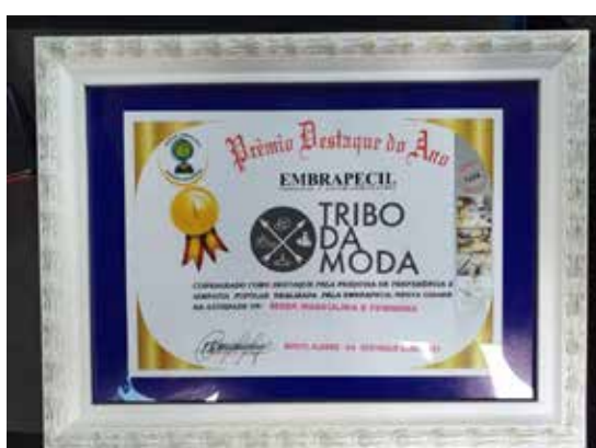
TRIBO DA MODA Moda masculina, feminina e acessórios Rua Frederico Dias Batista, 736 Tel.: 98417-2933