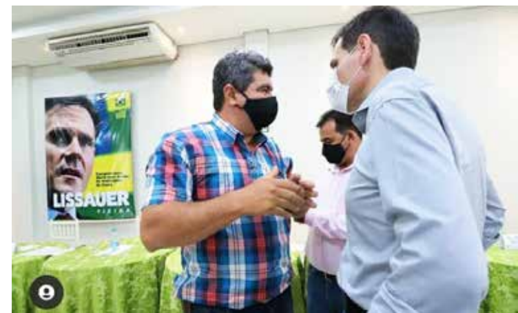
Prefeito de Gouvelândia Fausto Caiado com o deputado estadual Lissauer Vieira