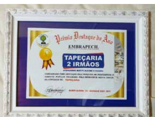
TAPEÇARIA 2 IRMÃOS Fabricação e reforma de estofados Rua Dr. Couto Magalhães, em frente a Rodoviária Tel.: 98401-3711