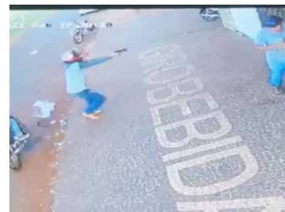
Câmera de segurança captou o momento da tentativa de homicídio no Bairro Alcides Rodrigues

tráfico, lesão corporal, ameaça, dano, uso de documento falso e agora se encontra indiciado por mais um homicídio qualificado.