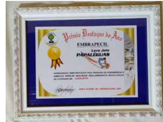
LAVAJATO PAPALÉGUAS Rua José Marra de Castro, 772 Tel.: 98403-7092