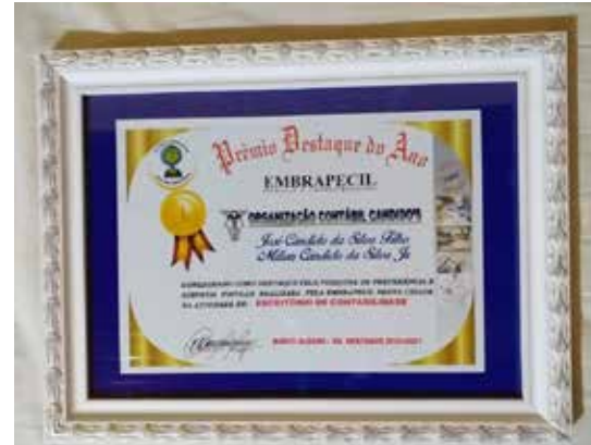
ORGANIZAÇÃO CONTÁBIL CÂNDIDO'S Contabilidade, Registro de Firmas, Contratos e Declarações de Imposto de Renda Rua Luziano Inácio, 671 / Tel.: 3444-1382