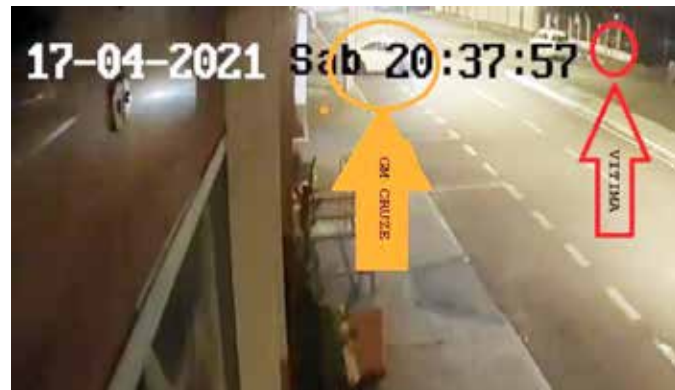
Imagens de câmera mostram o momento da tentativa de homicídio contra o travesti e ao lado arma e munições apreendidas na casa do suspeito, que acabou preso

De acordo com o apurado, o investigado e a travesti que trabalhava como garota de programa na Avenida Afonso Pena tiveram uma discussão naquela noite. Após o desentendimento, o suposto autor saiu do local e retornou portando uma arma