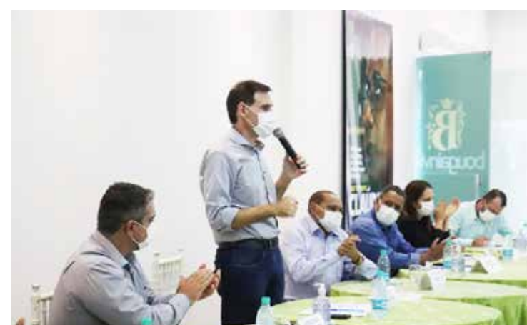
Municípios da Região Sul participaram do 1º Encontro de Desenvolvimento realizado em Cachoeira Dourada