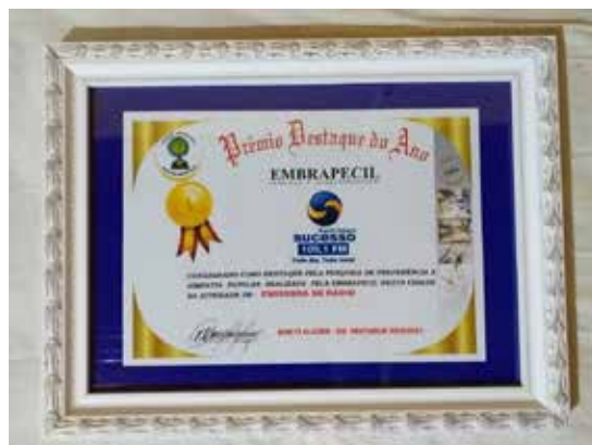
RÁDIO SUCESSO FM (105,1) Todo dia, toda hora!