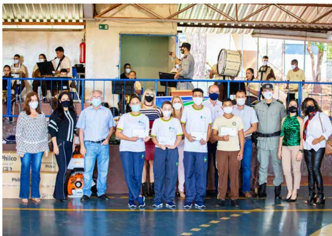
Entrega dos cartões de alimentação no Colégio da Polícia Militar, em Itumbiara

Cada cartão possui o crédito de R$30,00 por aluno, para a compra de itens alimentícios, e irá substituir os kits de alimentação, que foram entregues mensalmente pelas escolas estaduais.