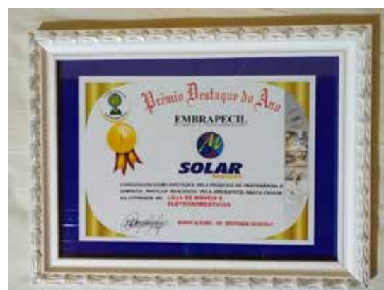
SOLAR MAGAZINE Móveis e Eletrodomésticos Av. José Messias Ferreira, 1.745 Tel.: 3444-2666