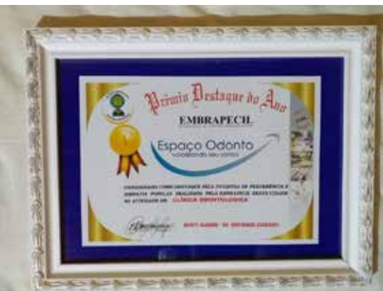
ESPAÇO ODONTO Implantes, Ortodontia, Endodontia, Clínica Geral e Cirurgias Rua 24 de Junho, 1.205 / Tel.: 3444-1218