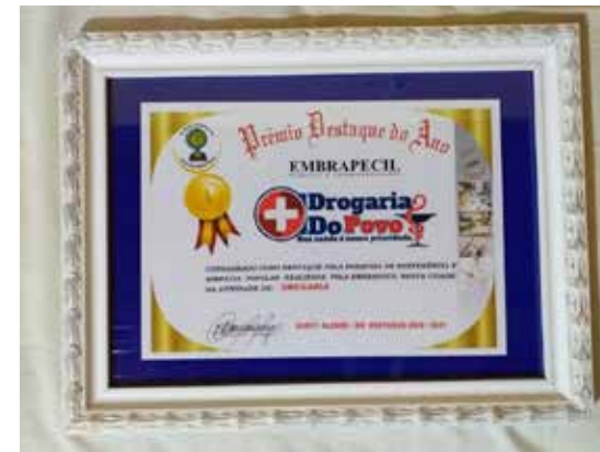
DROGARIA DO POVO Av. José Messias Ferreira, 936 Tel.: 3444-1339