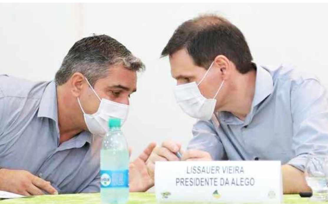
Prefeito de Cachoeira Dourada Rodrigo Rodrigues e o deputado Lissauer Vieira