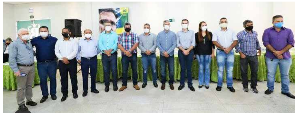
Lideranças da Região Sul reunidas em Cachoeira Dourada: movimento municipalista