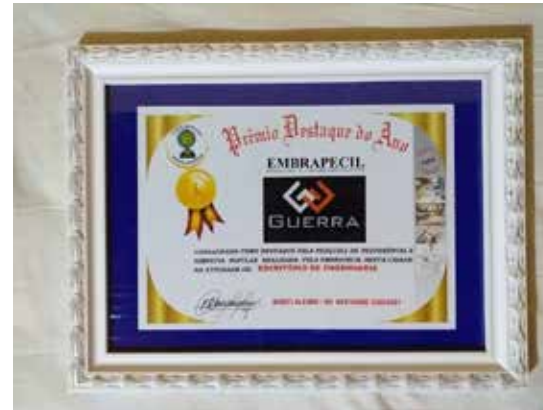
GUERRA ENGENHARIA E SOLUÇÕES Construtora e Engenharia Rua Maciel, 342 / Tel.: (62) 98111-0790