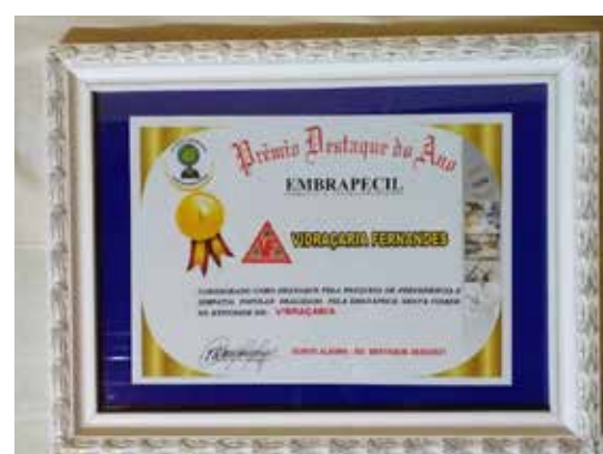
VIDRAÇARIA FERNANDES Av. José Messias Ferreira, 956 Tel.: 3444-2666