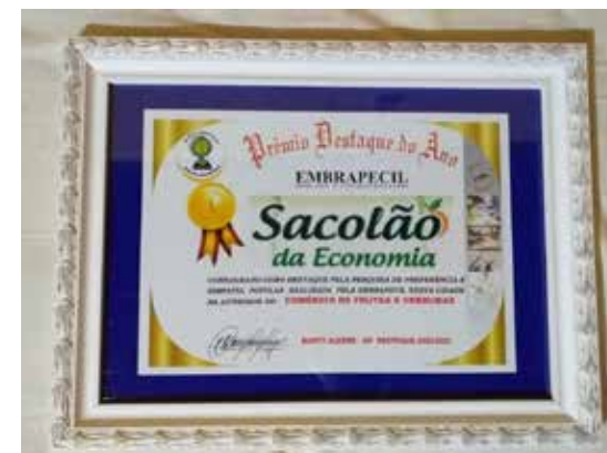
SACOLÃO DA ECONOMIA Frutas e verduras - preço baixo todo dia Av. José Messias Ferreira, Q43 Lt 151-D Tel.: 3444-1088