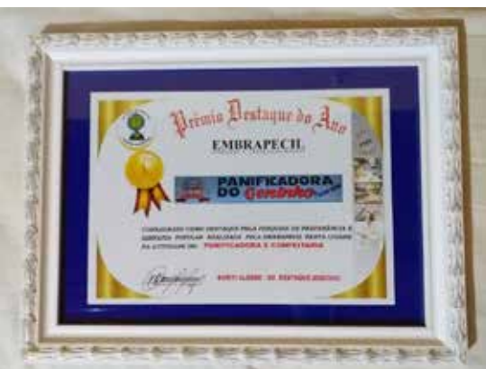
PANIFICADORA DO GENINHO Aberto das 6h às 19h - Aceitamos encomendas Av. José Messias Ferreira, 946 Tel.: 3444-2680