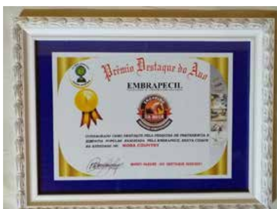
SHOPPING DA ROÇA Moda Country e Produtos Agropecuários Rua Maciel, 1.091 / Tel.: 3444-2030