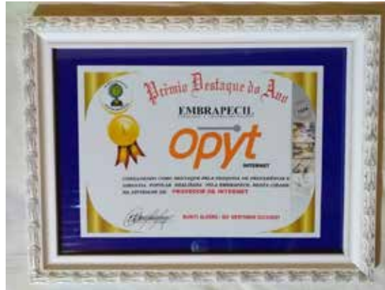
OPYT INTERNET Provedor de internet Av. José Messias Ferreira - Centro Tel.: 98453-6466