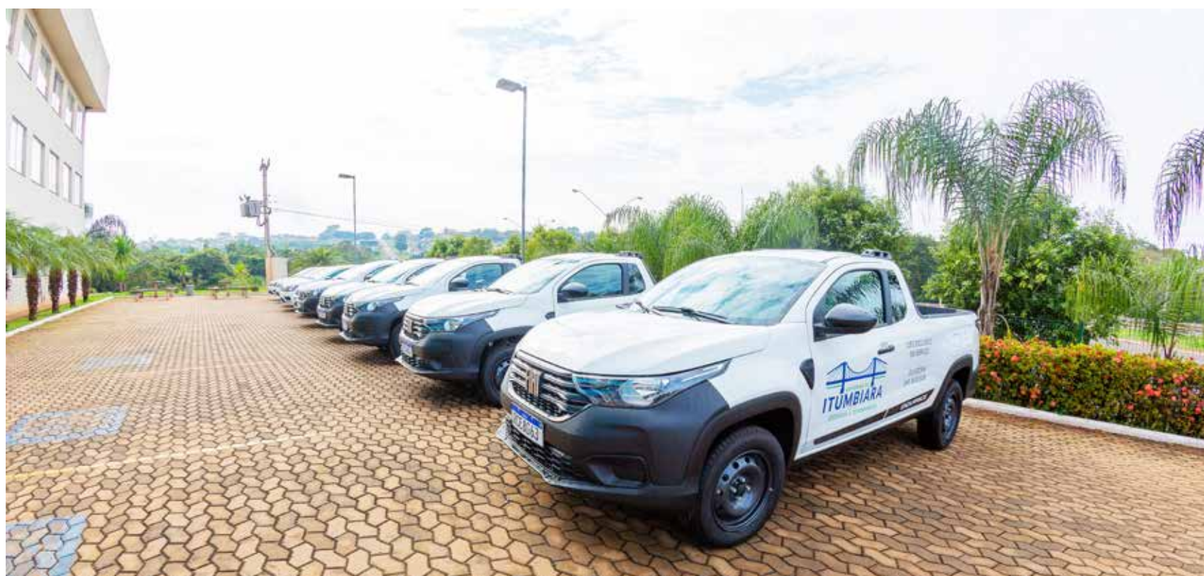
Prefeitura apresentou 5 veículos utilitários Strada e 5 Gol para atender várias pastas da administração municipal