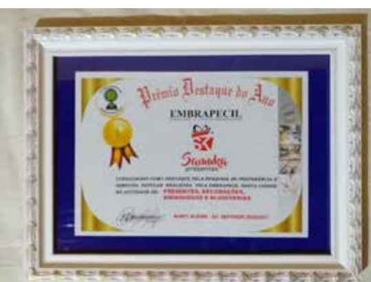
SAMUKA PRESENTES Presentes, decorações, brinquedos e bijuterias Av. José Messias Ferreira, 1939 - Loja 1 Tel.: 98407-3760