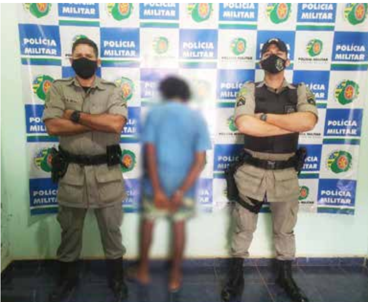
Homem foi preso pela PM após agredir um cachorro

O homem confirmou aos PMs a agressão, dizendo que teria batido em seu cachorro após o animal ter atacado os seus "pintinhos" o qual o mesmo criava. Relata ainda que usou de um pedaço de uma mangueira de jardim. A vizinha relatou que as agressões são rotineiras, A ONG Pata Solidária esteve no local para atender o cão e o homem acabou sendo detido, encaminhado para relatório médico e entregue na Polícia Civil para apuração do fato criminoso.