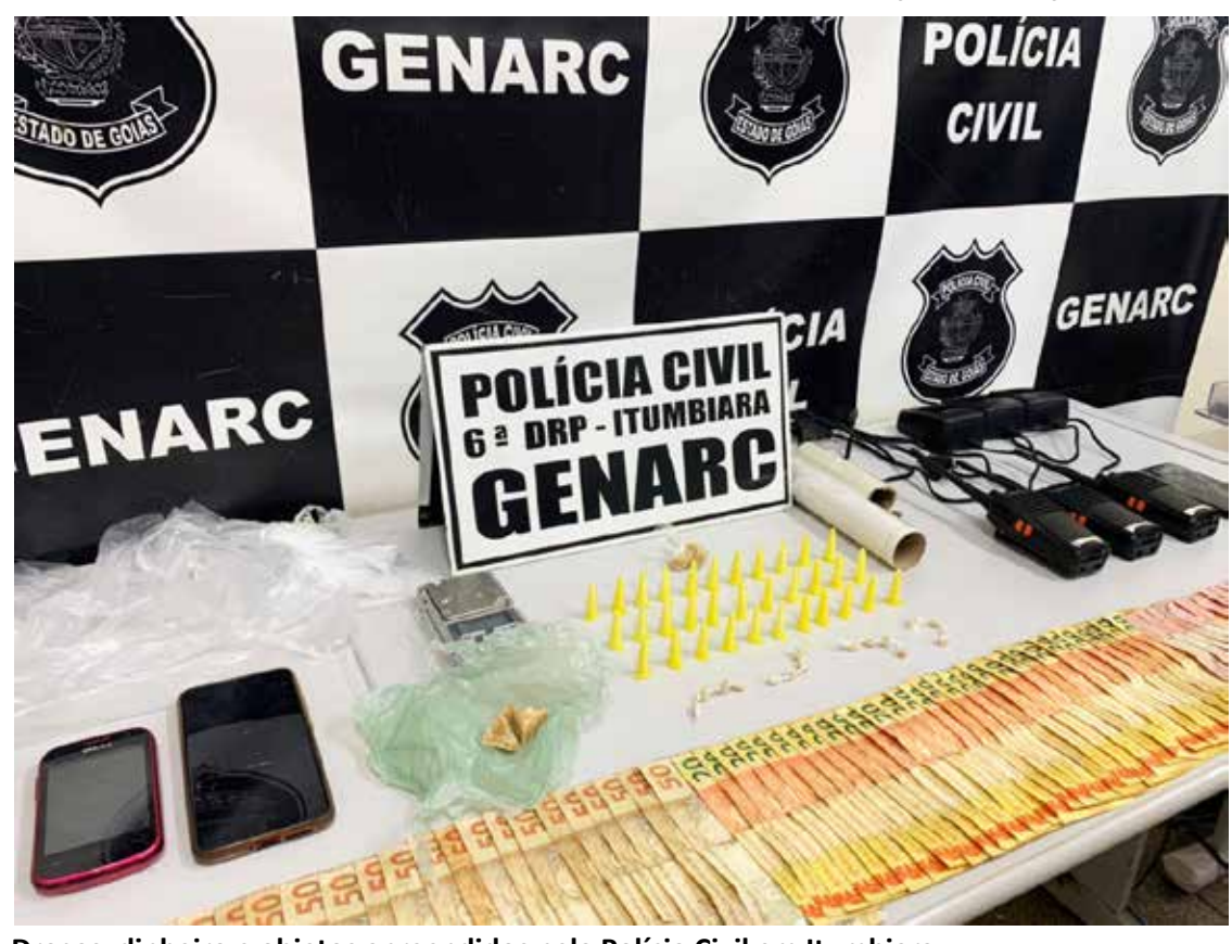
Drogas, dinheiro e objetos apreendidos pela Polícia Civil em Itumbiara

ainda R$ 1,8 mil em dinheiro. Ambos os indivíduos, que já possuem registro criminal por tráfico de drogas e roubo, foram autuados em flagrante pela prática dos crimes e posteriormente recolhidos na Unidade Prisional de Itumbiara, onde permanecerão à disposição da Justiça.