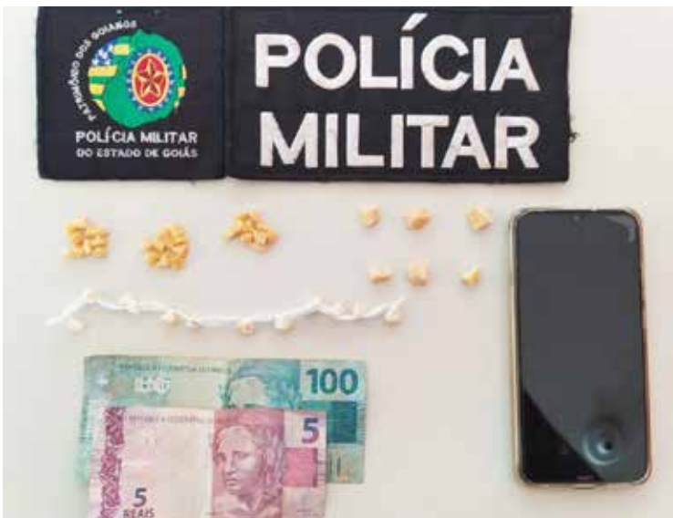
Drogas apreendidas pela PM no Bairro Caládia

O detido tem diversas passagens por crimes análogos a tráfico de drogas, furto e roubo, na cidade de Goiás. O autor e material ilícito foi entregue na Polícia Civil.